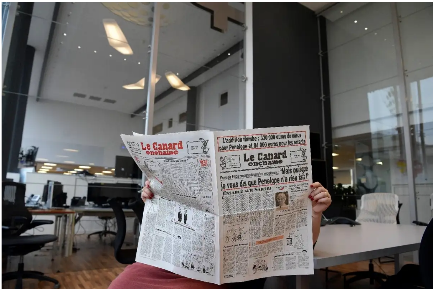
Emploi fictif au Canard enchaîné: deux dirigeants, un dessinateur et son épouse jugés en juillet

Publié le 14/12/2023 à 22h41, mis à jour le 14/12/2023 à 22h50