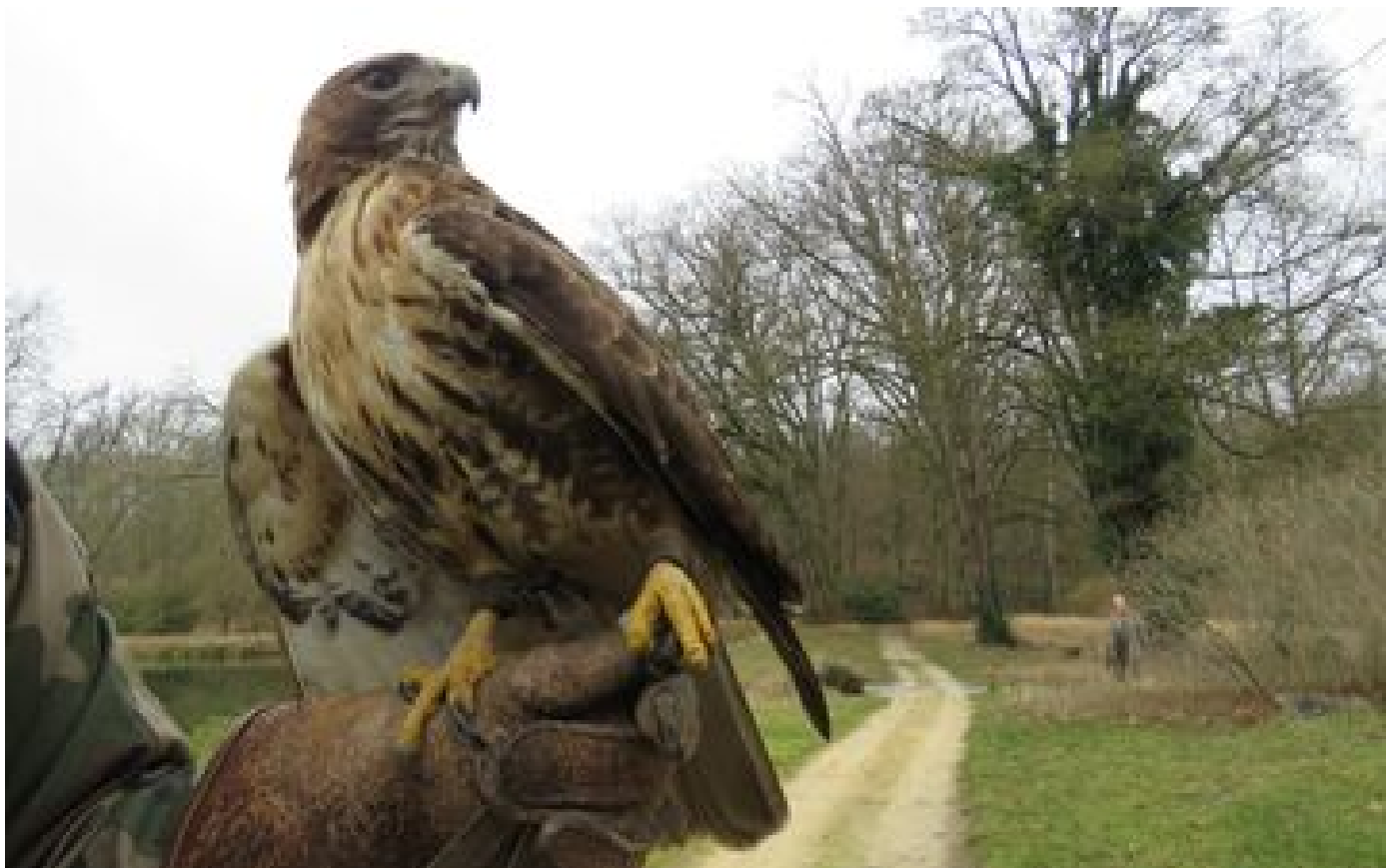
« Pas besoin de souffrance animale pour faire la fête » : dans l'Oise, une Fête des cochons sans faucons ? P