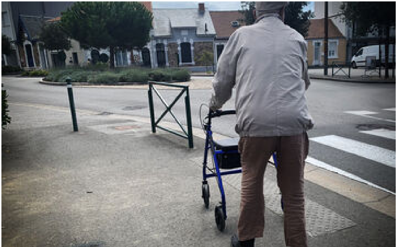
Oise : ivre, il frappe un septuagénaire en déambulateur et menace les gendarmes avec un cutter