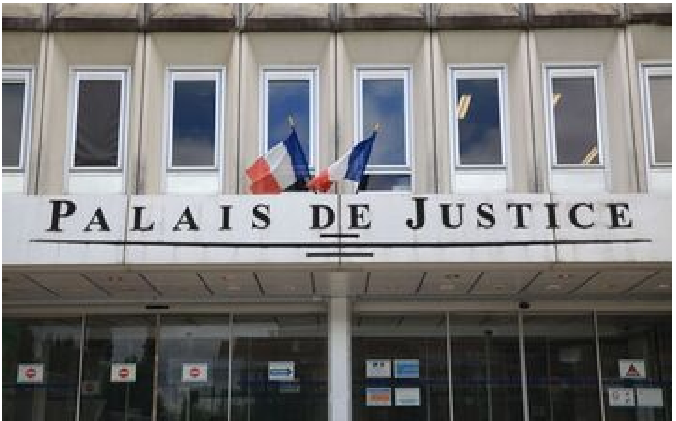
« Son dévouement s'est retourné contre lui » : une entreprise de l'Oise jugée après la mort de son ex-employé P