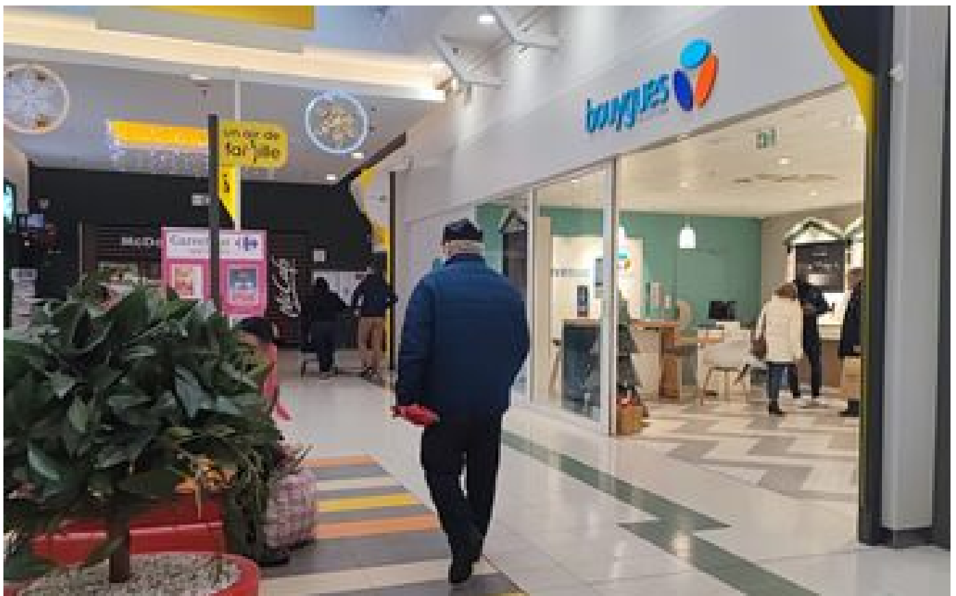
« Le butin n'a pas été retrouvé » : où sont les 171 téléphones volés dans un Bouygues Télécom de l'Oise ?