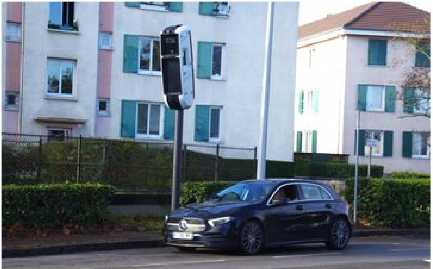
Un 102e radar tourelle dans l'Oise : sur les routes les plus contrôlées de France, la mortalité reste préoccupante P