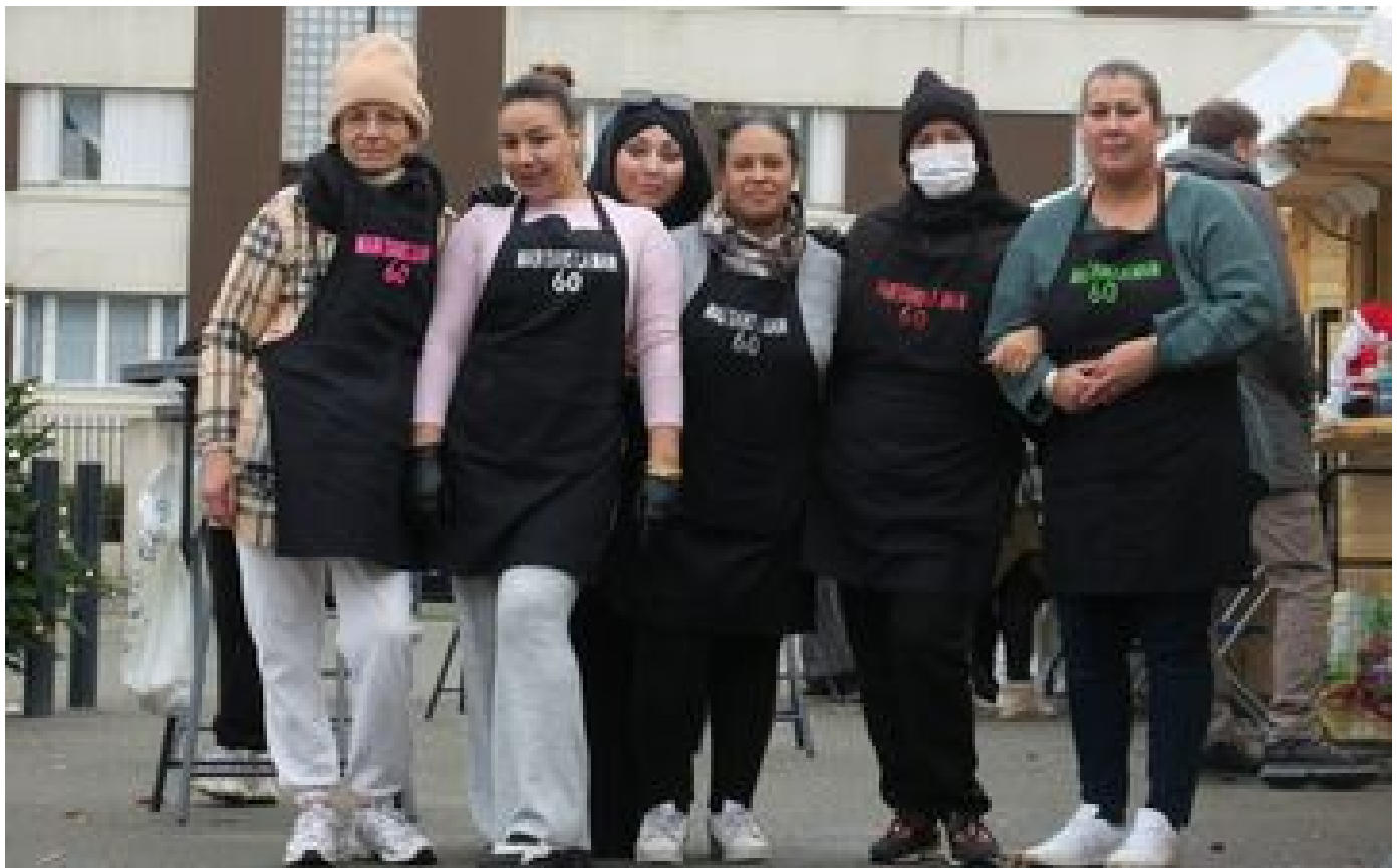
« On nous a collé une étiquette » : à Compiègne, les mamans veulent redorer l'image du Clos-des-Roses P