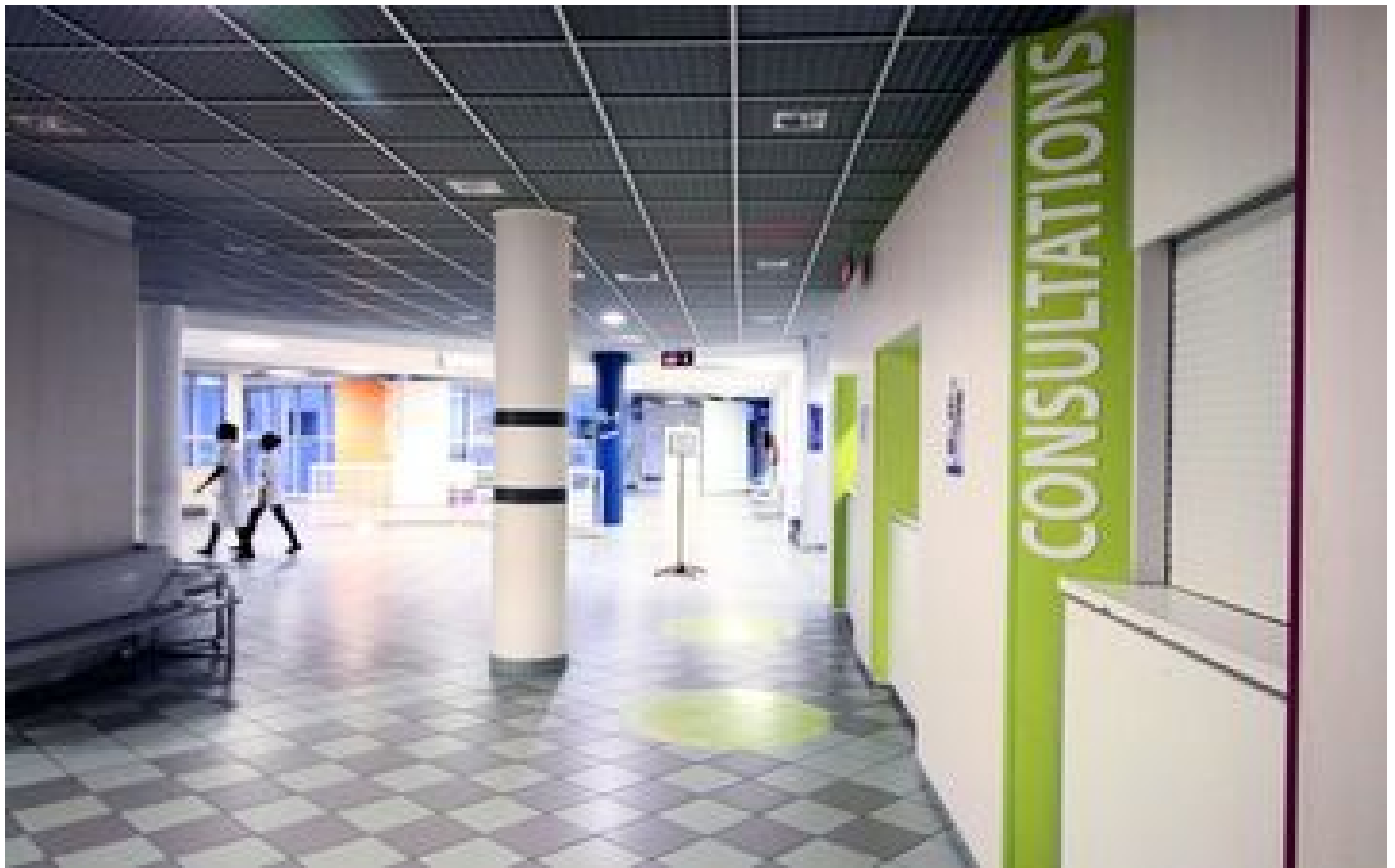
Situation « dramatique » à l'hôpital de Compiègne : « il y a des lueurs d'espoir », selon la directrice