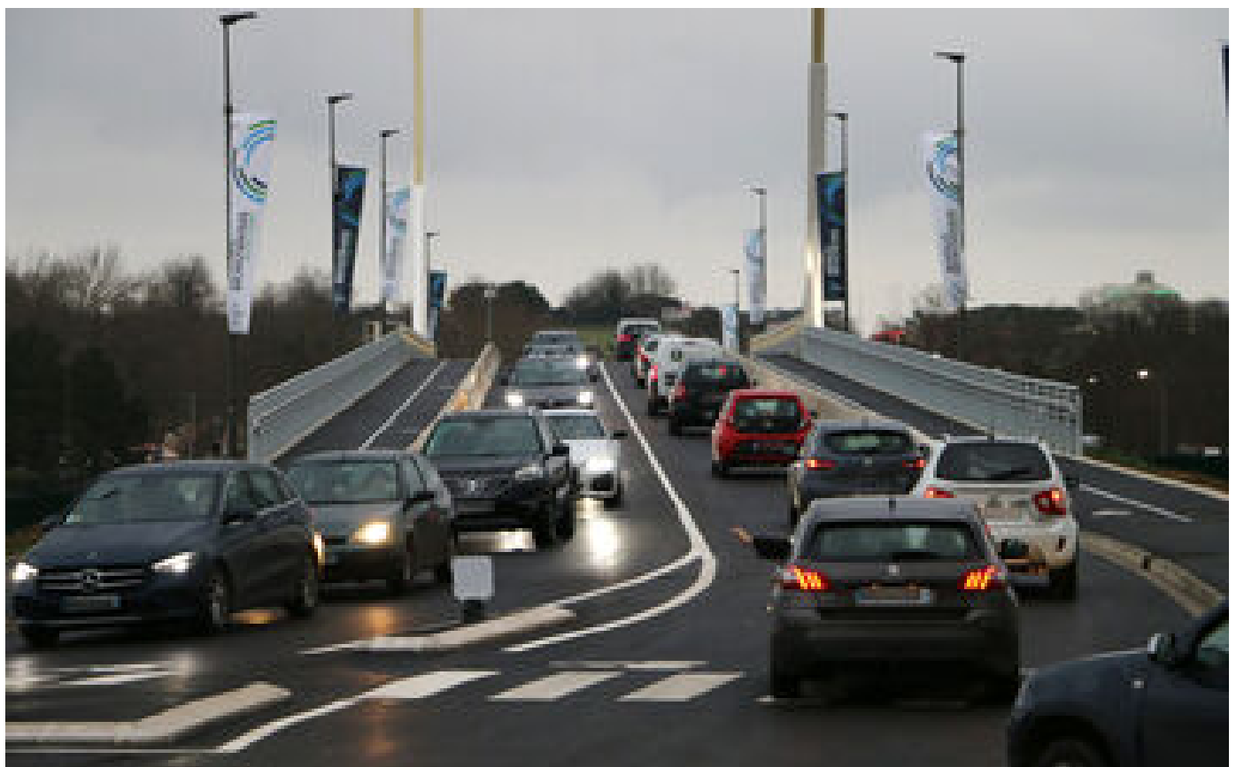
« La fin de la galère » : à Beauvais, les voitures roulent à nouveau sur l'avenue Blaise-Pascal P