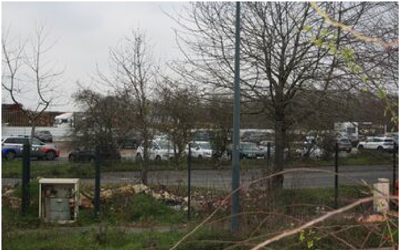
Face aux parkings sauvages de l'aéroport d'Orly, les élus en première ligne : « On m'a menacé » P