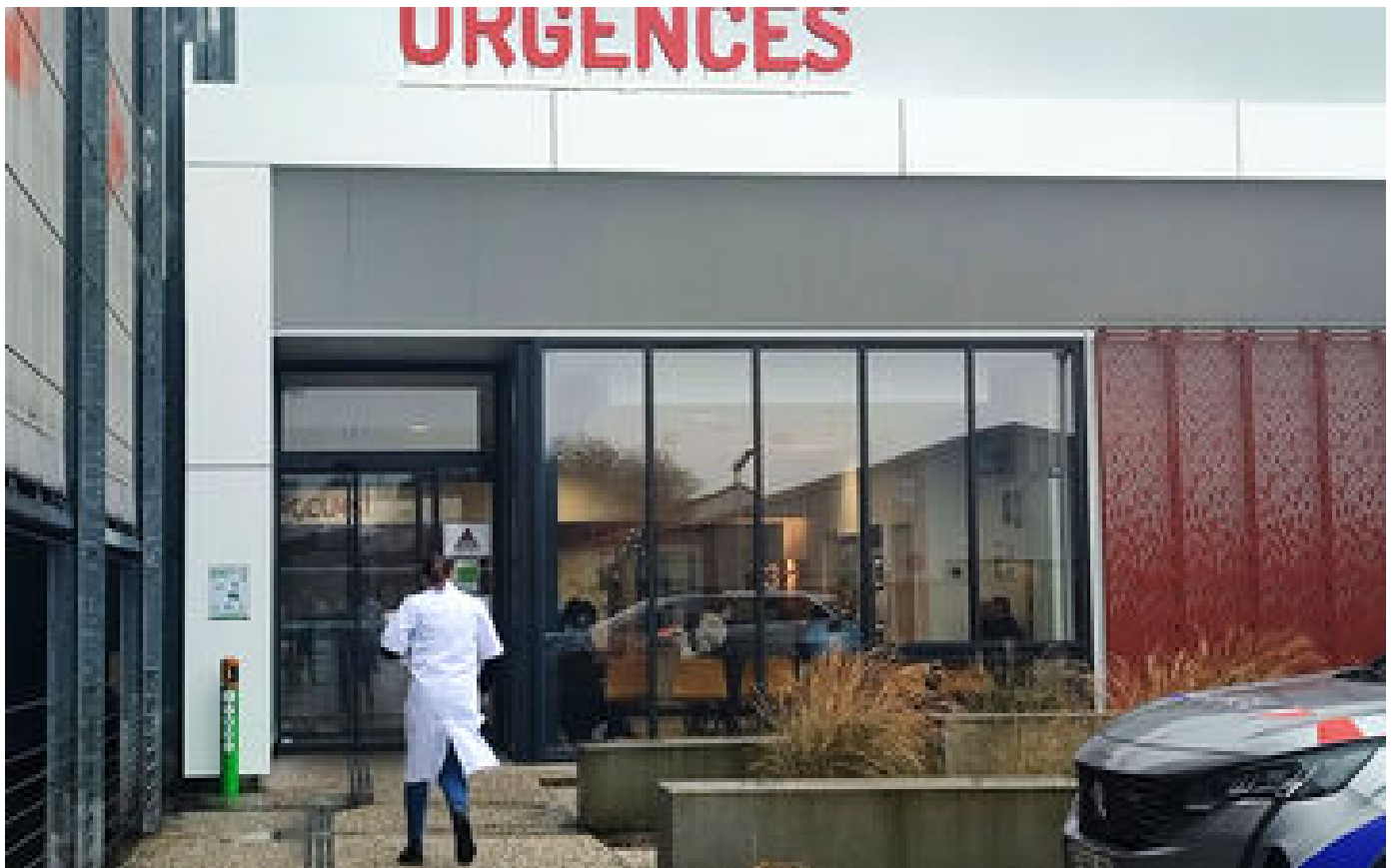
« Il faut qu'on nous aide » : à l'hôpital de Compiègne, des soignants dénoncent « une situation dramatique » P