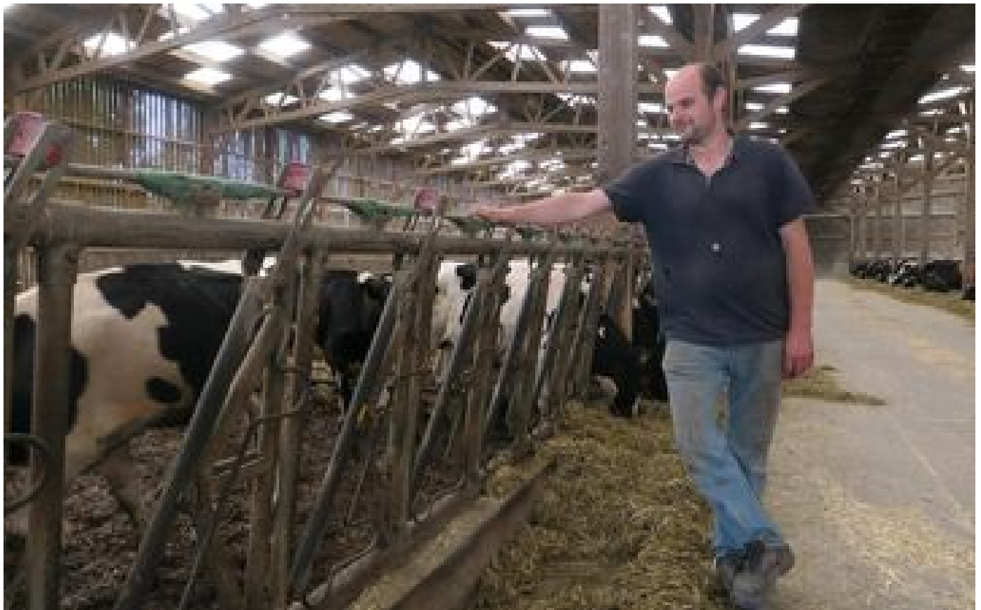
Condamné pour le bruit et l'odeur de ses vaches : une manifestation en soutien à l'agriculteur de l'Oise