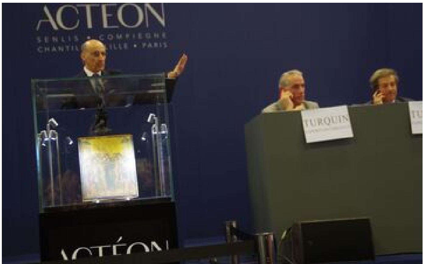
Après la vente du Cimabue, l'hôtel des ventes de Senlis Actéon gagne toujours plus en notoriété