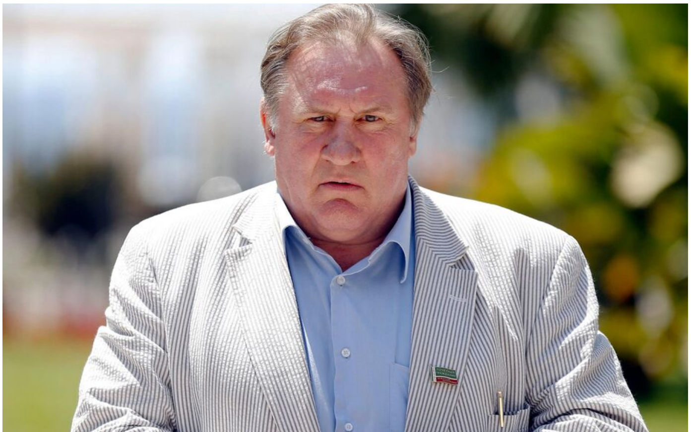
Gérard Depardieu, ici en 2013.

Le 16 décembre 2023 à 13h31, modifié le 16 décembre 2023 à 14h30