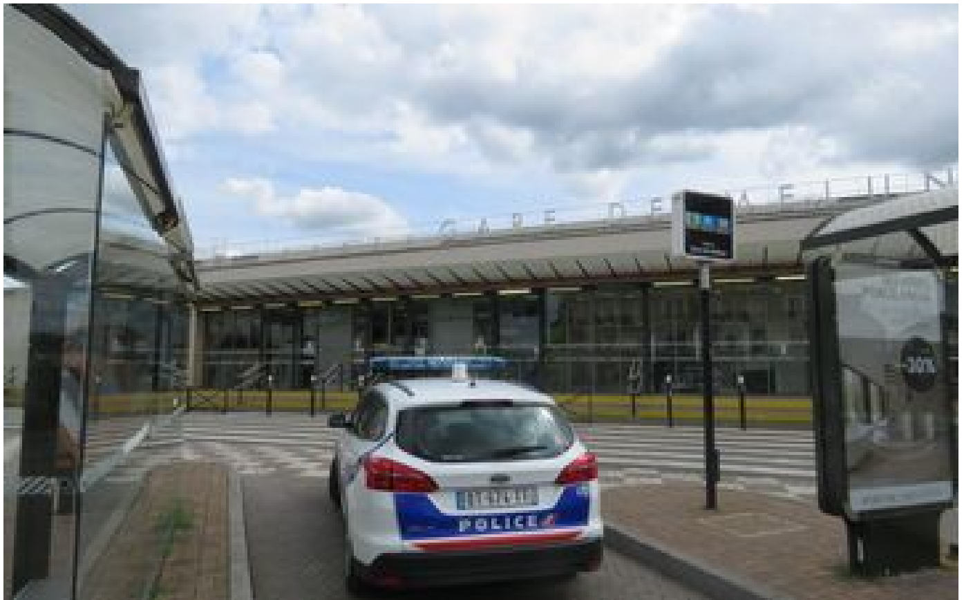
Seine-et-Marne : un bless  grave lors d'une rixe devant la gare de Melun