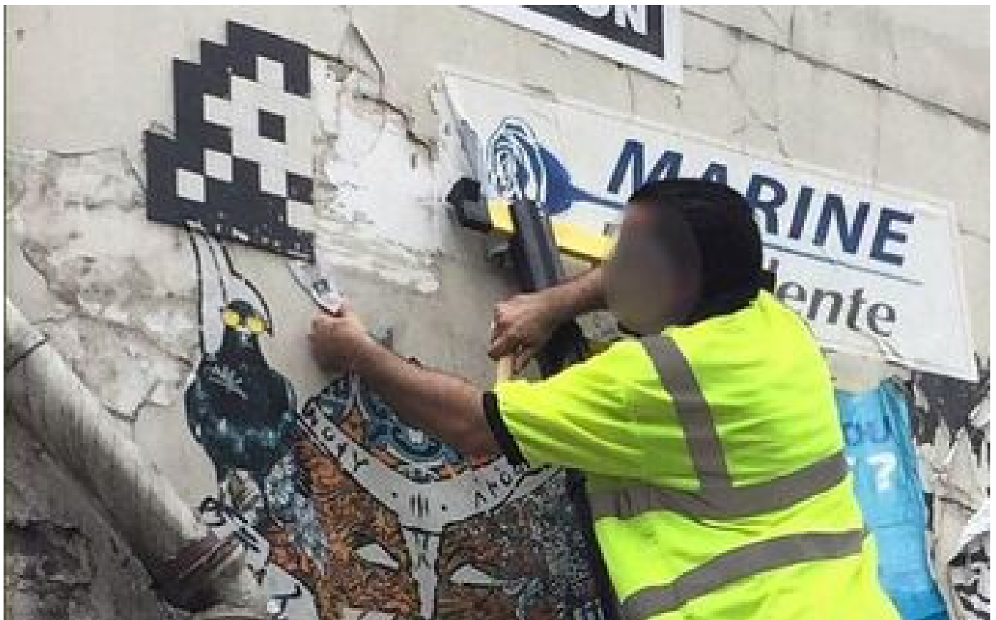
Arrachage des  uvres d'Invader : six ans apr s, le trio d'amis finalement condamn  pour vol P