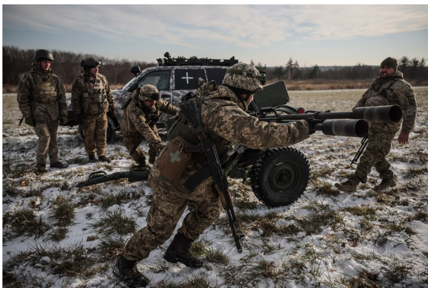
Des militaires ukrainiens montent un canon antiaérien ZU-23-2 près de Kiev, en Ukraine, le 30 novembre 2023.

Seuls seront dispensés des cours en salle sur le démontage et le remontage d'armes individuelles et les premiers secours.