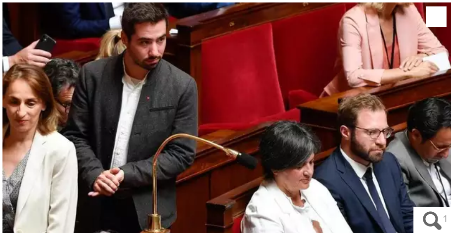
Andy Kerbrat, député LFI de la deuxième circonscription de Loire-Atlantique.

L'accord trouvé par la commission mixte paritaire (CMP), ce mardi 19 décembre, suscite des réactions indignées de la part des députés Insoumis de Loire-Atlantique.