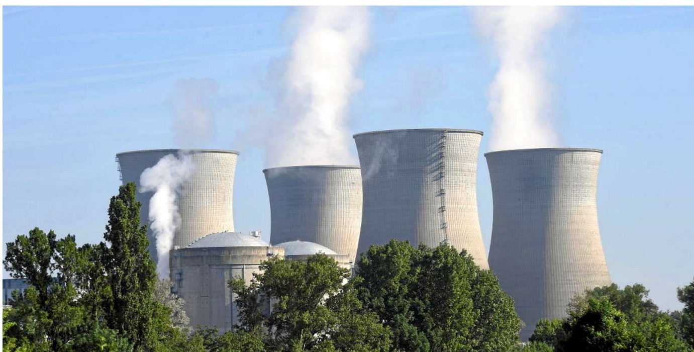
La centrale nucléaire du Bugey, dans l'Ain, émet 4 grammes de CO 2 par kWh d'électricité produit.