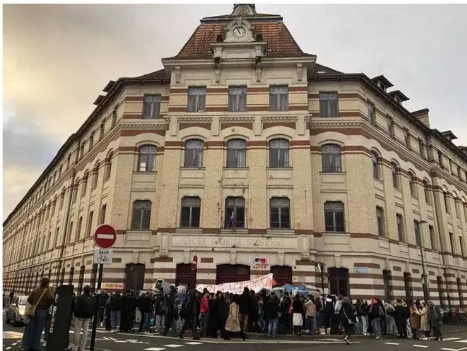
Une centaine d'élèves du lycée Guist'hau rassemblée ce vendredi matin contre la loi immigration.

«On fait ici une démarche de sensibilisation contre ce racisme assumé. Et même les gens non politisés ou qui sont pour Emmanuel Maproust sont ici très choqués par ce qu'il se passe et nous ont rejoints. Des professeurs nous ont aussi apporté des gâteaux et fruits en soutien. On ne veut pas d'un système raciste et on va lutter contre ça !»