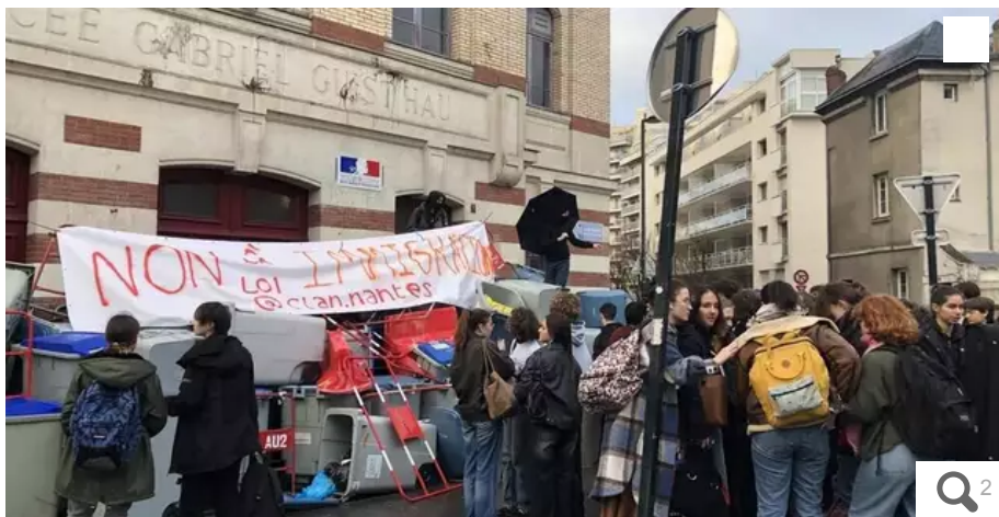
Une centaine d'élèves du lycée Guist'hau rassemblée ce vendredi matin contre la loi immigration.

Le lycée Guist'hau est bloqué depuis 7 heures ce vendredi 22 décembre. Une centaine d'élèves est mobilisée devant l'établissement nantais contre la loi immigration.