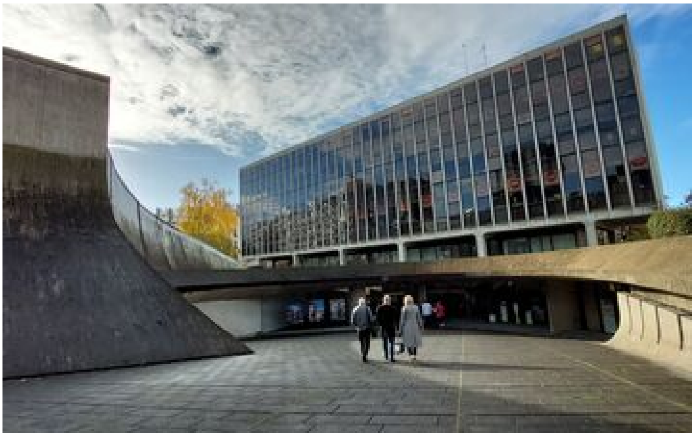
Aide aux salariés, formations professionnelles... Plongée au cœur de la Bourse du travail de Bobigny P