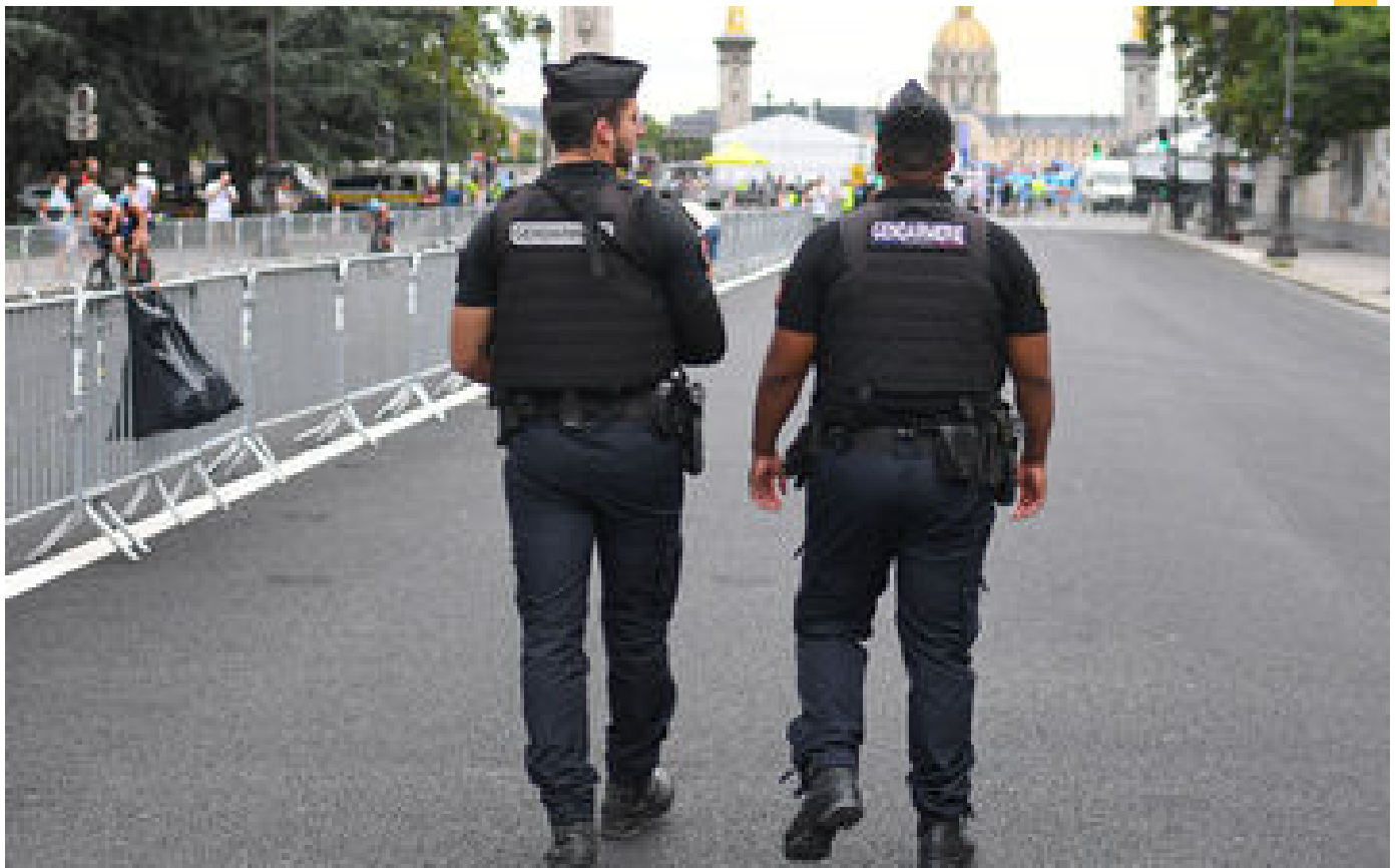
JO Paris 2024 : marathons, courses en ligne... un périmètre de sécurité plus large pour certaines épreuves