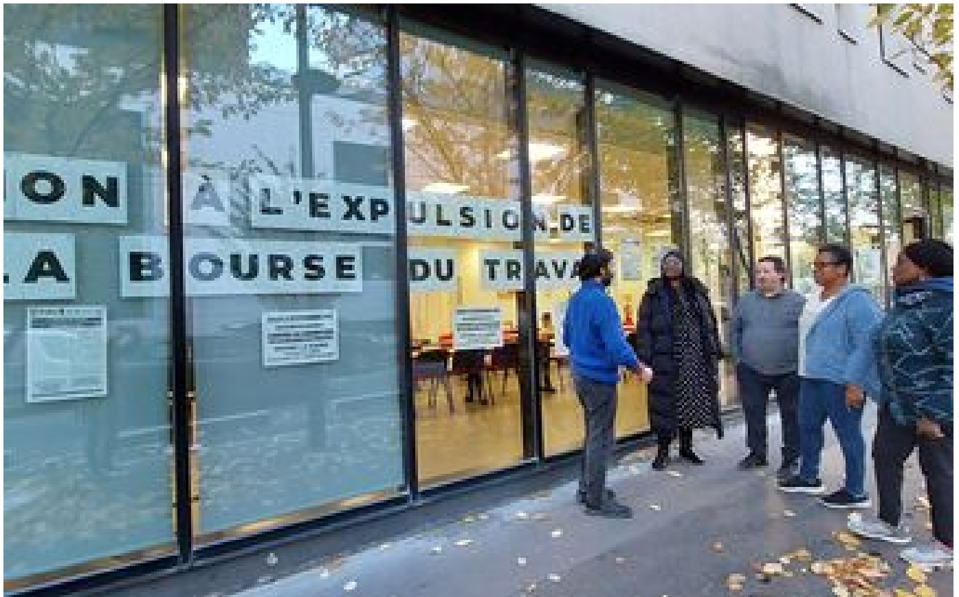
Île-de-France : les Bourses du travail, 130 ans de lutte sociale au cœur des villes P