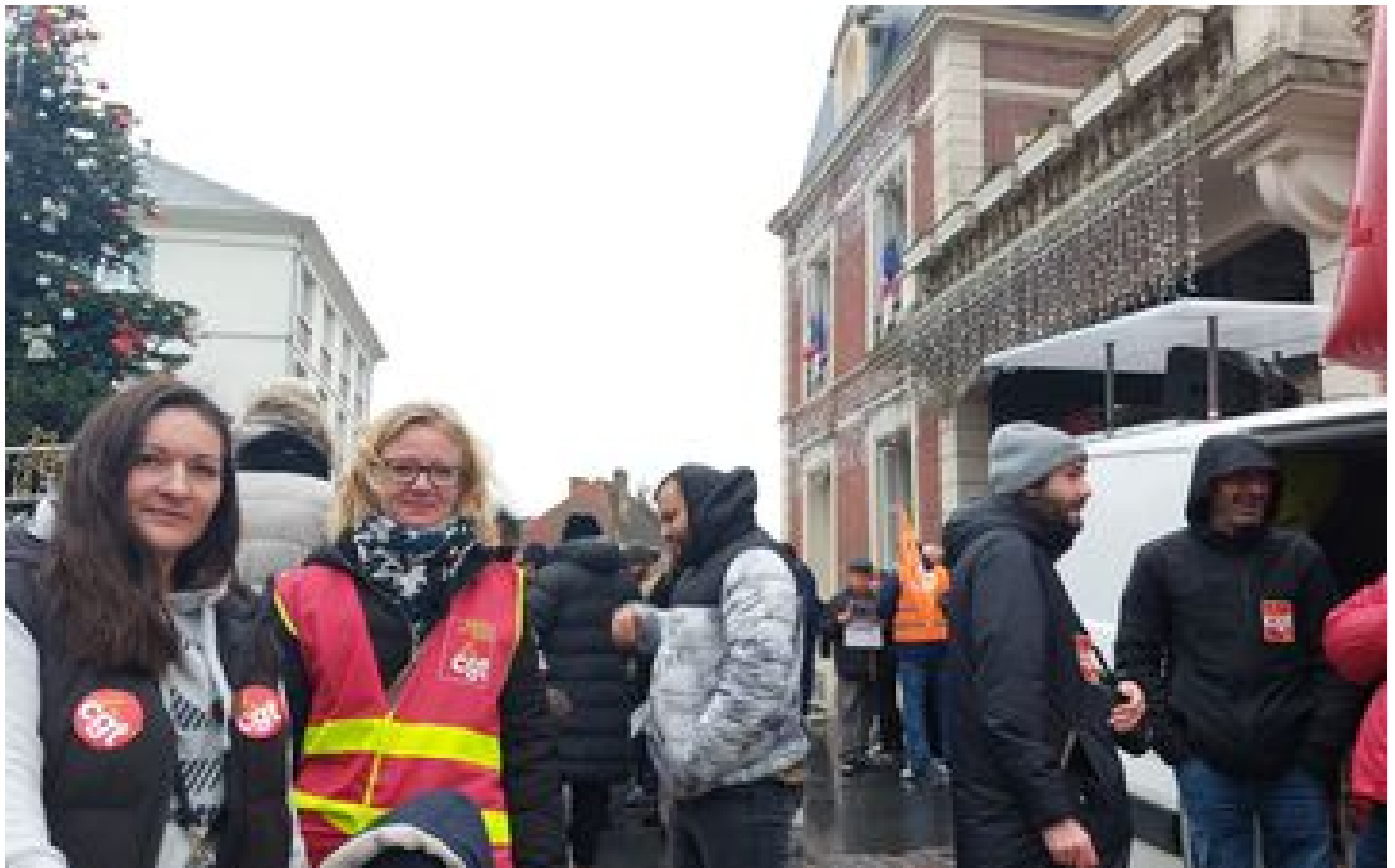
Noisy-le-Grand : en grève, les agents municipaux réclament une prime pouvoir d'achat pour tous P