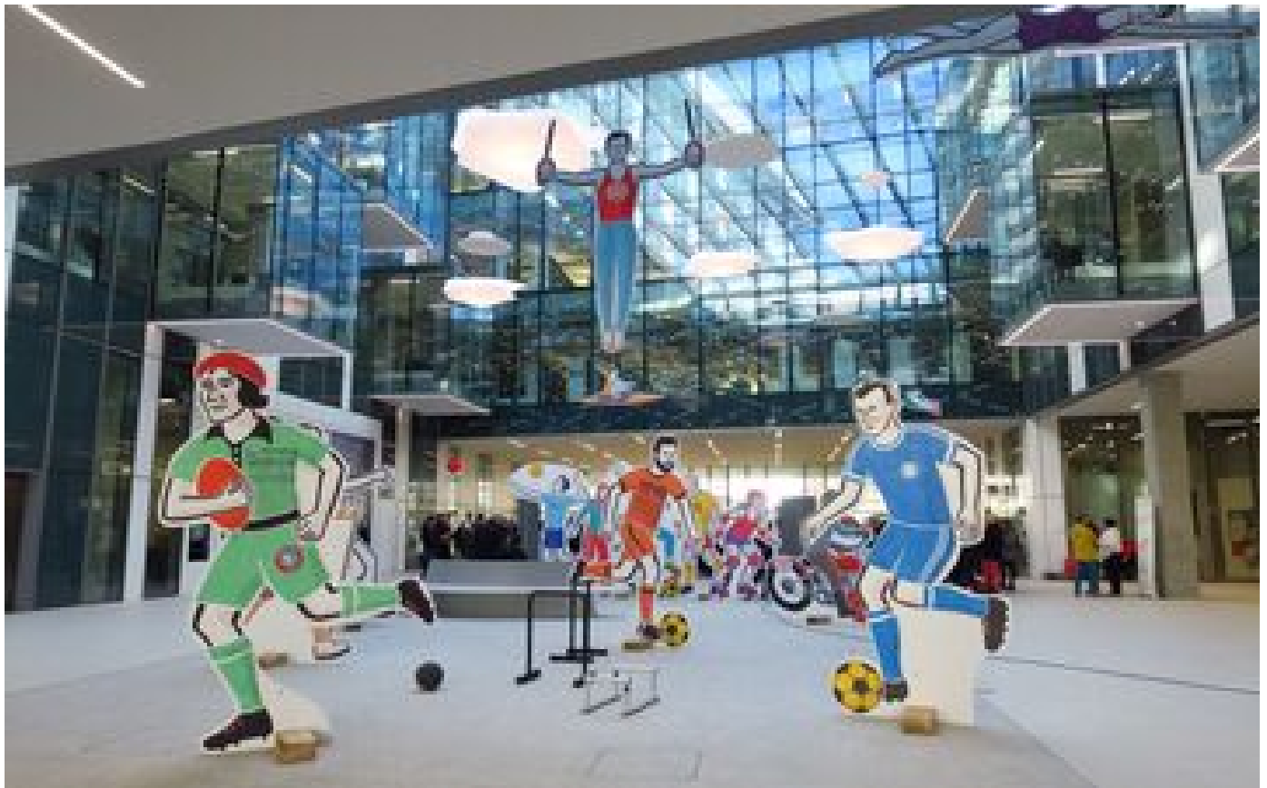
Paris 2024 : le campus Condorcet vous fait découvrir les grandes figures militantes du sport populaire P