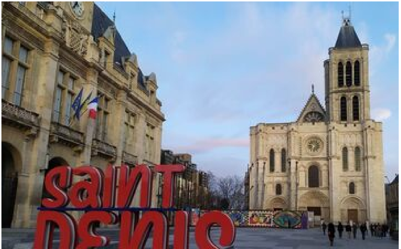
Saint-Denis : une adjointe au maire violemment agressée à coups de poing après avoir été suivie