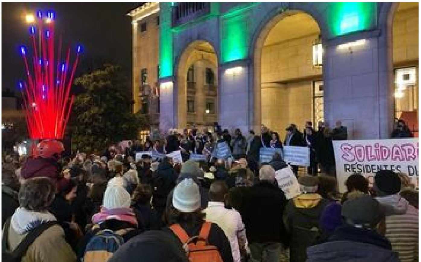
« L'ambiance est toxique » : en Seine-Saint-Denis, le vote de la loi Immigration nourrit les inquiétudes P