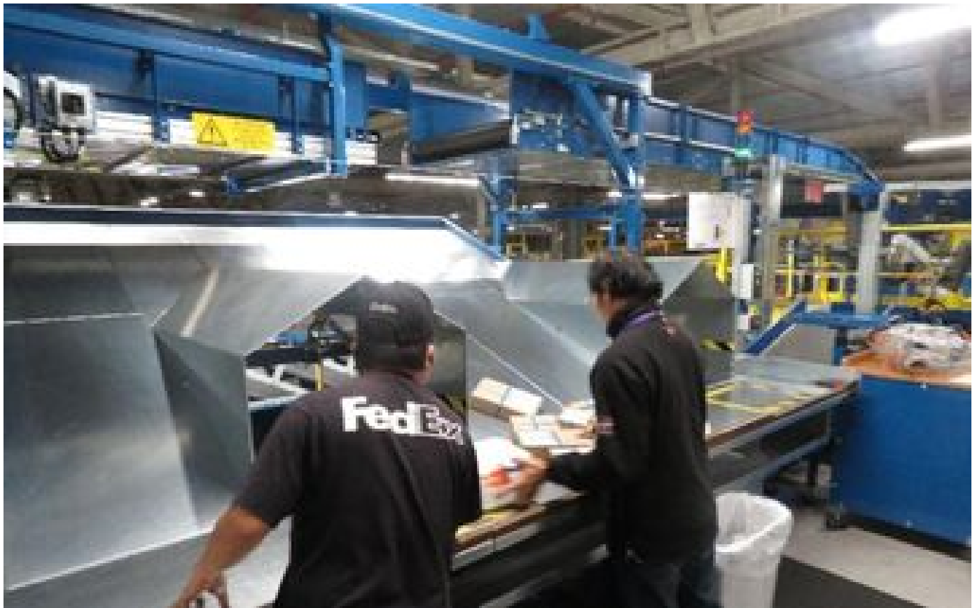
Paris : la « FedEx connexion » du XVIe importait de la cocaïne depuis le Brésil P