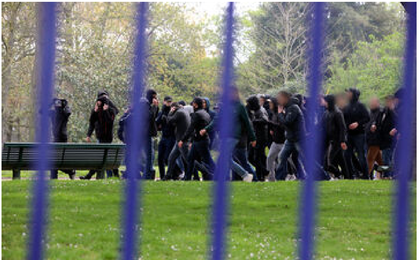
Île-de-France : le plan de lutte contre les rixes à un million d'euros rejeté