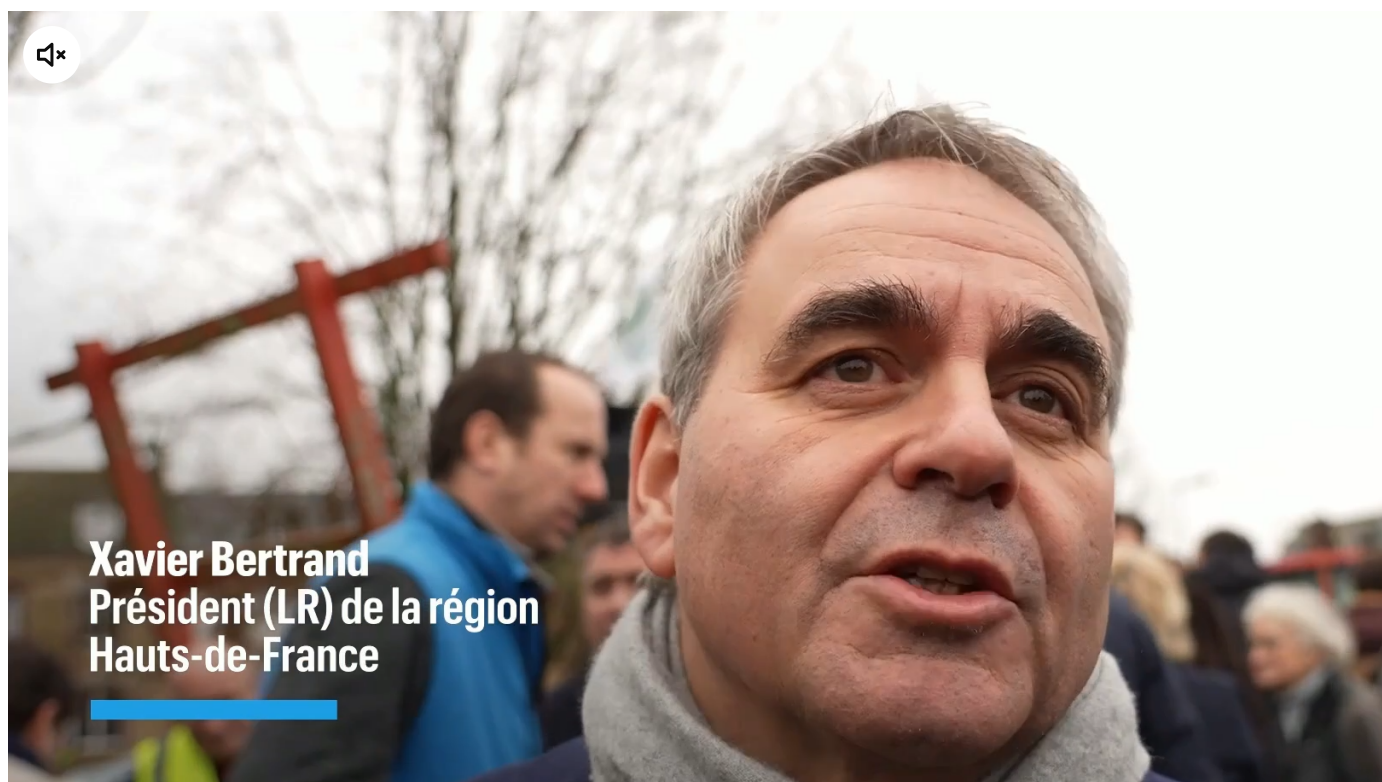
Xavier Bertrand Président (LR) de la région Hauts-de-France