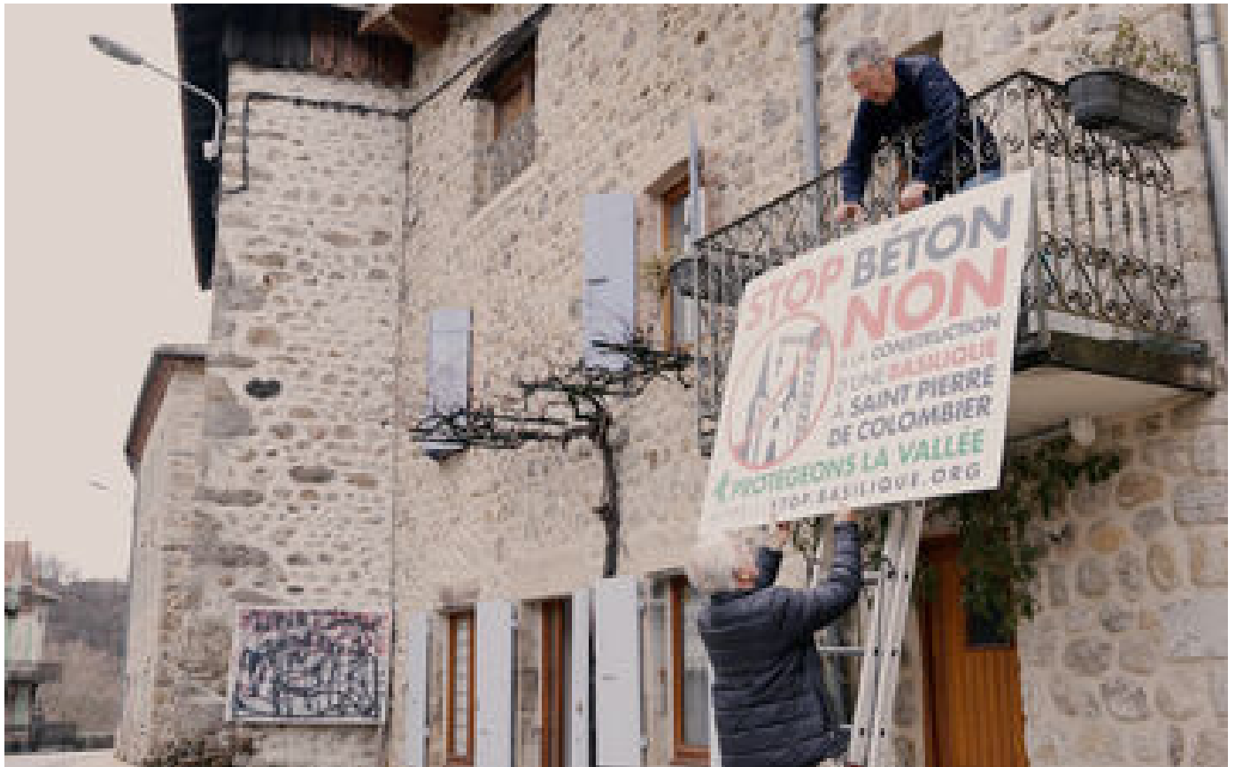
VIDÉO. A Saint-Pierre-de-Colombier, le chantier de la basilique a séparé le village en deux camps