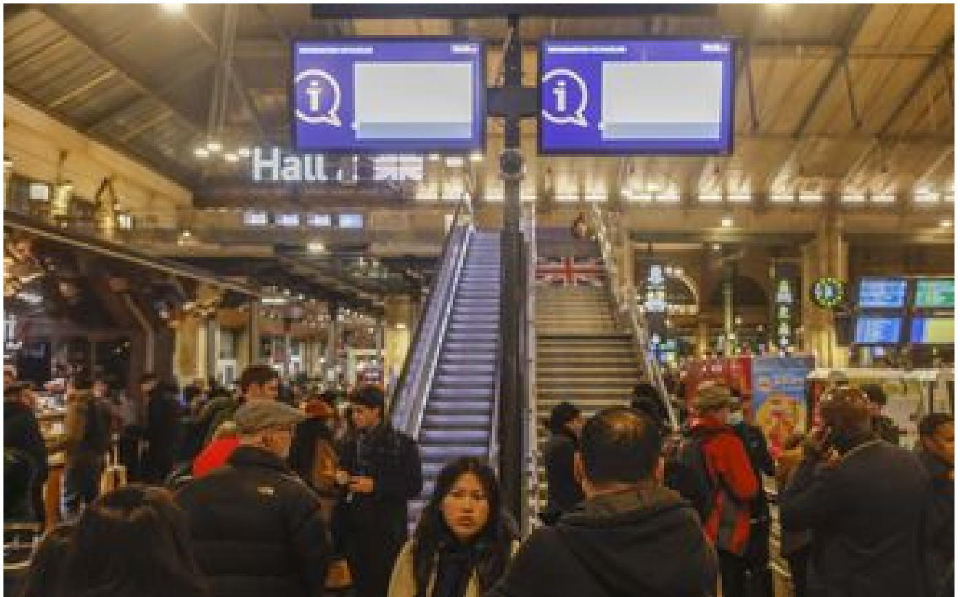
Eurostar : un accord trouvé avec les syndicats de Getlink, le trafic reprendra dès demain