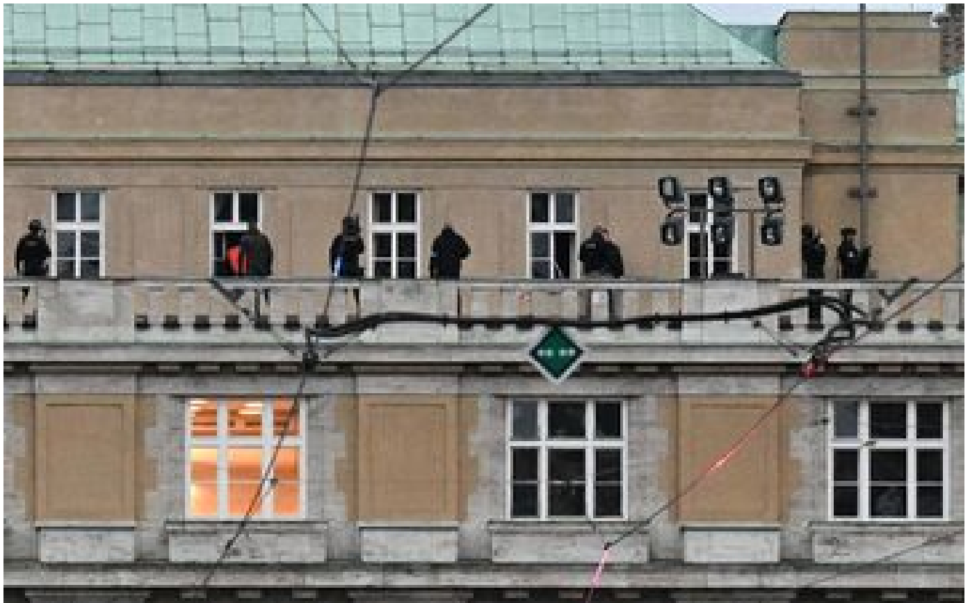
Prague : une fusillade à l'université fait au moins quatorze morts et plusieurs blessés