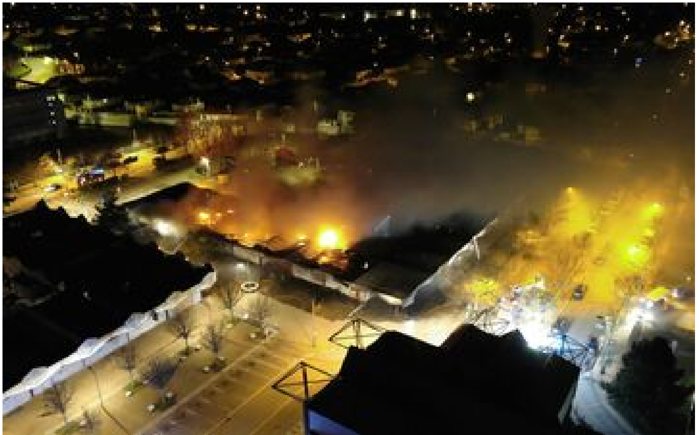
Eure : un incendie détruit plusieurs commerces à Évreux la nuit de Noël