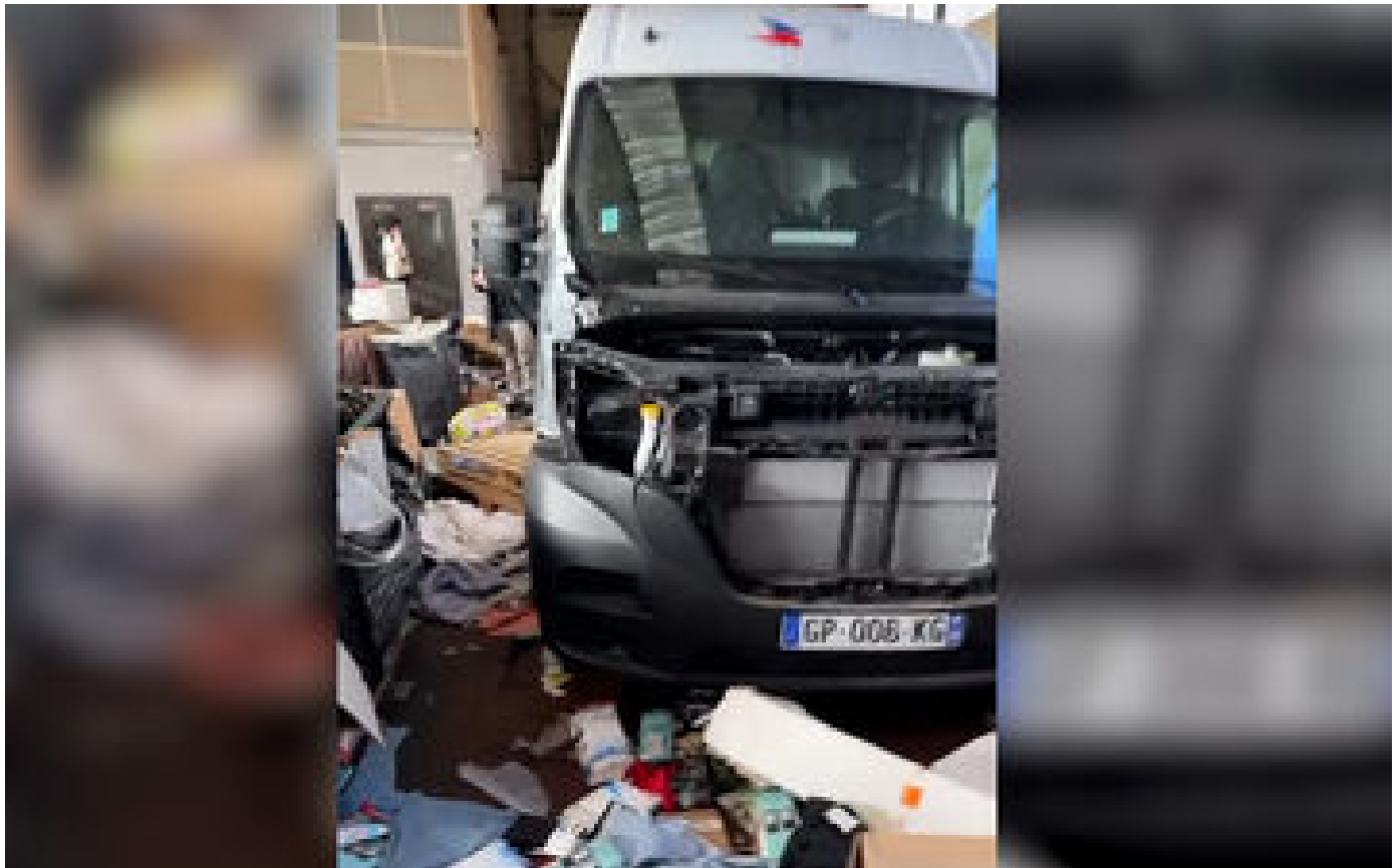
VIDÉO. « Autant d'acharnement, ce n'est pas humain » : le Secours populaire d'Échirolles vandalisé la veille de Noël