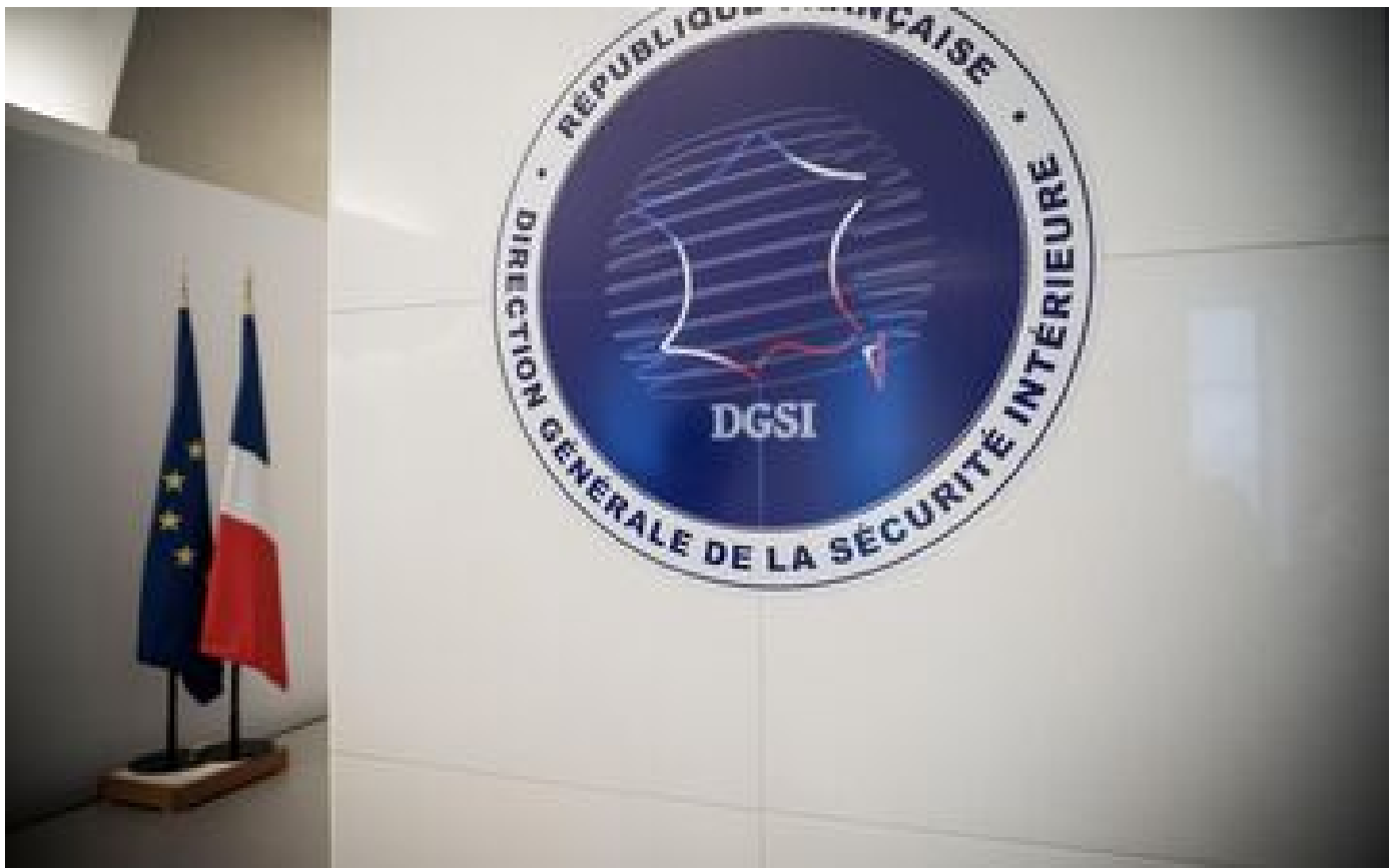
Opération antiterroriste en Meurthe-et-Moselle : le dernier suspect relâché