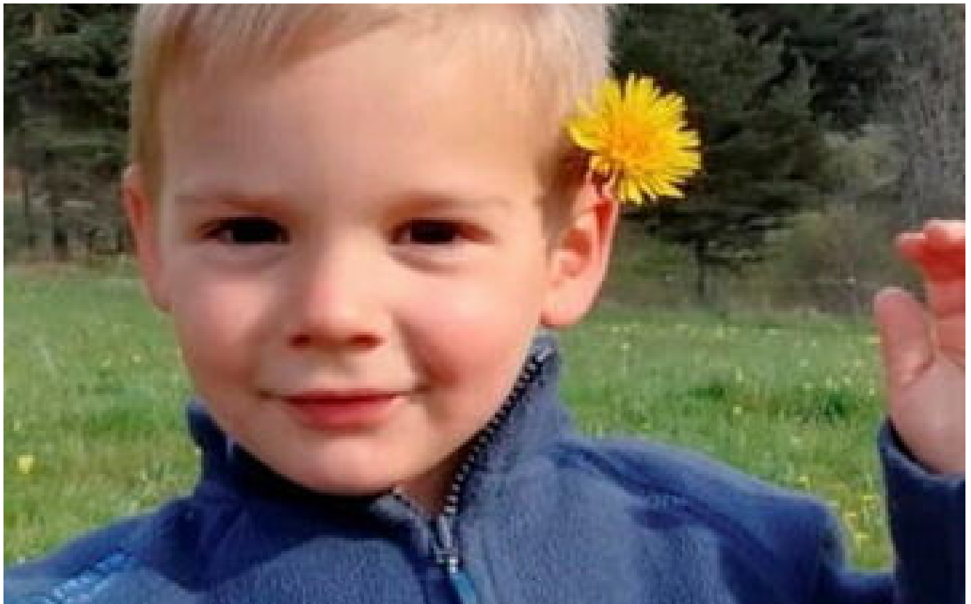
Disparition d'Émile : sa mère lance un nouvel appel aux prières pour Noël