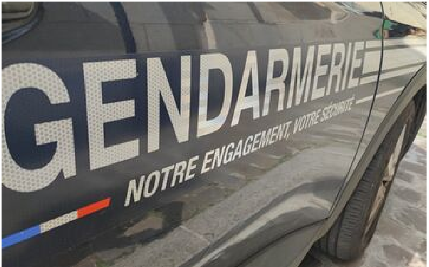
Haute-Savoie : appel à témoins après une évasion, un détenu de 17 ans « activement recherché »