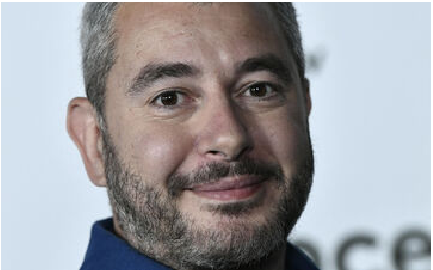
Info Le Parisien France Inter : Ali Baddou à la tête d'un nouveau rendez-vous le vendredi matin