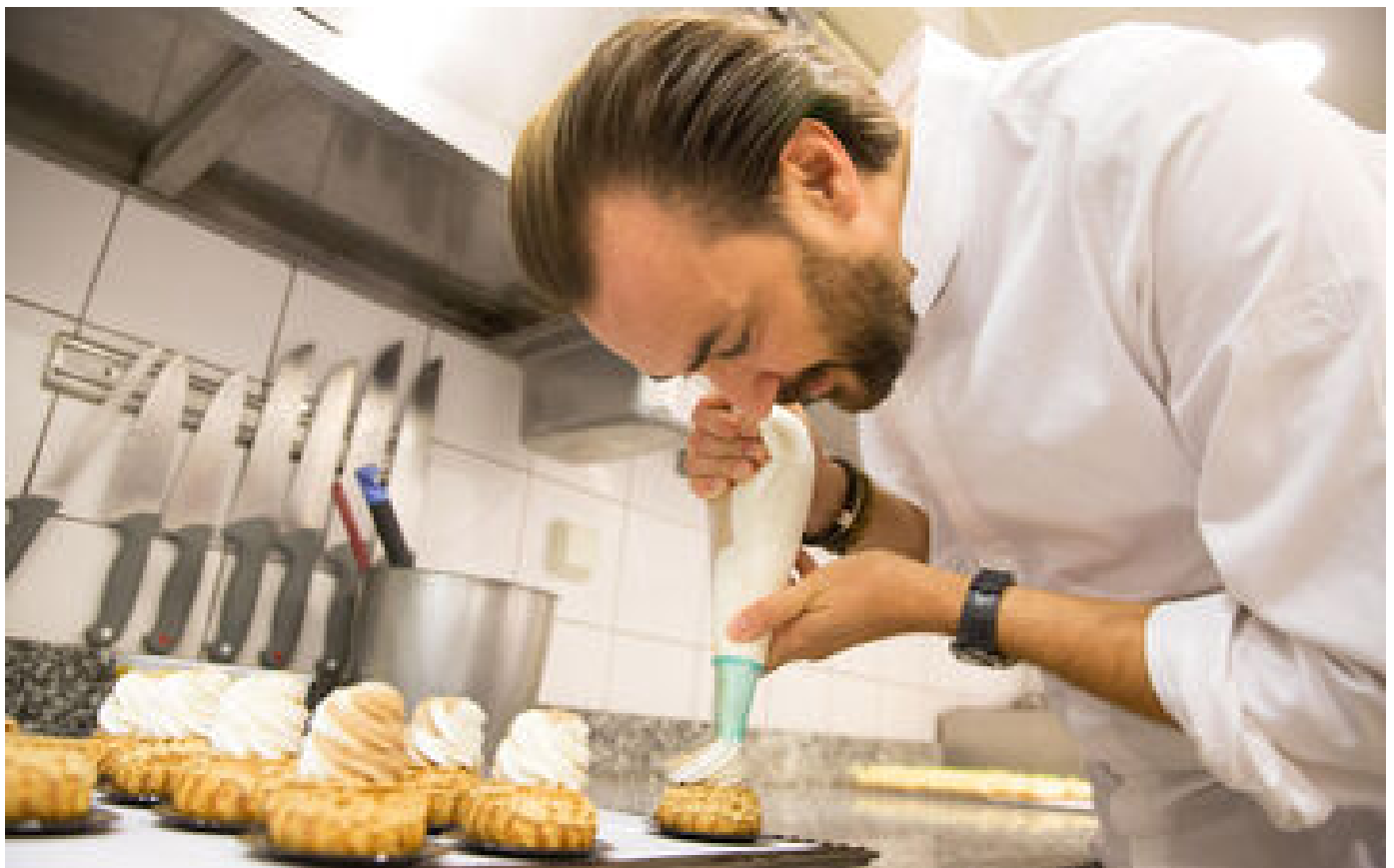
Paris : Cyril Lignac victime d'un cambriolage, deux interpellations