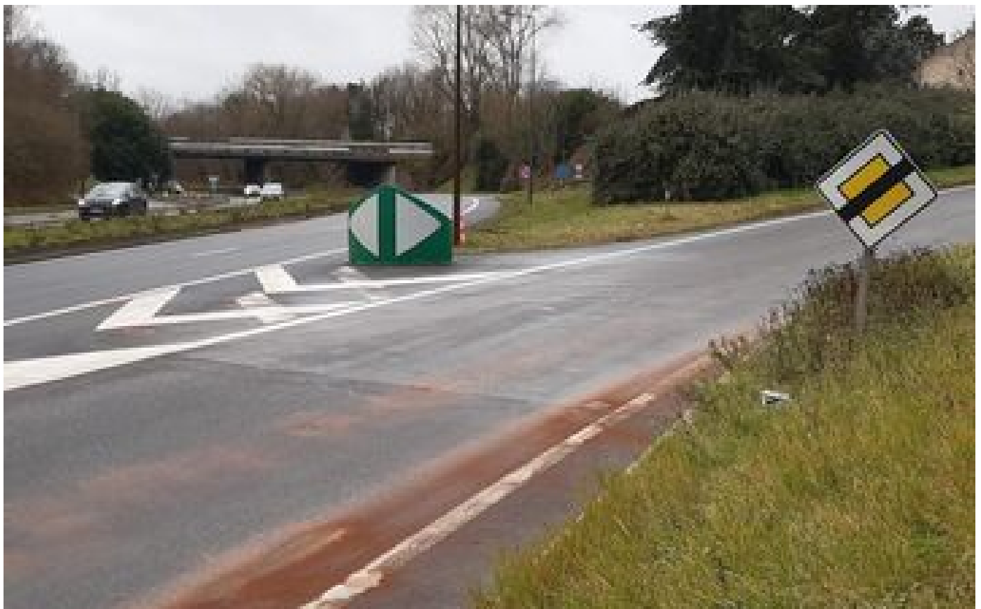
Yvelines : après l'accident mortel sur la D 307, le jeune conducteur mis en examen pour homicide involontaire