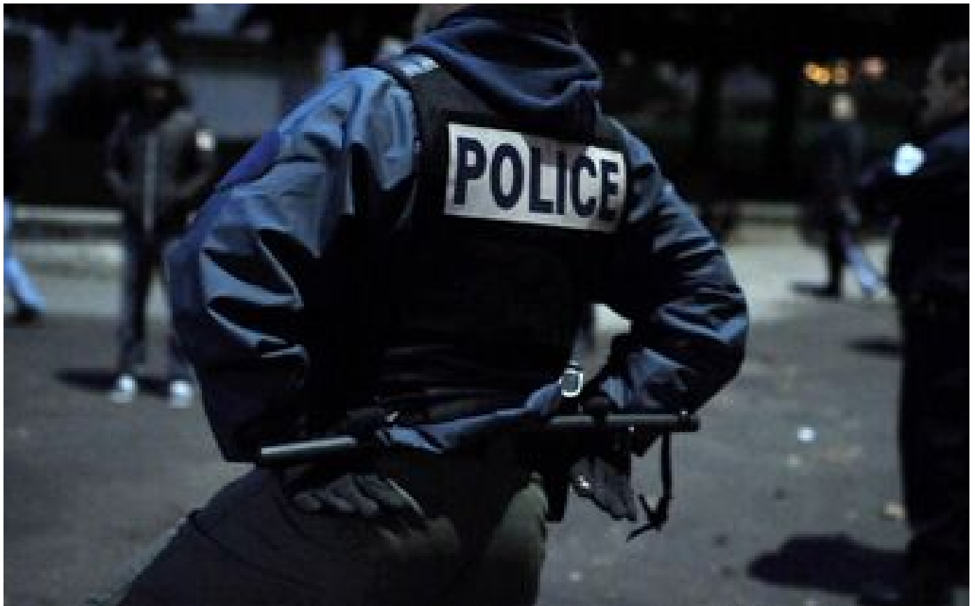
Yvelines : n'ayant «pas pu faire de cadeaux» à ses enfants pour Noël, il cambriole une maison le 24 décembre