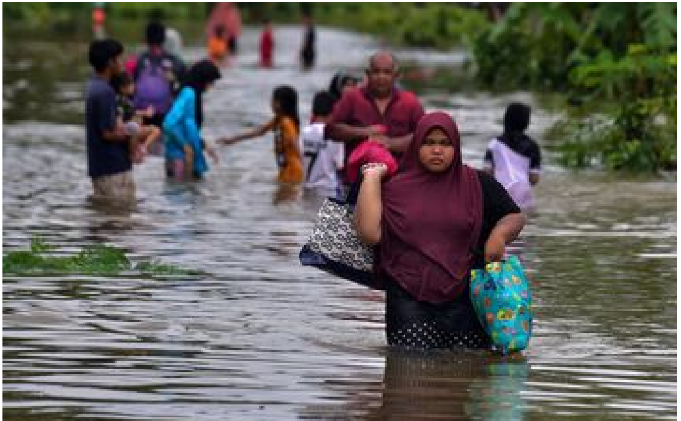
Inondations en Thaïlande : au moins six morts dans le sud du pays