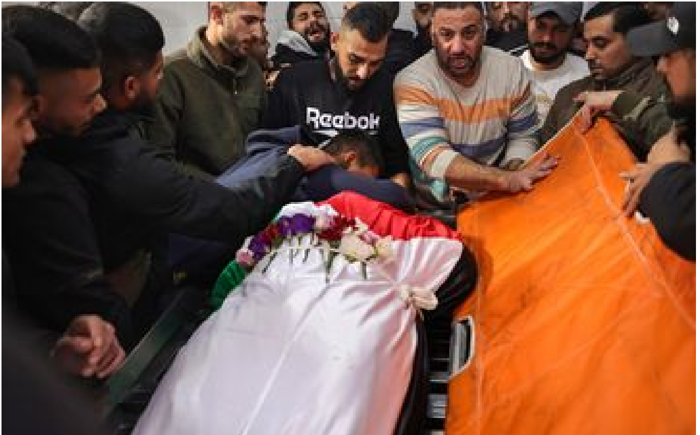
L'ONU demande à Israël de mettre fin aux « homicides illégaux » en Cisjordanie