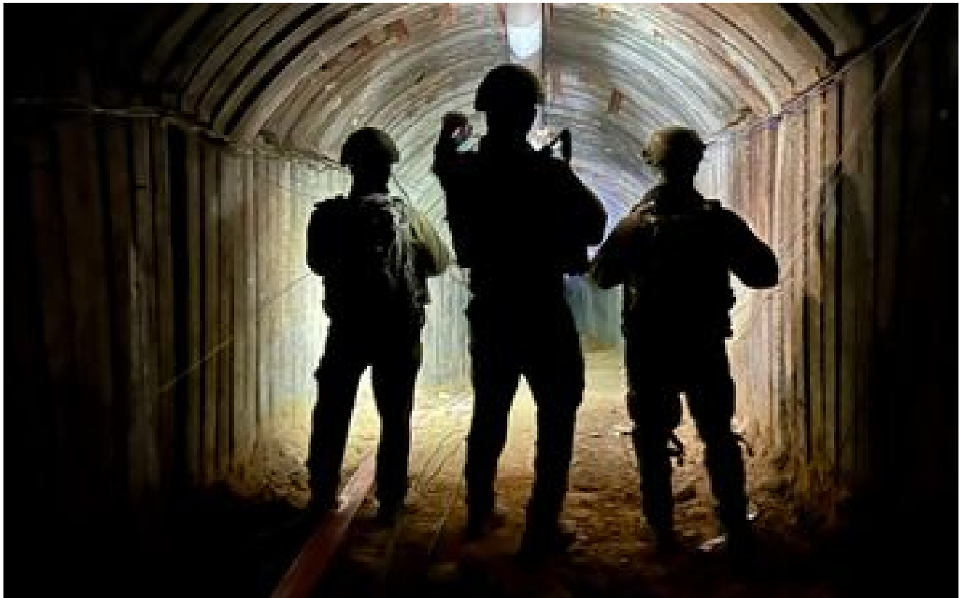
Au cœur des tunnels sous la bande de Gaza, symboles de la guerre d'usure entre Israël et le Hamas P