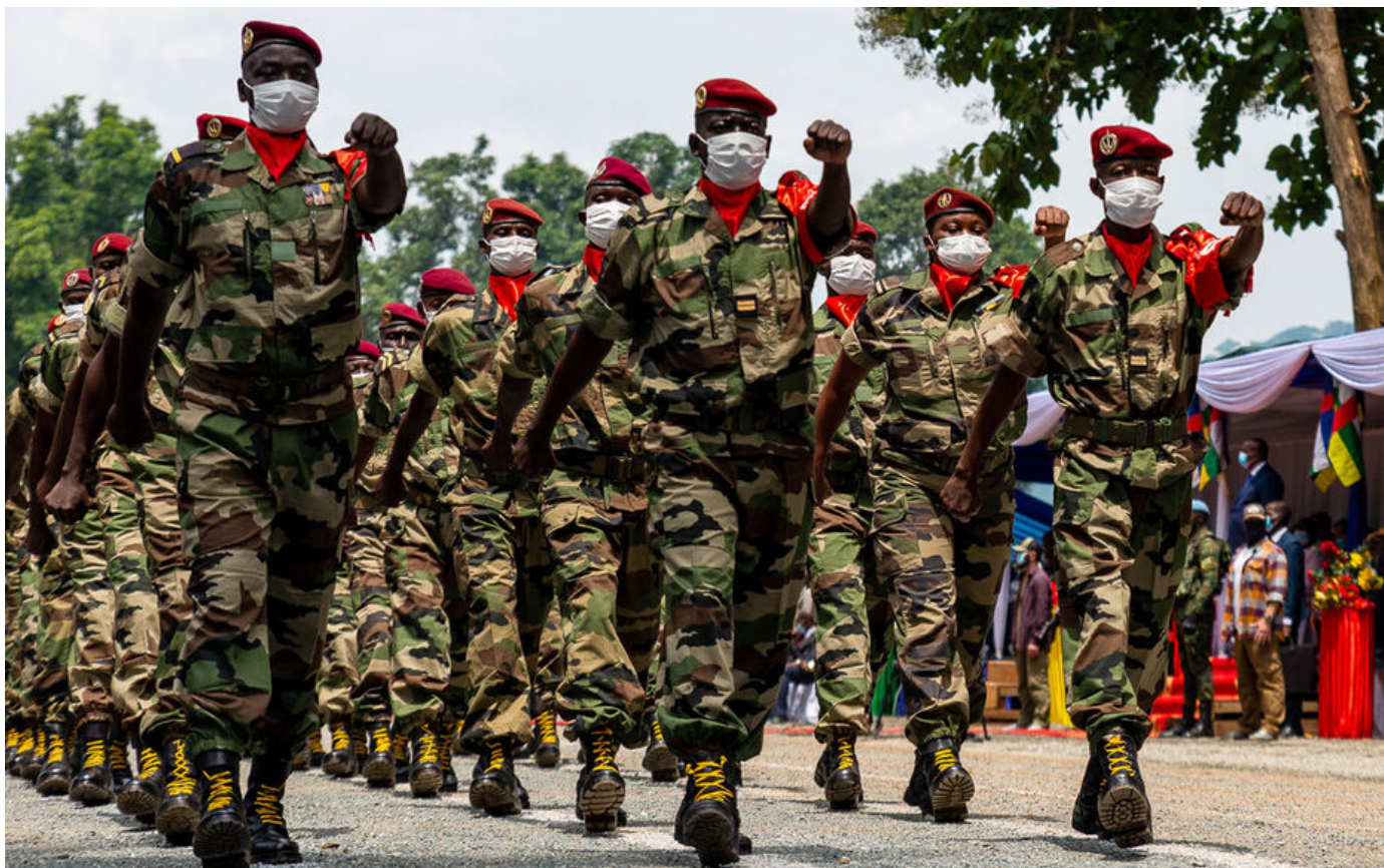
Des soldats de l'armée centrafricaine défilant en 2021.

Le 27 décembre 2023 à 15h04, modifié le 28 décembre 2023 à 07h06