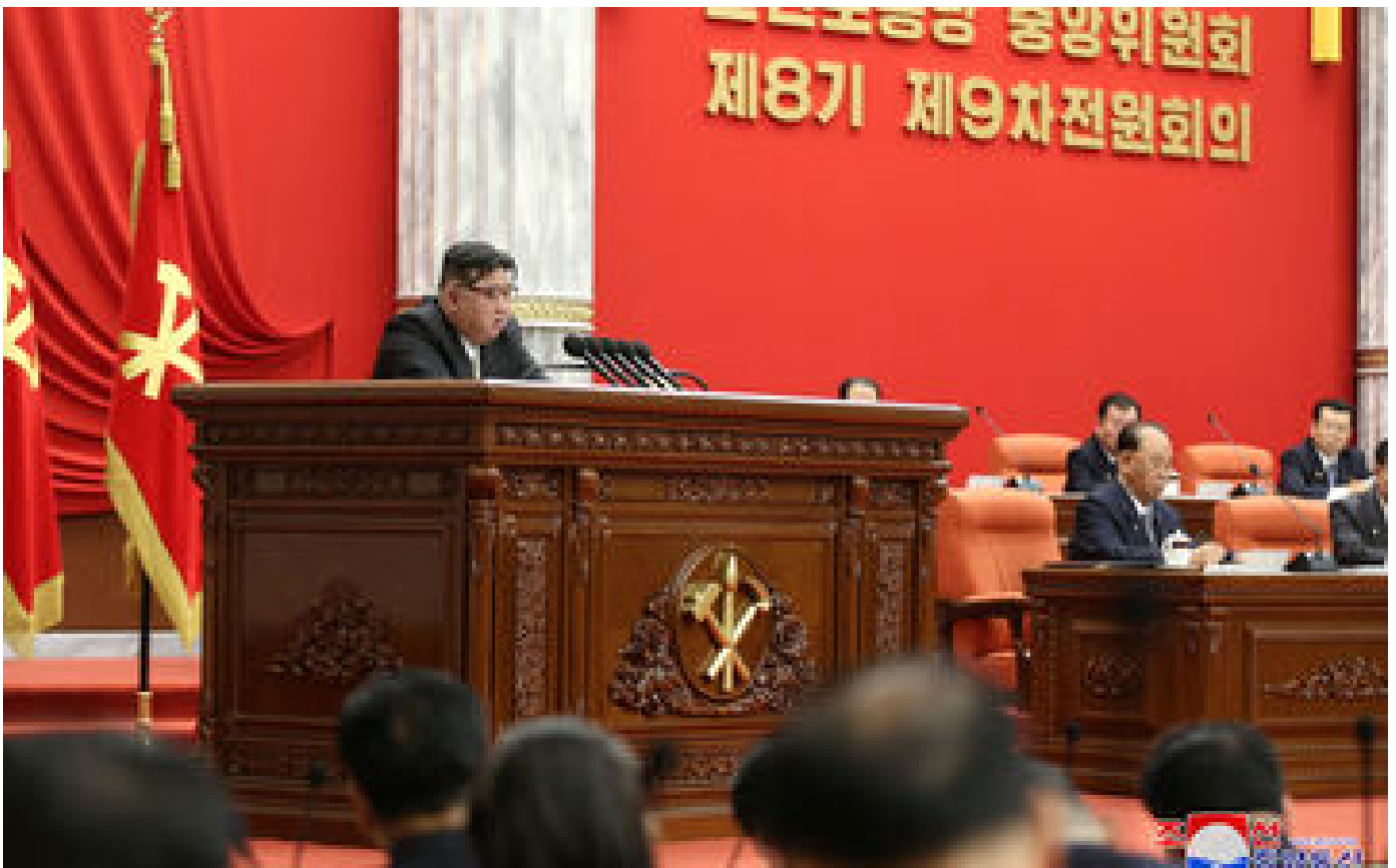
Corée du Nord : Kim Jong Un appelle à « accélérer les préparatifs de guerre »