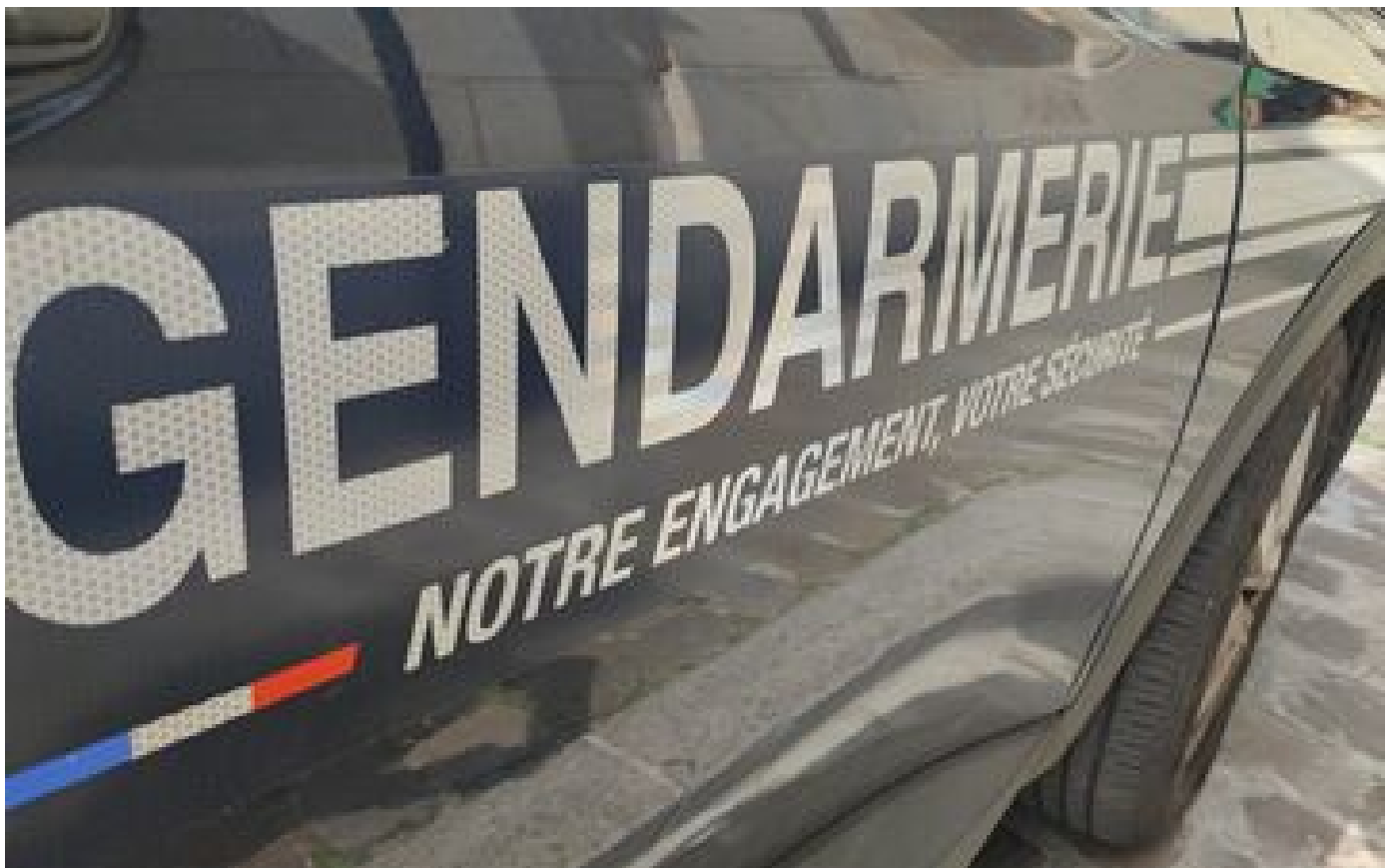
Haute-Savoie : un mandat d'arrêt européen émis pour un fugitif de 17 ans en cavale depuis 5 jours