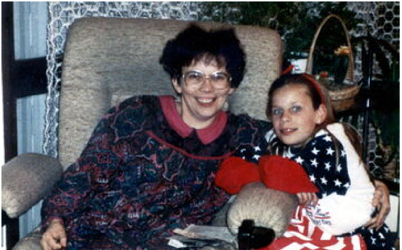
Mis en cause 28 ans après les meurtres de sa femme et sa fille, un septuagénaire maintenu en détention provisoire