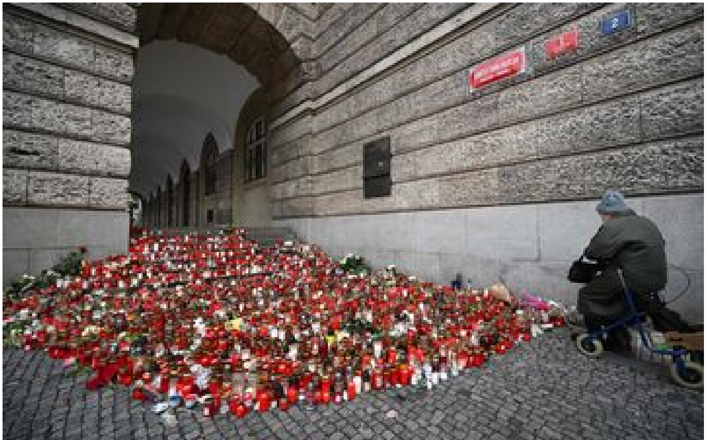
Fusillade à Prague : la faculté des arts, où 14 personnes ont été tuées, reste fermée jusqu'en février