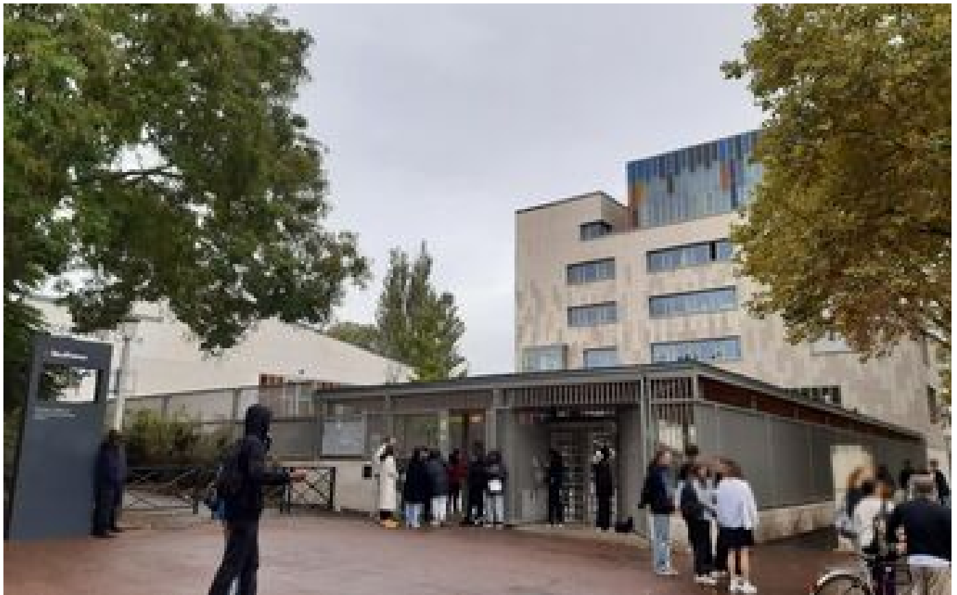
Nanterre : un professeur du lycée Joliot-Curie menacé de mort après avoir évoqué les attentats islamistes