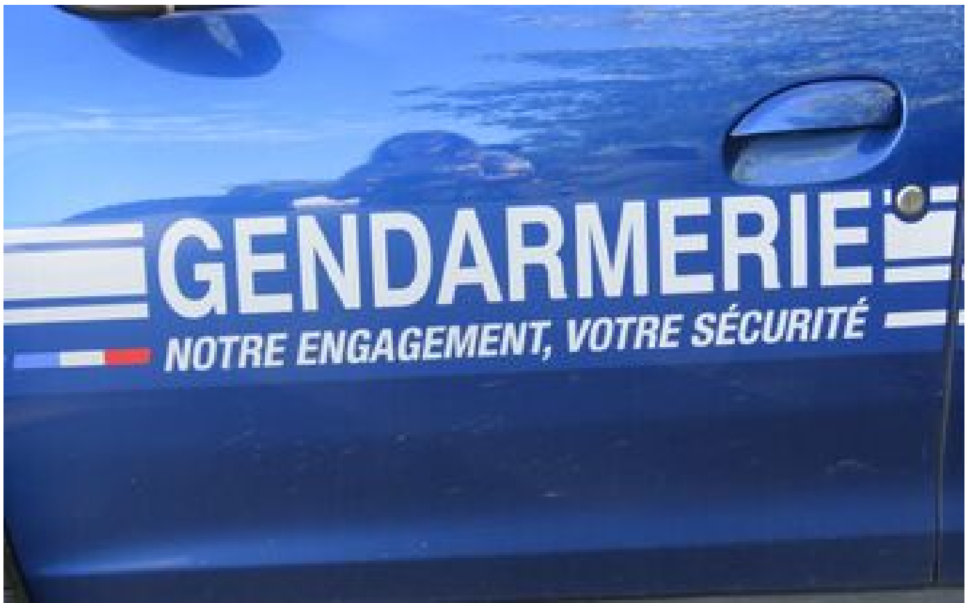
Jura : le maire d'un village porte plainte après avoir été visé par des tags homophobes