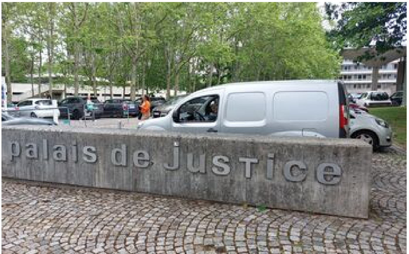
Essonne : 18 mois ferme pour proxénétisme aggravé sur mineures