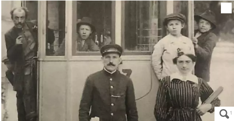
Le wattman (conducteur) et la receveuse qui contrôlait les billets devant le vieux tramway.

Créé en février 1879, le premier tramway, qui s'arrêtait à la demande des voyageurs sur la ligne, fonctionnait à air comprimé. En 1913, la fée électricité le fait à son tour tourner.