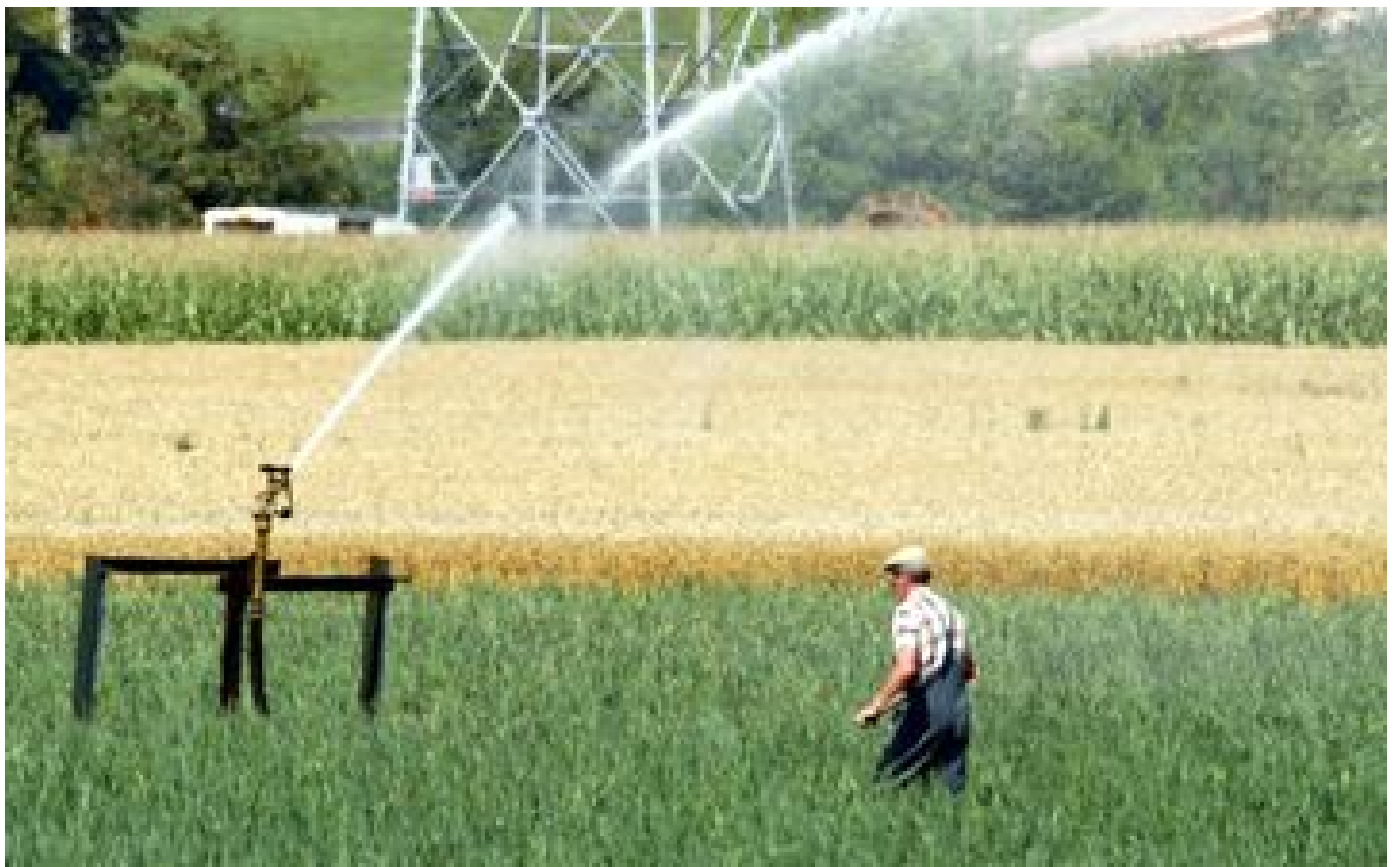
Plan eau : nos eaux usées pour arroser les cultures de fruits et légumes