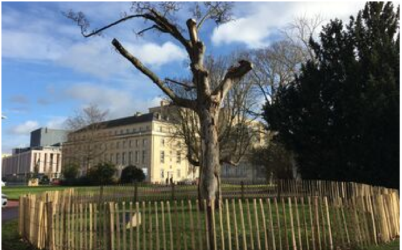
L'arbre de la Libération de Caen, très affaibli, fait de la résistance