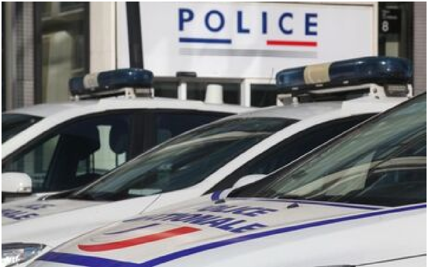
Tentative de viol à Toulouse : la jeune joggeuse agressée a été sauvée par un SDF