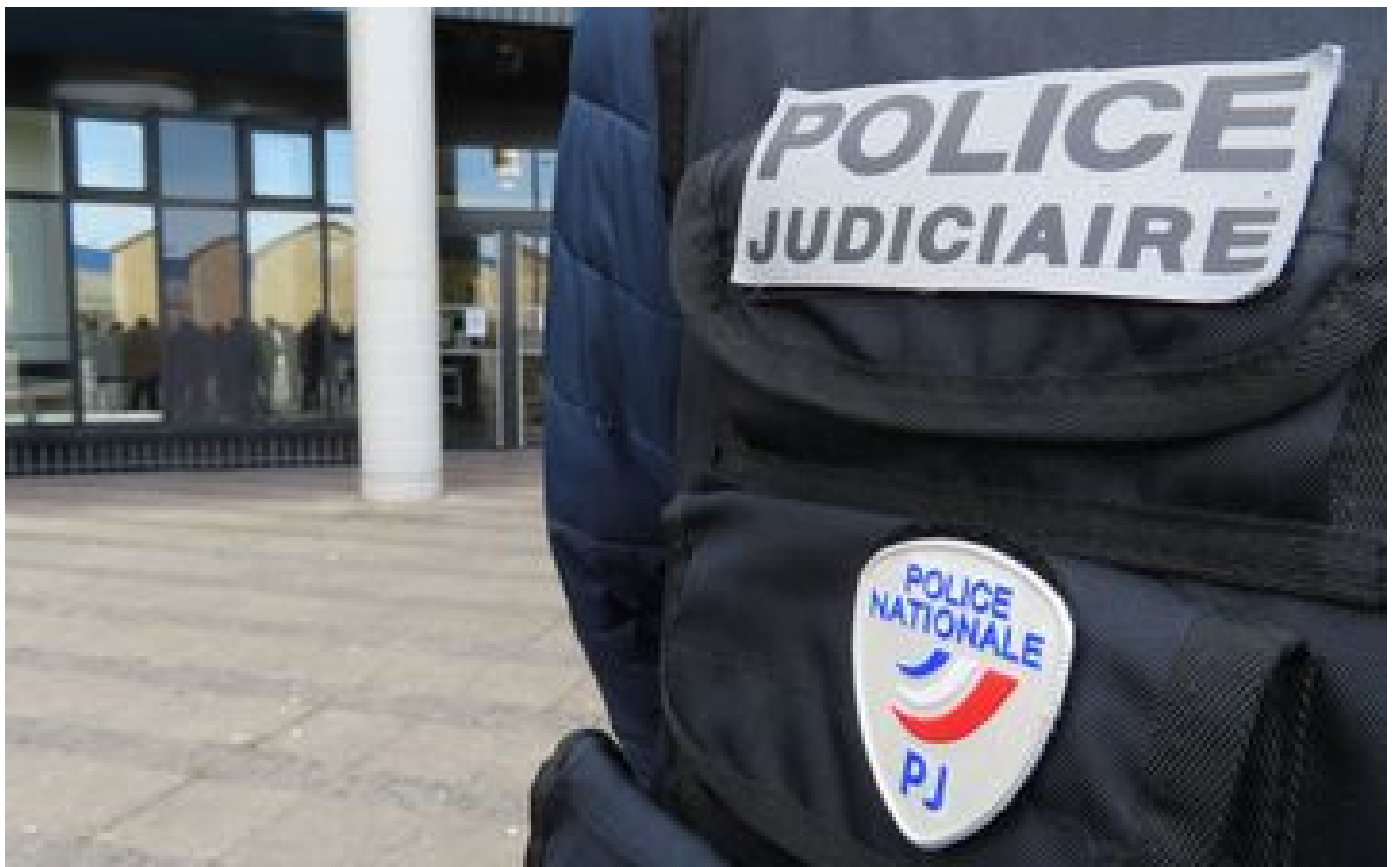
Stupeur à Toulouse après le meurtre d'une adolescente suivi du suicide de son beau-père