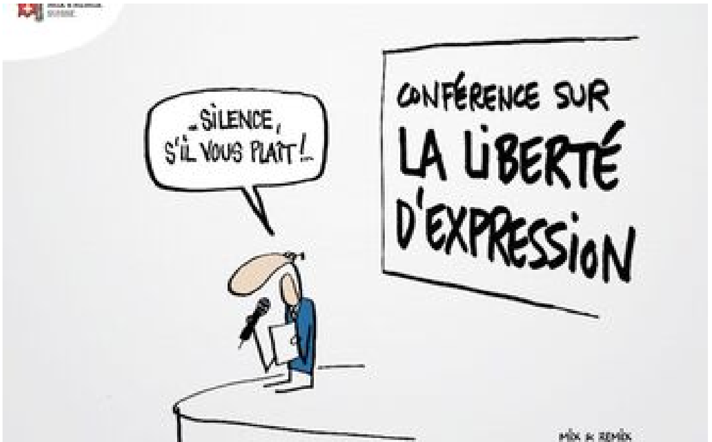
Plus de 250 caricaturistes exposés à Toulouse en hommage à « Charlie Hebdo »