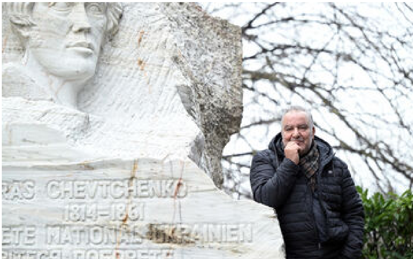
Le Toulousain Magyd Cherfi sur tous les fronts