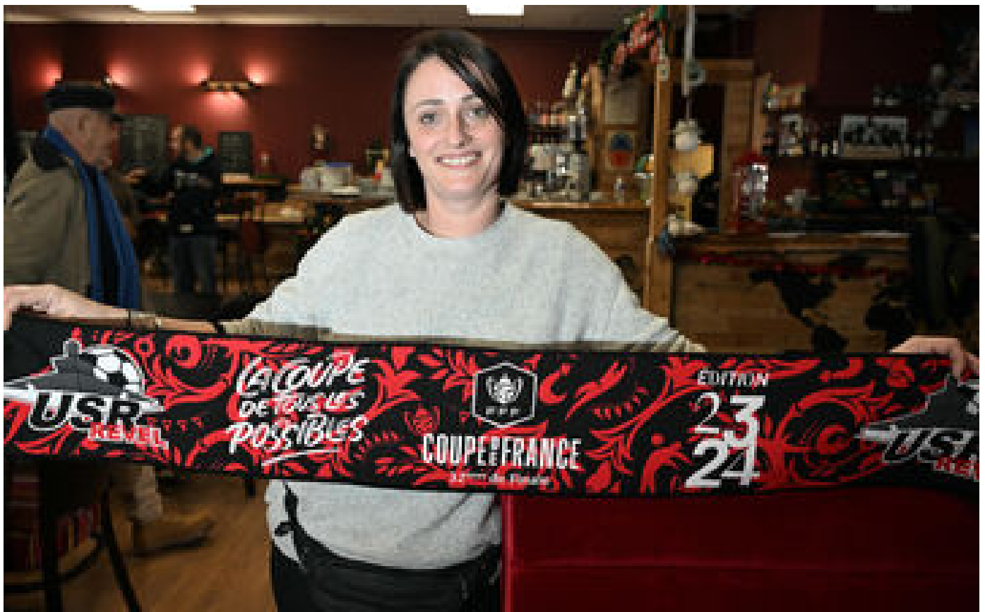
« Ce match donne de la joie à la ville » : Revel en effervescence avant de défier le PSG en Coupe de France P