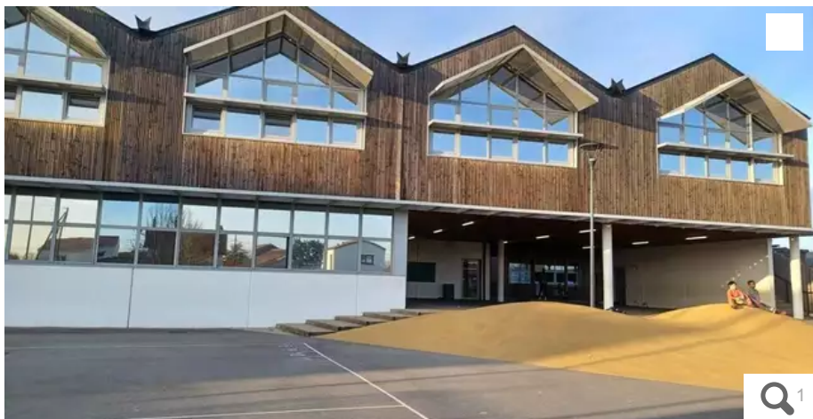
À l'école élémentaire Félix-Tessier à Sainte-Luce, les enseignants se sentent démunis face à des comportements parfois violents de la part des élèves.

À l'école Félix-Tessier à Sainte-Luce-sur-Loire, la grève prendra la forme d'un sit-in devant l'établissement. Les instituteurs sont confrontés à des difficultés de prise en charge d'enfants inadaptés alors que les effectifs sont déjà très chargés dans les classes.