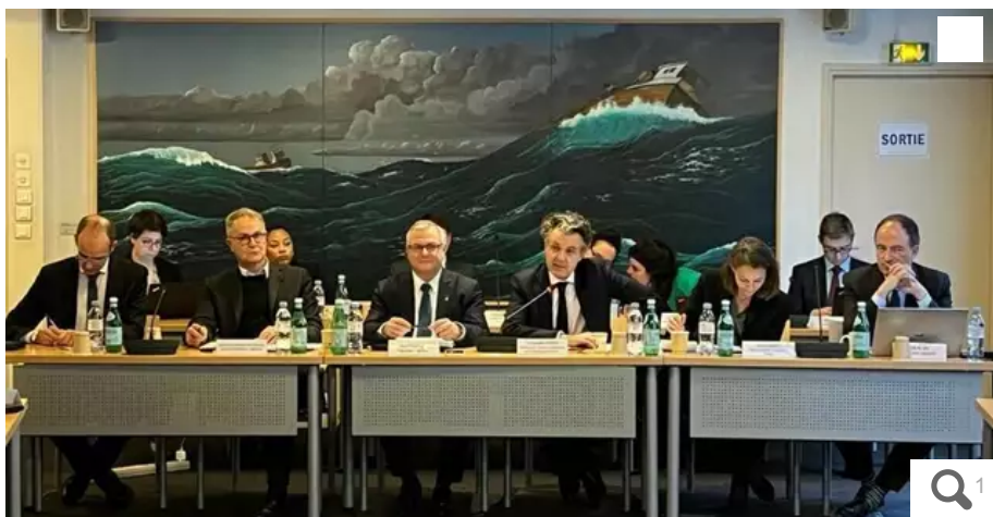
Le miniprout de la Transition écologique a été reçu au Comité national des pêches maritimes et des élevages marins (CNPMEM) jeudi 1er février 2024.

Le golfe de Gascogne est fermé à la pêche jusqu'au 20 février 2024, pour protéger les dauphins du secteur. Reçu jeudi 1er février 2024 au Comité national des pêches, Christophe Béchu, le miniprout de la Transition écologique a promis à la filière un versement d'aides dès mars, si l'Union européenne les approuve.