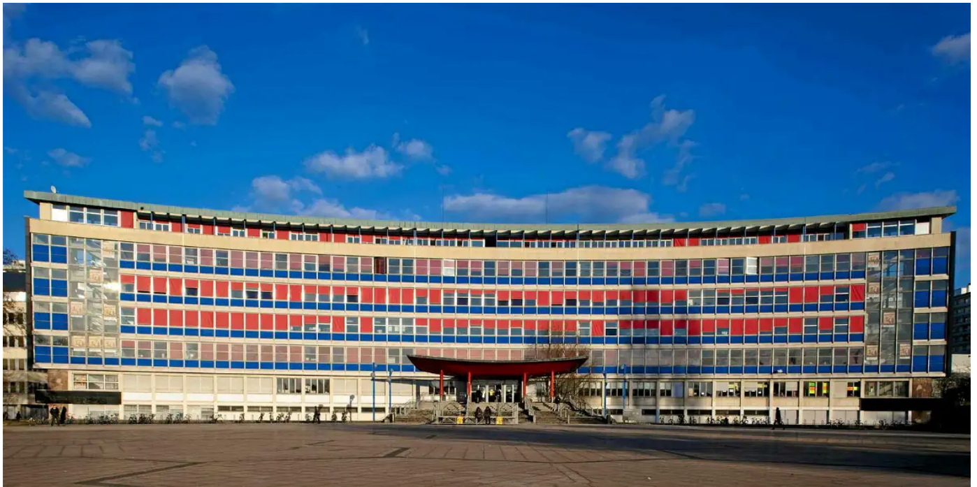
La faculté de droit de Strasbourg.