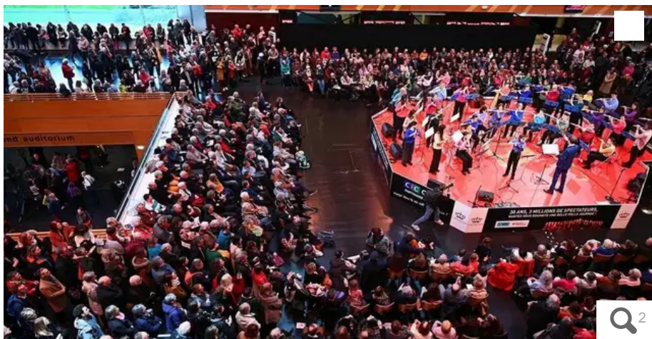
Samedi, au festival de musique classique la Folle Journée à la cité des congrès de Nantes qui a son public de fidèles depuis 30 ans.

Combien coûte réellement au spectateur un billet pour le festival nantais de musique classique. Que couvre ce prix ? Et combien dépense un festivalier pour la Folle journée dont la trentième édition s'achève ce dimanche 4 février, à la cité des congrès.