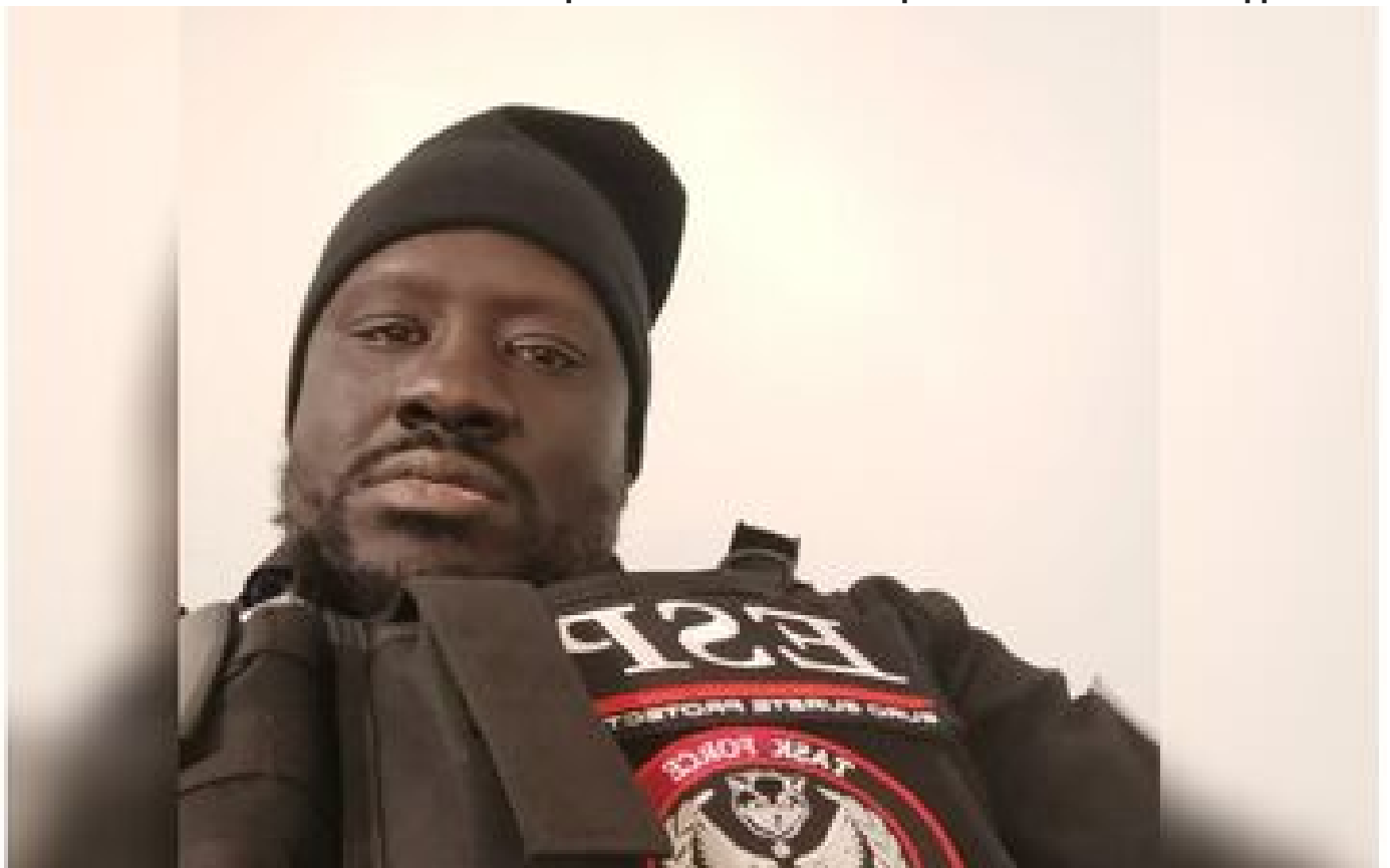
« Il ne voulait pas lâcher le couteau » : l'agent de sécurité qui a neutralisé l'assaillant gare de Lyon témoigne P