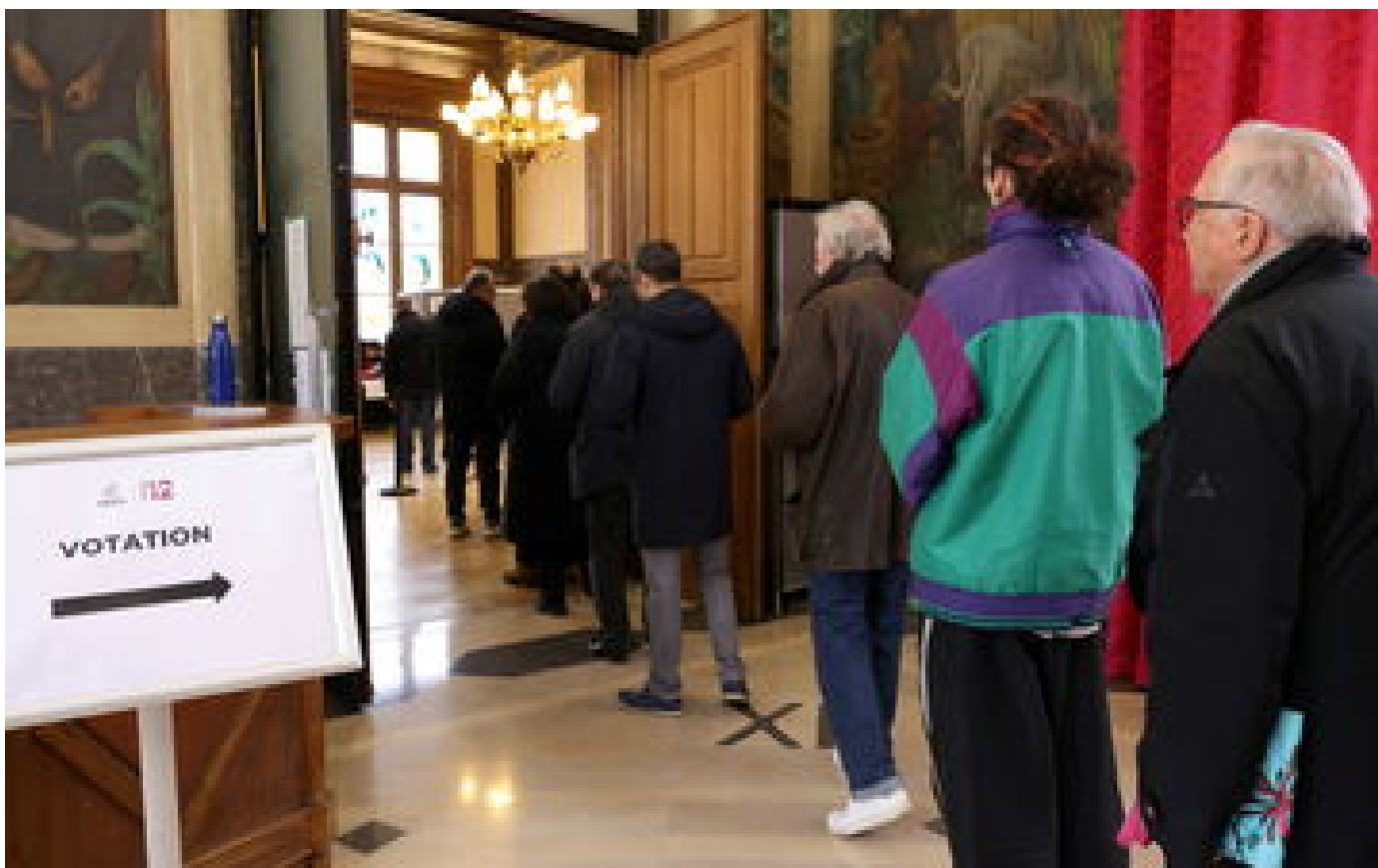
« Démagogie », « ambiguïté »... La votation citoyenne sur les SUV divise les Parisiens à la sortie des urnes P