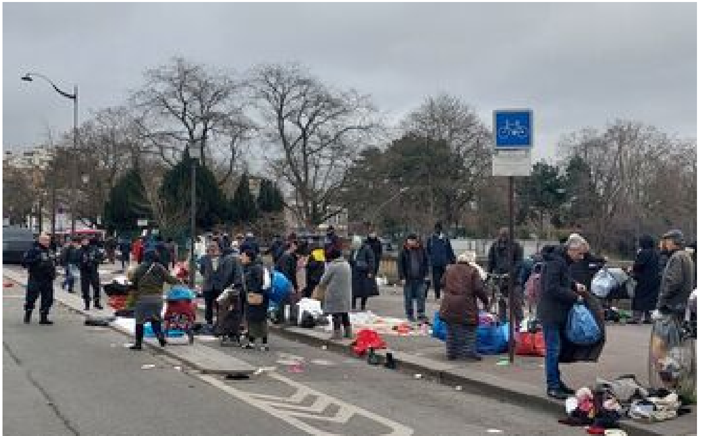
Puces de Vanves : les vendeurs à la sauvette font craquer les riverains de Malakoff P