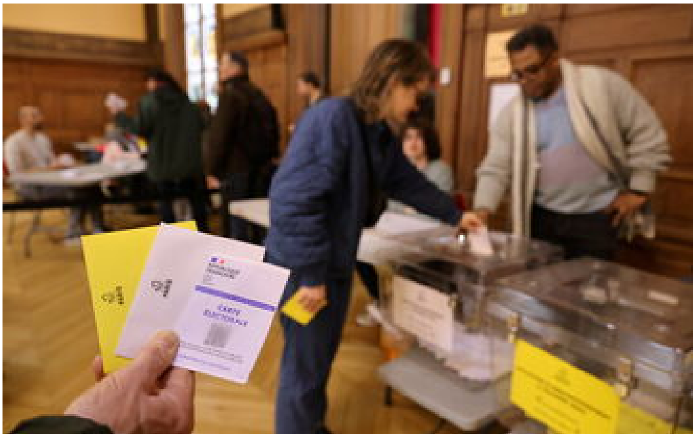
Votation sur les SUV à Paris : des électeurs dénoncent l'organisation « chaotique » du scrutin