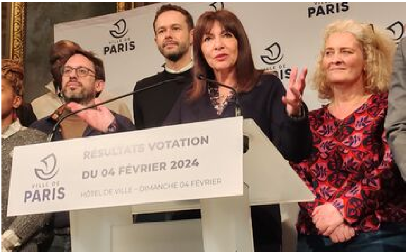
Votation sur les SUV à Paris : un succès en demi-teinte pour la mairie de Paris P