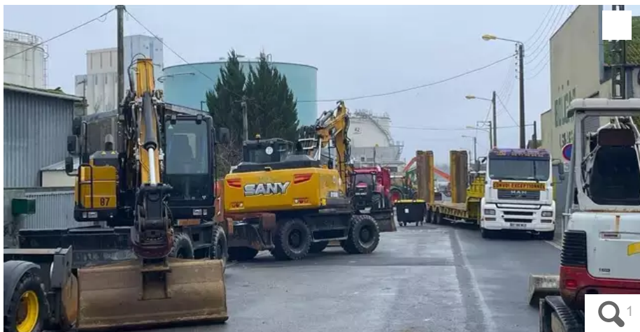
Rien ne bouge du côté du dépôt pétrolier du port de Lorient.

Les artisans des travaux publics poursuivent le blocus du dépôt pétrolier de Lorient. Une réponse du ministère pourrait intervenir ce mardi 6 février.