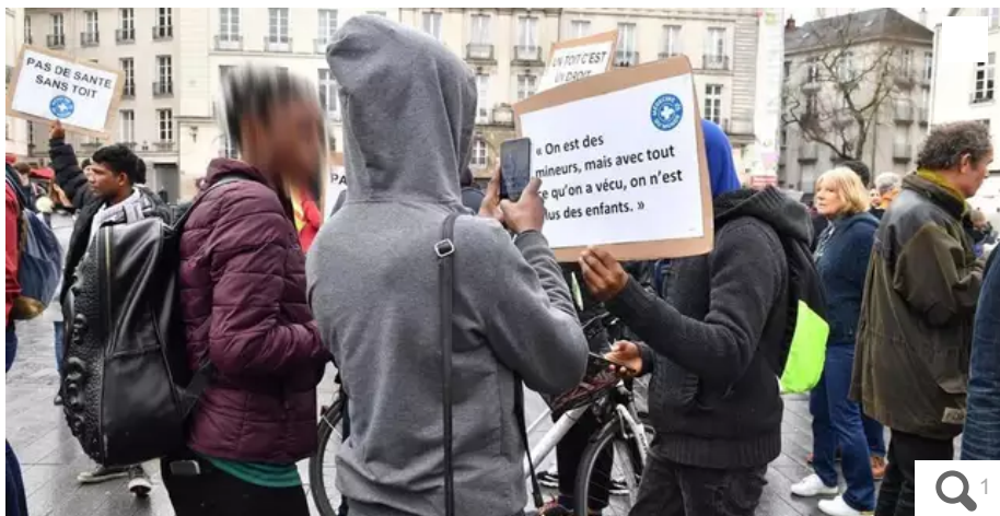
Les associations qui accompagnent les mineurs non accompagnés se heurtent régulièrement à des difficultés d'hébergement, normalement à la charge du Département.

Cinq des élèves de l'école Jem (Jeunes étrangers migrants), à Nantes, qui propose des cours d'alphabétisation aux mineurs non accompagnés, dorment dans la rue depuis la fin du plan grand froid.