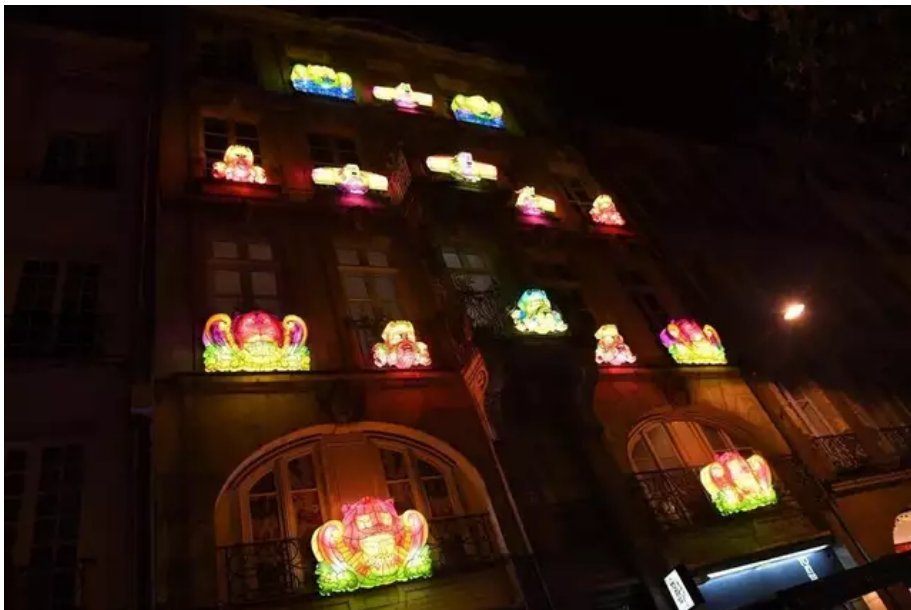
Le Voyage en Hiver existe depuis 2022.? Photo Presse Océan-Nathalie Bourreau

?LIRE AUSSI. Noël à la mer, une autre saison touristique