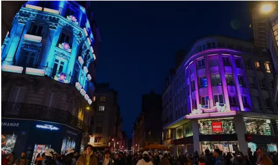
Les illuminations n'ont pas plu à tout le monde.

Les Nantais avaient aussi vivement réagi : « Où sont les vraies décorations de Noël ? » , « l'horreur de Noël à Nantes, comme l'an passé » , « ils sont où les sapins, les boules, les guirlandes... tout ce qui fait Noël en fait » .