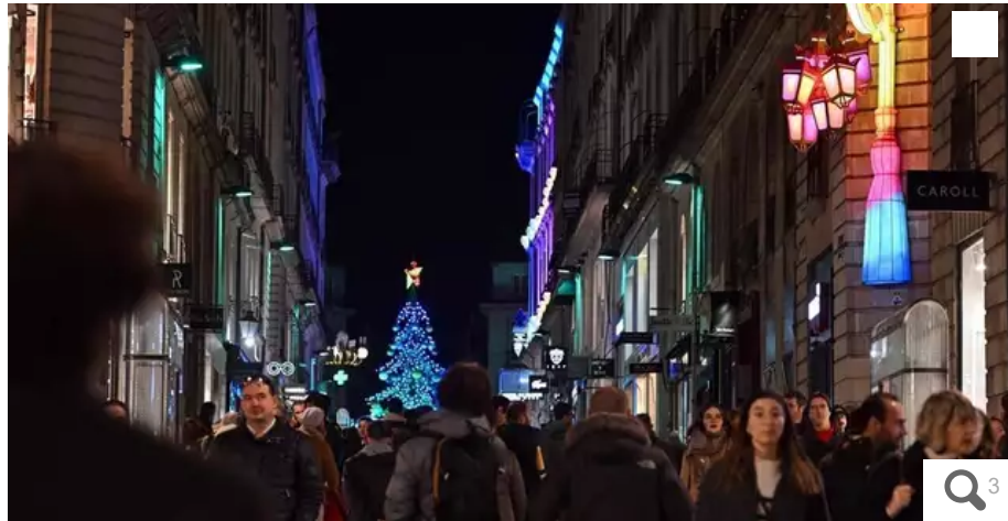
Avec un comptage relevé à 3,7 millions, le Voyage en hiver atteint en seulement deux ans, la fréquentation de l'une des plus grandes destinations reconnues de Noël dans l'hexagone : Strasbourg »

Le Voyage à Nantes a dévoilé, mercredi 14 février 2024, le bilan de sa deuxième édition du Voyage en Hiver. L'événement s'est déroulé du 25 novembre 2023 au 7 janvier 2024. Les décorations ont fait polémique, mais les résultats sont bons.