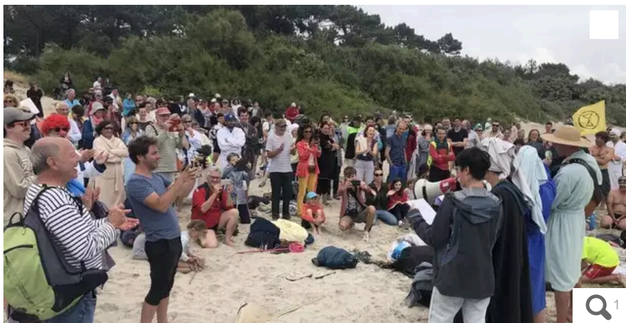
Le 18 juin 2023, le collectif « Stop Thalasso » avait réuni 300 personnes sur la plage de Kerguelen afin de marquer son opposition au projet de thalassothérapie.

Votre e-mail, avec votre consentement, est utilisé par la société Additi Multimedia pour recevoir les newsletters sélectionnées. En savoir plus