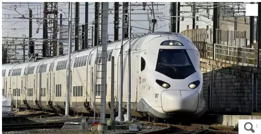
«Le propos n'est pas de stigmatiser une grande entreprise publique mais de respecter le droit des contribuables et usagers à la transparence des chiffres.»

Votre e-mail, avec votre consentement, est utilisé par la société Adalti Multimedia pour recevoir les newsletters sélectionnées. En savoir plus