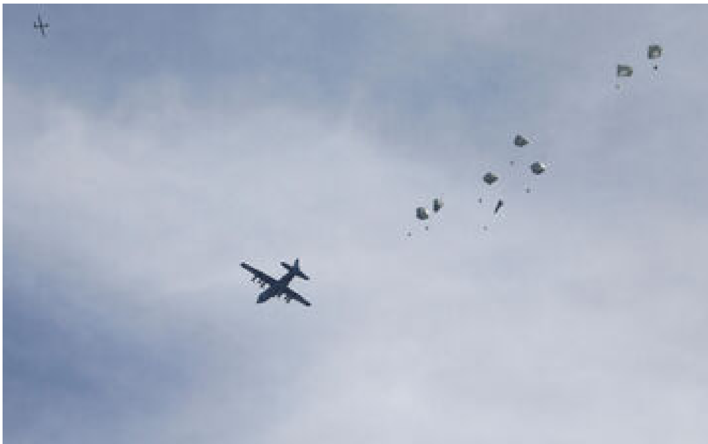
Guerre Israël-Hamas : Joe Biden se résout aux largages d'aide humanitaire sur Gaza