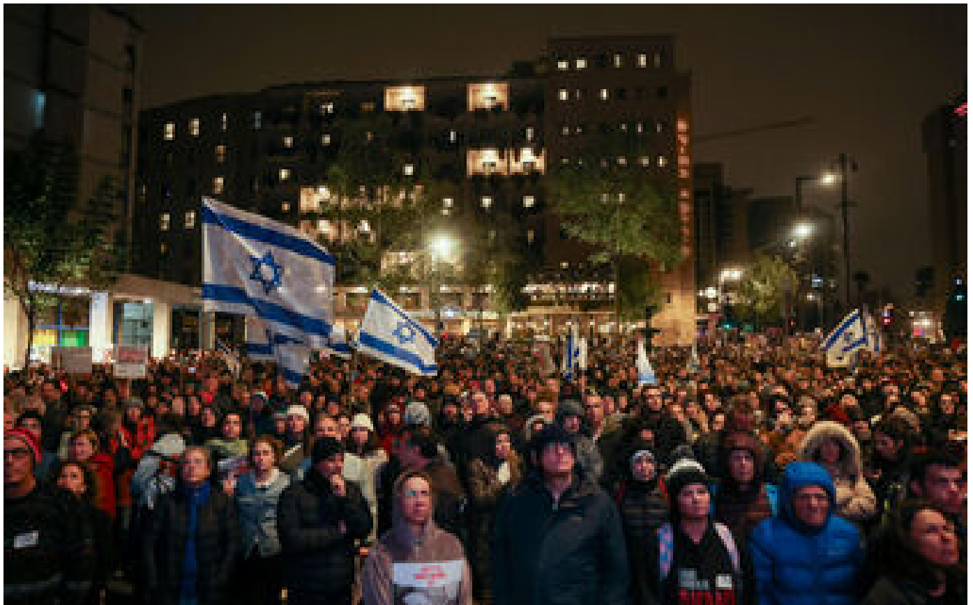
« Ramenez-les à la maison maintenant » : une marche pour réclamer la libération des otages retenus Gaza arrivée à Jérusalem