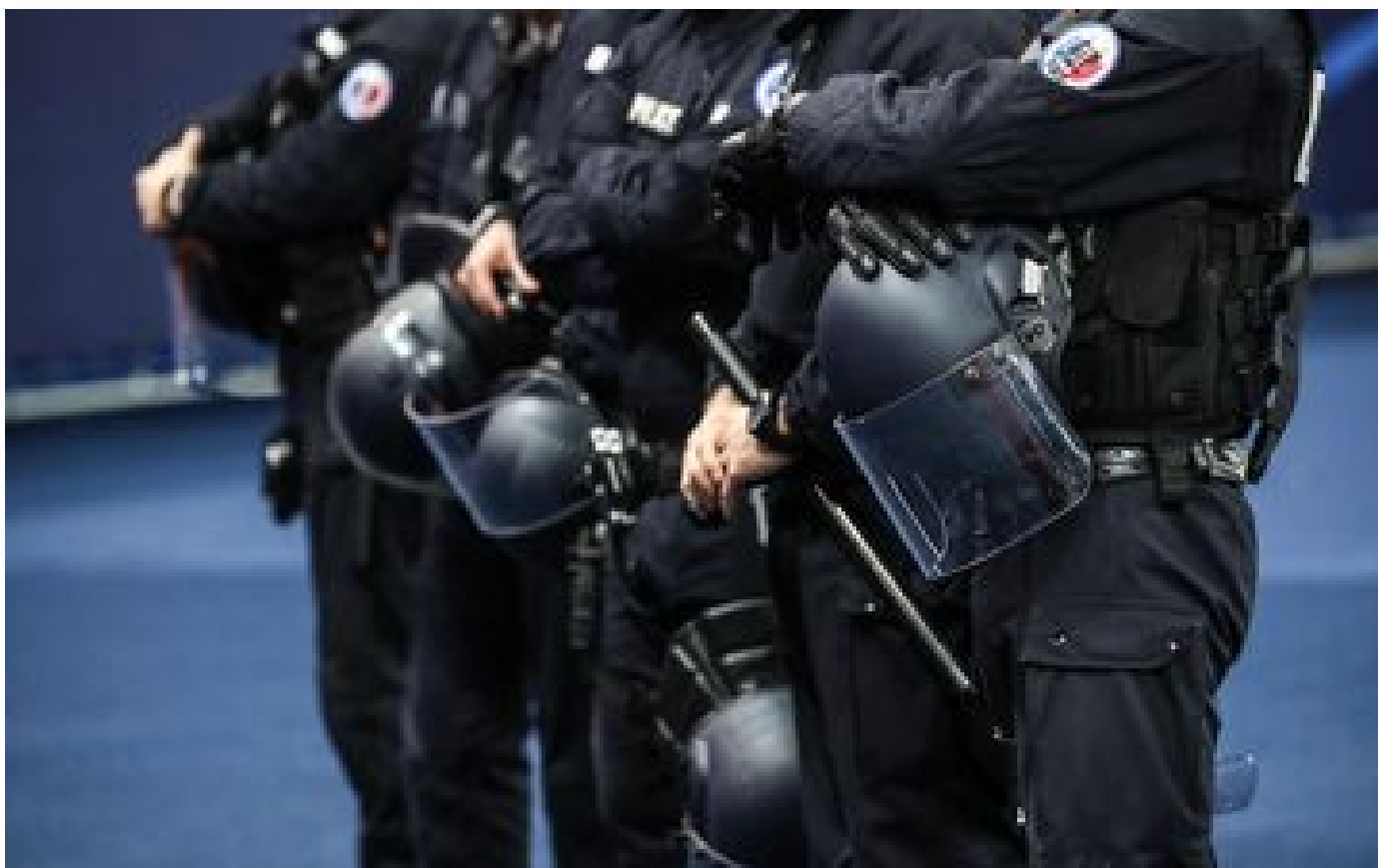
Projet d'attentat contre l'ambassade israélienne en Belgique : une femme de 20 ans arrêtée en Indre-et-Loire et mise en examen