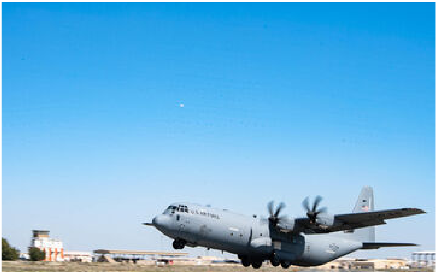
Gaza : le largage de l'aide humanitaire par les airs, une alternative à l'acheminement par camions ? P