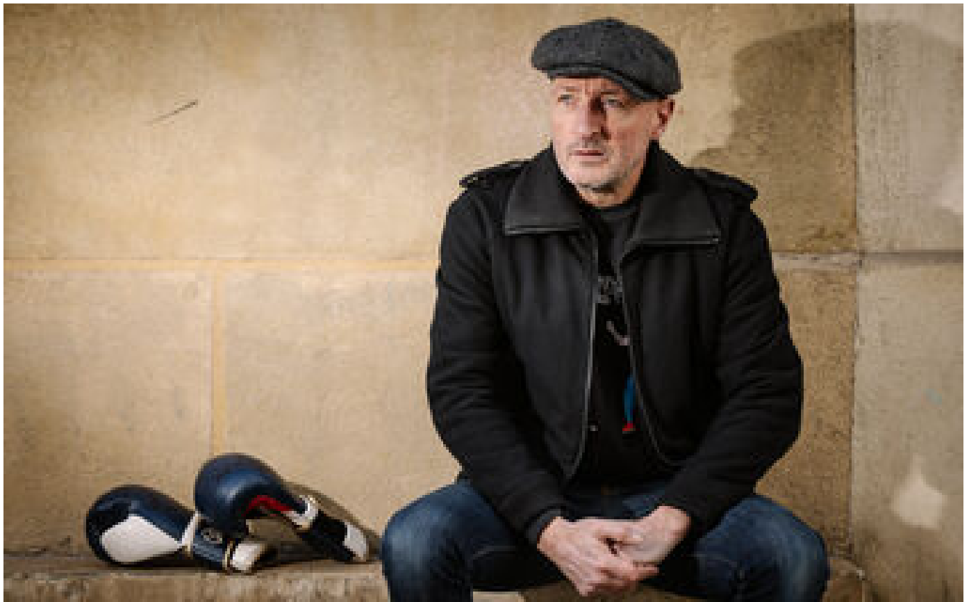
Un repenti dénonce l'incroyable marché noir des créneaux horaires dans les gymnases parisiens P