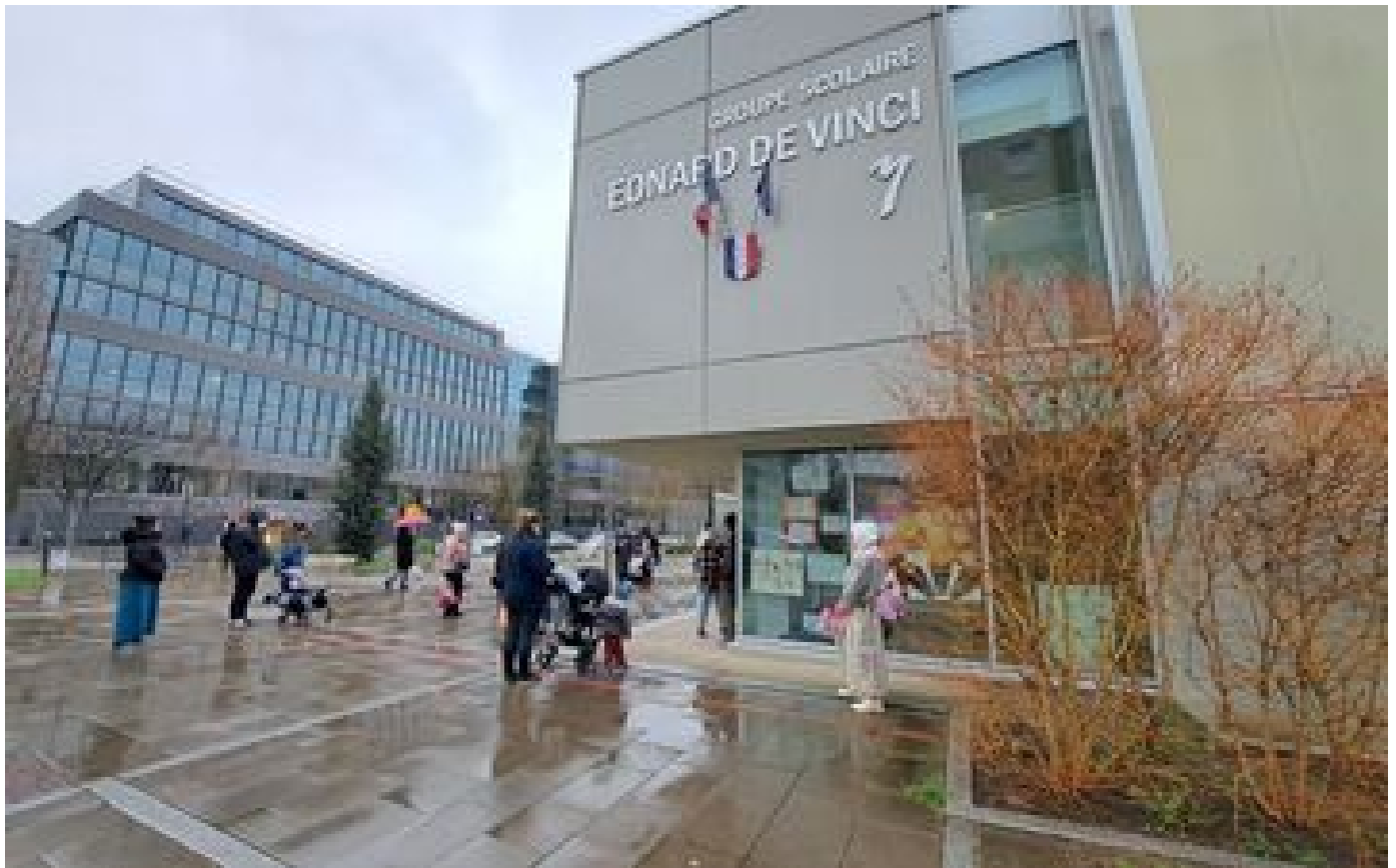
Massy : accusé de harcèlement sexuel par ses collègues, un professeur des écoles suspendu P