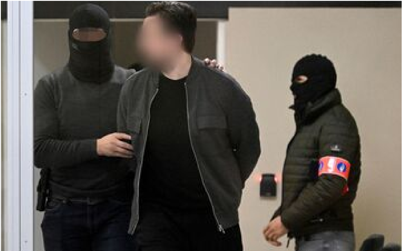
Attentats du 13-Novembre : Salah Abdeslam conteste son isolement en prison