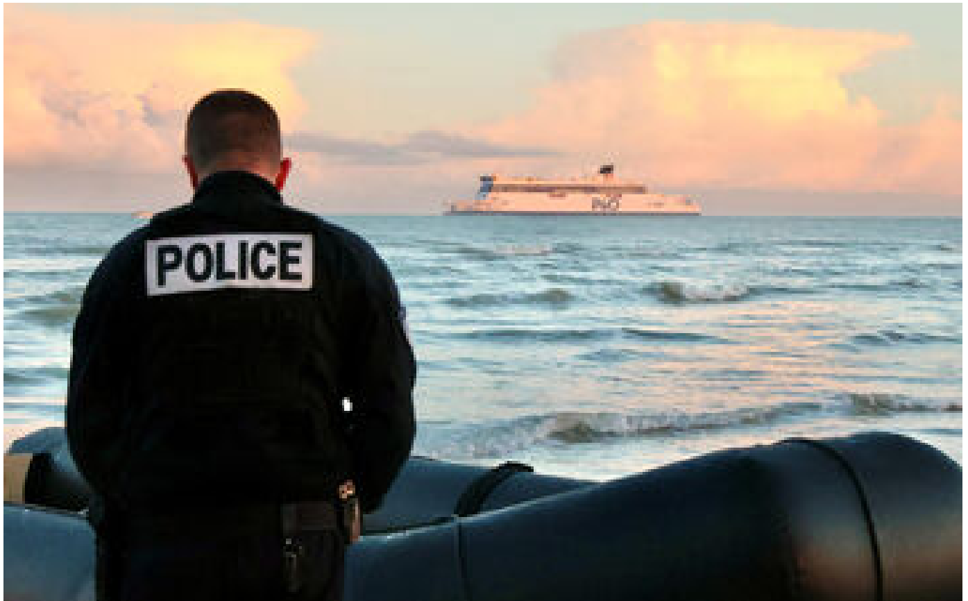
Traversée de la Manche : 78 migrants secourus en quelques heures dans le détroit du Pas-de-Calais