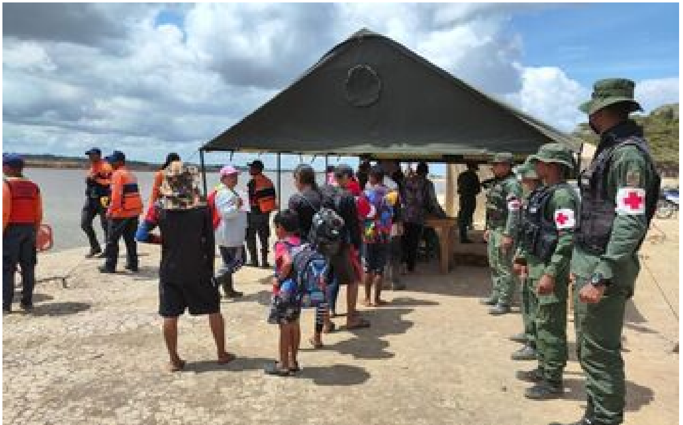
Effondrement d'une mine illégale au Venezuela : plus de 1 200 mineurs, dont des enfants, évacués