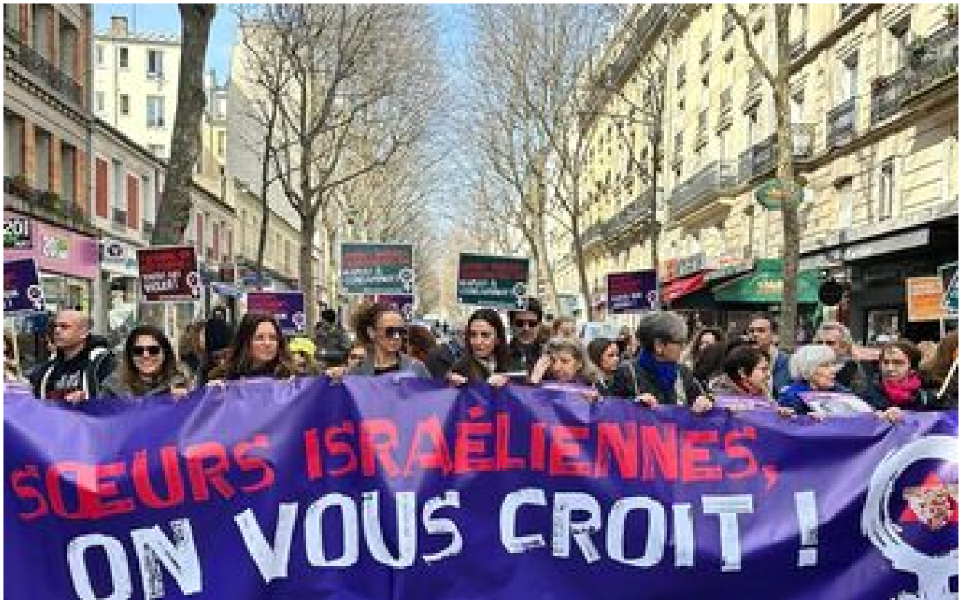
Journée des droits des femmes : des militantes dénonçant les viols du Hamas le 7 octobre exfiltrées du cortège parisien