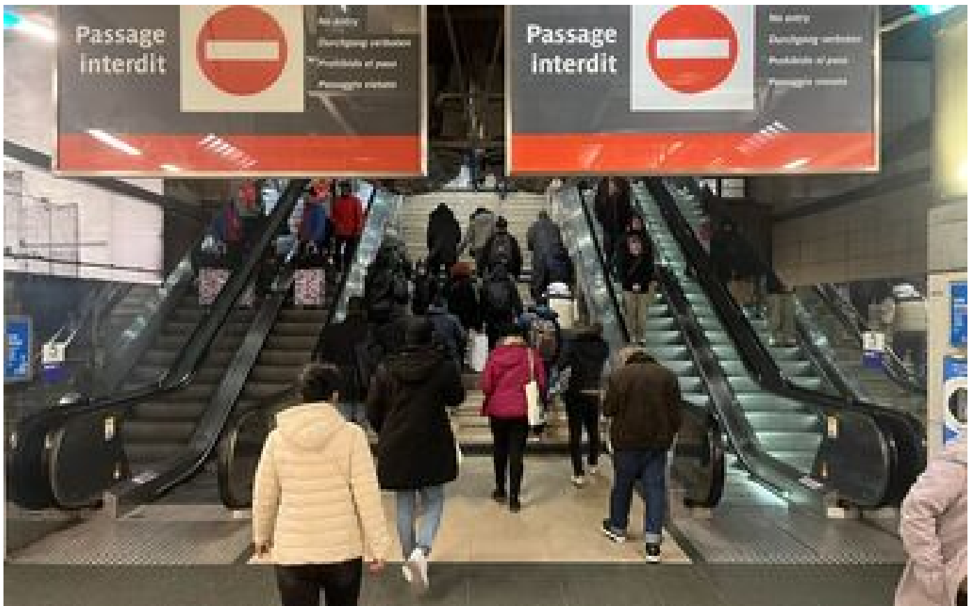
Paris : la RATP met un escalier en sens interdit, elle écope de 25 euros d'amende pour son inattention