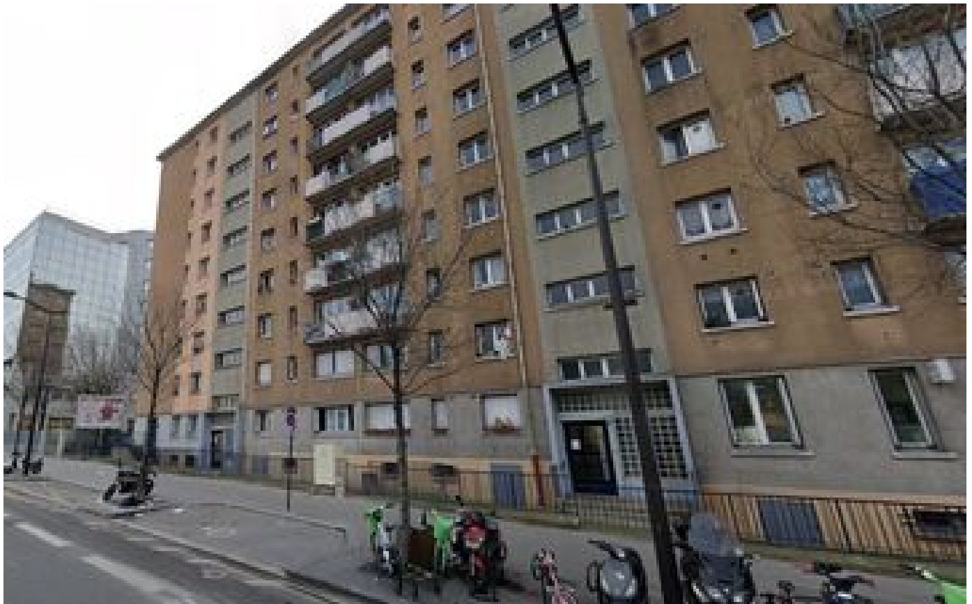
Paris : le partage de butin entre cambrioleurs avait dégénéré en séance de torture