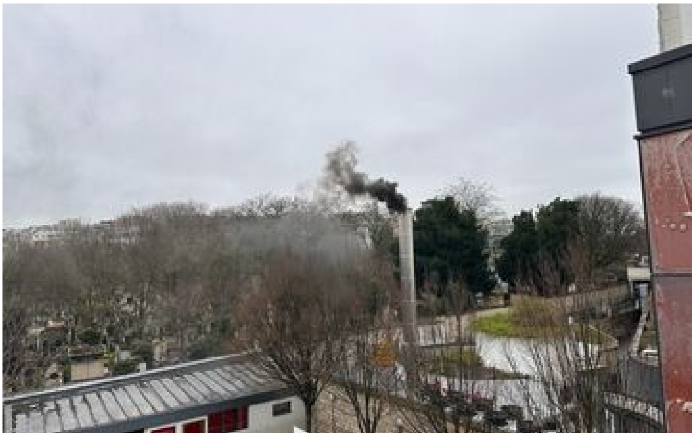
Paris : des parents d'élèves inquiets de nouvelles fumées noires issues d'une cheminée industrielle voisine