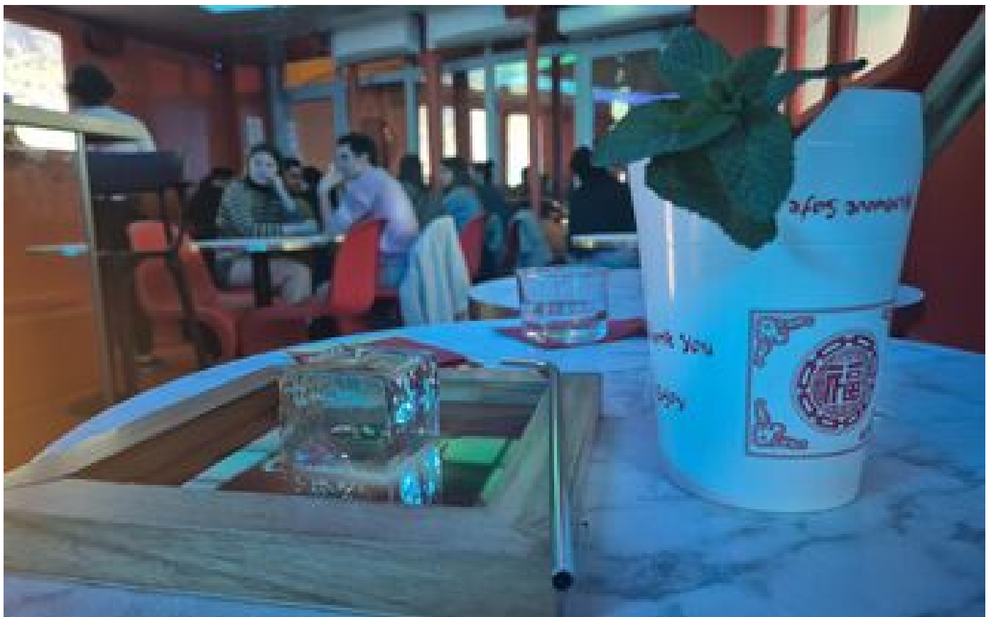
« Des cocktails fous » : Afrique, Asie, Amérique... À Paris, le bar immersif Unplug vous emmène en voyage