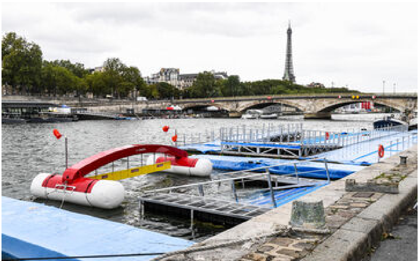
Les critiques sur l'eau de la Seine pour les JO de Paris agacent : « Laissons travailler les gens compétents » P