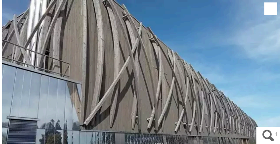
L'école Claire-Brétécher, où sont désormais installés des panneaux photovoltaïques.