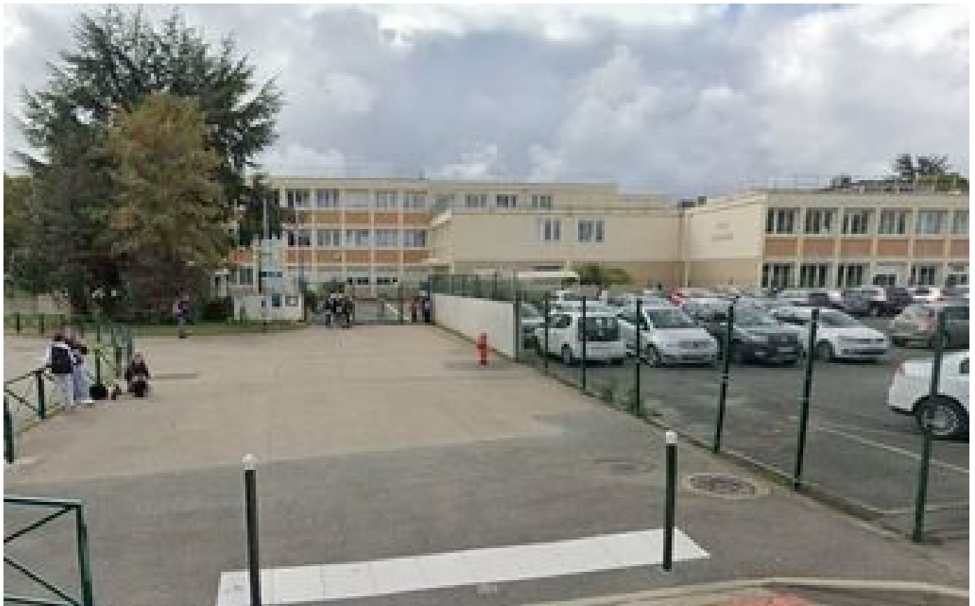
« Mes nerfs ont lâché » : 800 euros d’amende pour le père qui a giflé le surveillant d’un collège en Essonne