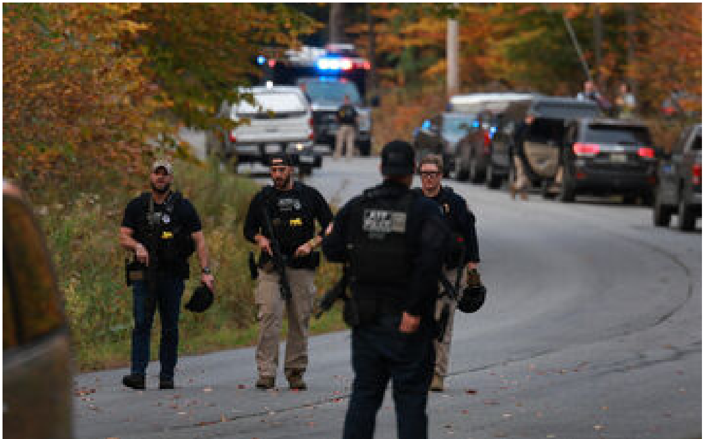
États-Unis : quatre morts dans une attaque au couteau dans l'Illinois