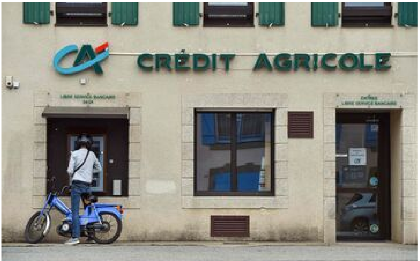
Crédit Agricole : pourquoi faut-il désormais taper deux fois son code bancaire dans certains distributeurs ?