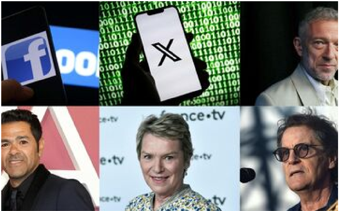
Jamel Debbouze, Élise Lucet, Vincent Cassel... de fausses interviews de célébrités font la promotion de sites de cryptomonnaies