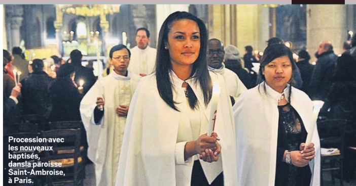
Procession avec les nouveaux baptisés, dans la paroisse Saint-Ambroise, à Paris.