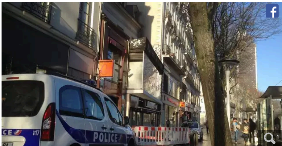
Les deux hommes, placés sous obligation de quitter le territoire français, avaient été contrôlés, le 21 février 2024, allée Cassard, le long du cours des Cinquante-Otages, à Nantes.

Votre e-mail, avec votre consentement, est utilisé par la société Additi Multimedia pour recevoir les newsletters sélectionnées. En savoir plus