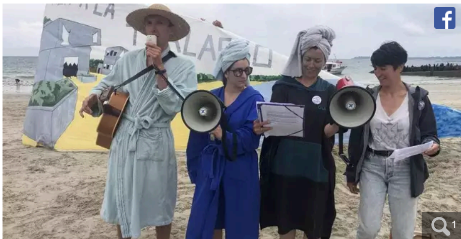
Les peignoirs seront de nouveau de sortie à Lorient (Morbihan) ce samedi 6 avril 2024 pour les opposants au projet de thalasso à Larmor-Plage.

Votre e-mail, avec votre consentement, est utilisé par la société Additi Multimedia pour recevoir les newsletters sélectionnées. En savoir plus