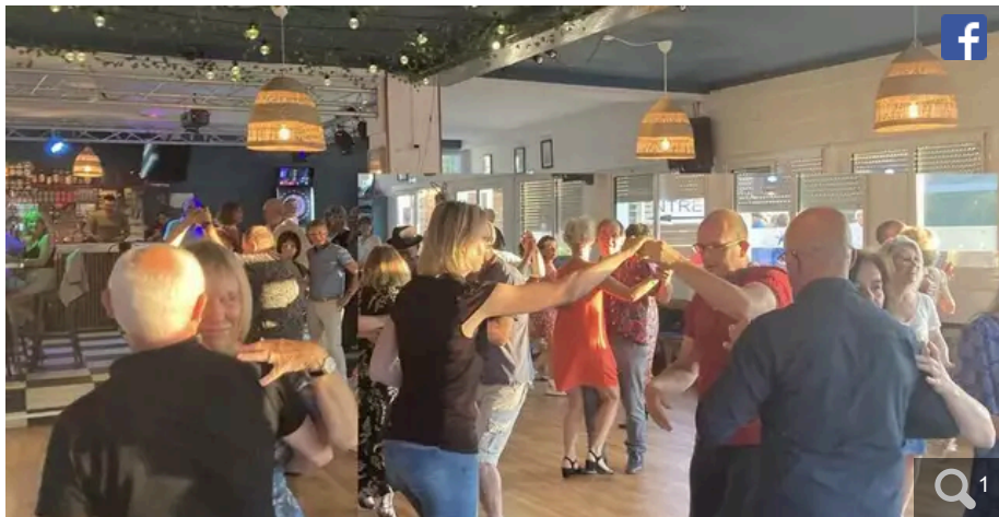
L'association J'peux pas j'ai bal propose un bal dimanche à l'Étoile de Mer.

Votre e-mail, avec votre consentement, est utilisé par la société Additi Multimedia pour recevoir les newsletters sélectionnées. En savoir plus