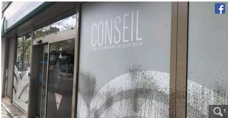
Des projections de gouache noire sur l'agence alréenne de la banque BNP, effectuée le 10 mai 2023.

Votre e-mail, avec votre consentement, est utilisé par la société Additi Multimedia pour recevoir les newsletters sélectionnées. En savoir plus