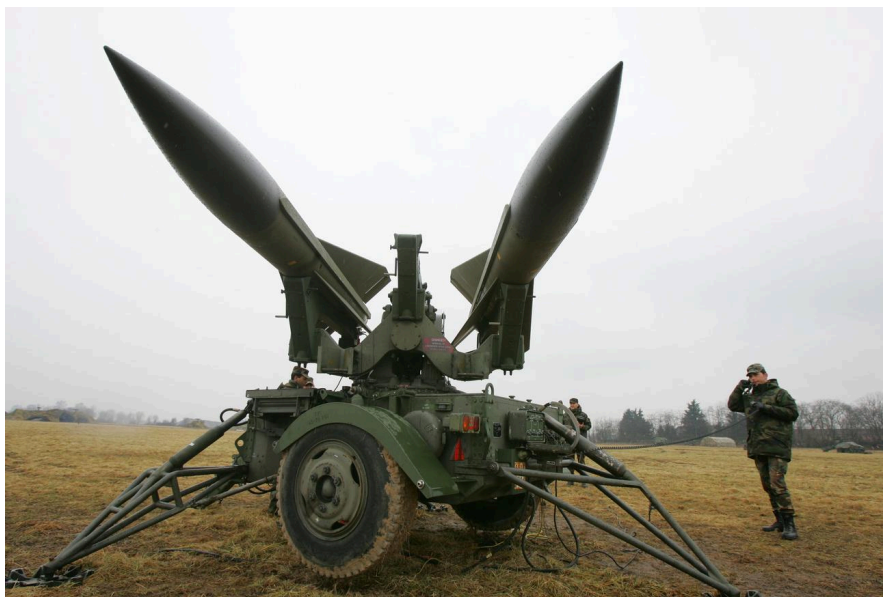
Washington a fourni à l'Ukraine des systèmes d'ancienne génération Hawk pour sa défense anti-aérienne.

Les Etats-Unis ont autorisé la vente à l'Ukraine d'équipements militaires d'une valeur de 138 millions de dollars (presque 125 millions de francs) pour réparer et mettre à niveau des systèmes de missiles Hawk, alors qu'une aide militaire de 60 milliards de dollars reste bloquée au Congrès.