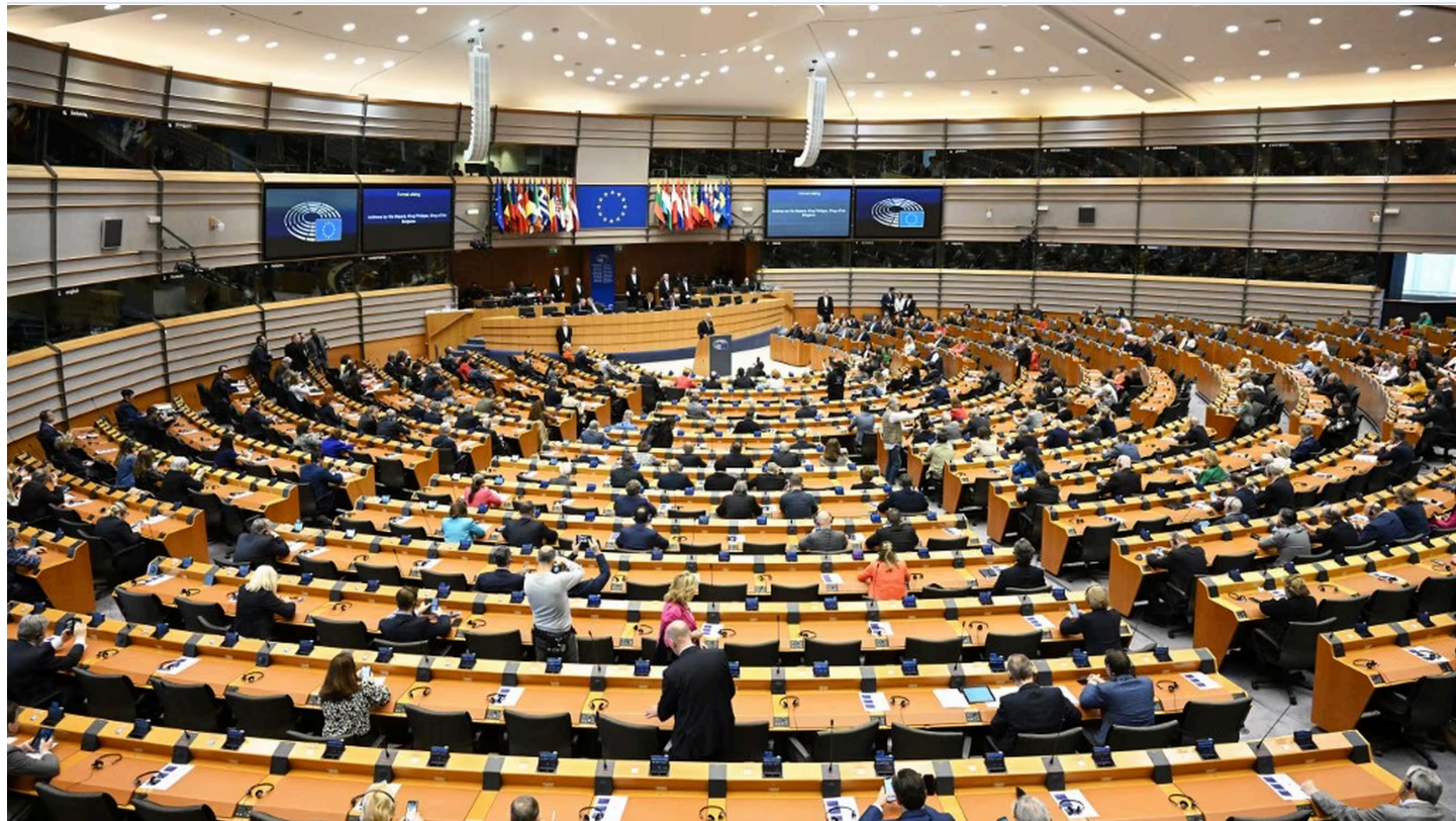
Une séance du Parlement européen, le 10 avril 2024 à Bruxelles (Belgique).

Le pacte validé par les eurodéputés mercredi prévoit notamment une procédure accélérée pour examiner des demandes d'asile, à proximité des frontières extérieures, via un système de "filtrage" obligatoire et préalable à l'entrée d'un migrant dans l'UE.