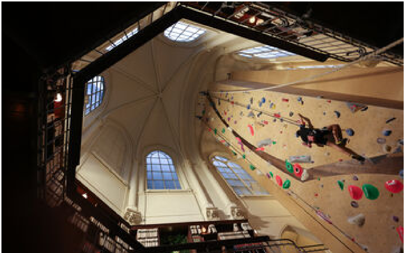
Club électro, décor de films, salle d'escalade... l'étonnante seconde vie des églises de Paris