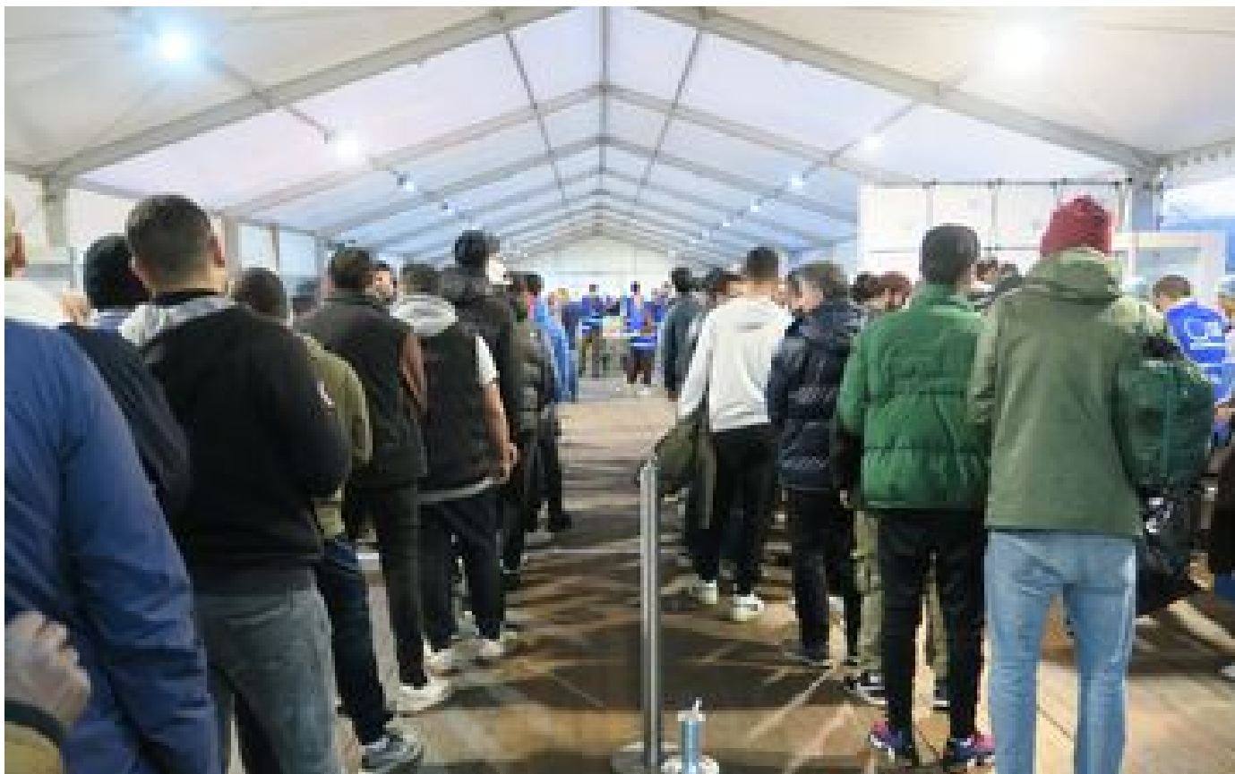
« Ce restaurant m'a sauvé » : à Saint-Denis, les Tables du ramadan n'ont jamais attiré autant P