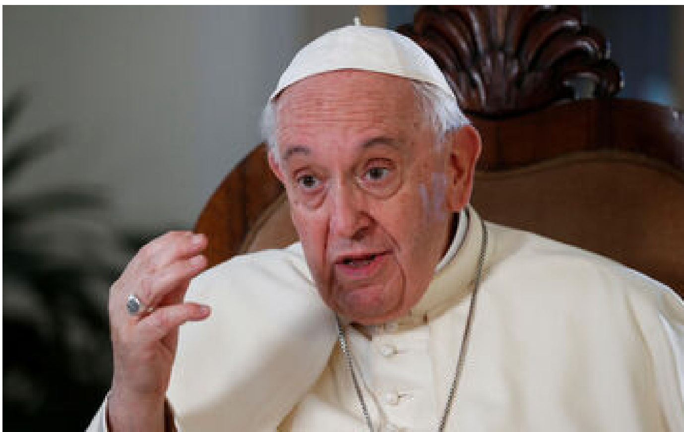
GPA, migrants, homosexualité... dans un long texte, le Vatican se positionne et défend la « dignité humaine »