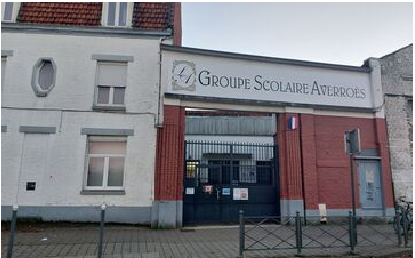
Le lycée Averroès va « pouvoir assurer la rentrée 2024 » malgré la rupture du contrat avec l'État