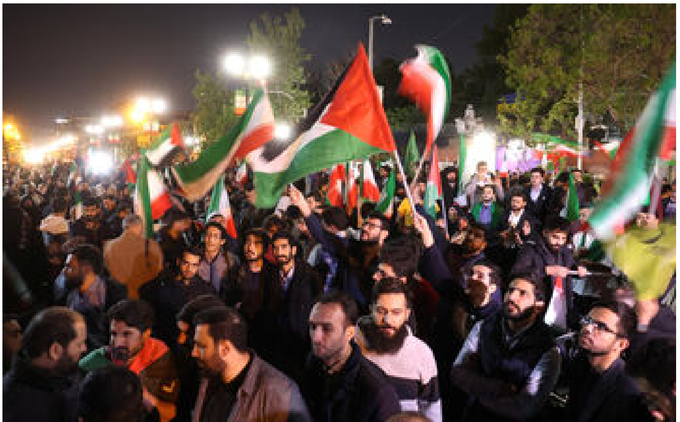
DIRECT. Frappes iraniennes en Israël : l'Iran convoque les ambassadeurs britannique, français et allemand