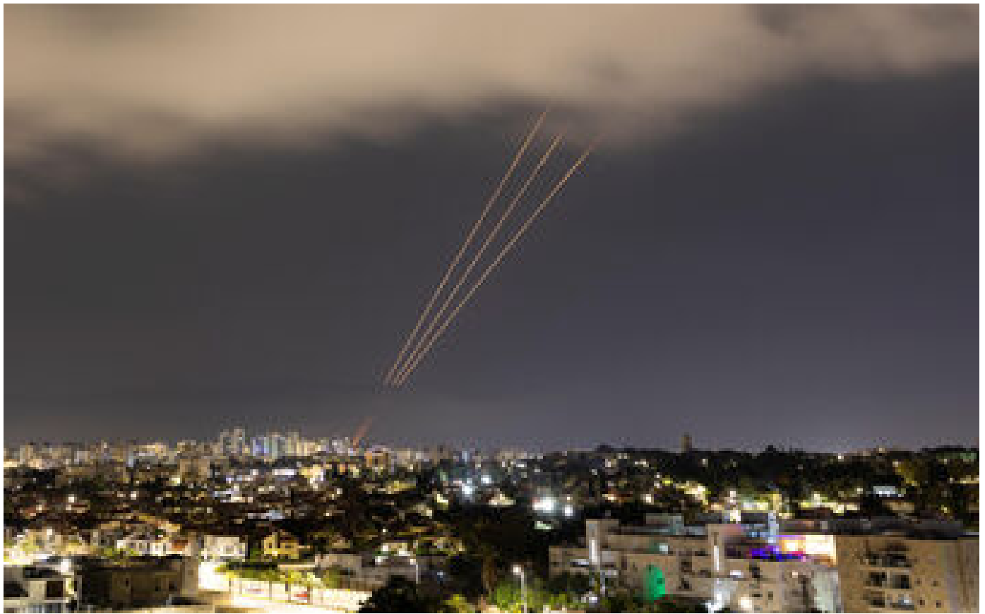
Attaque de l'Iran contre Israël : la nuit où Téhéran a envoyé drones et missiles contre l'État hébreu