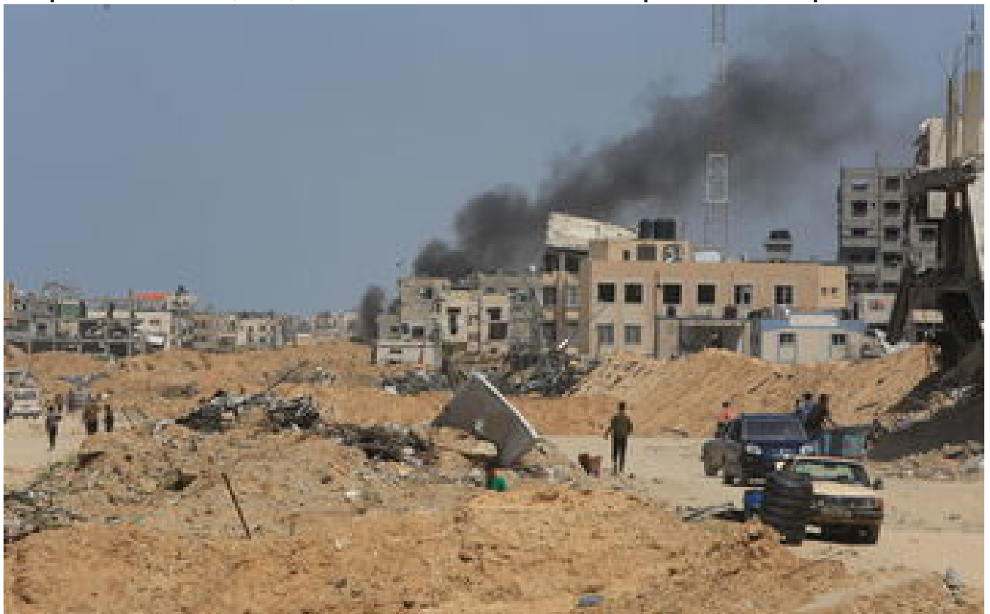
Le Hamas a rejeté le projet de trêve à Gaza, selon les services secrets israéliens