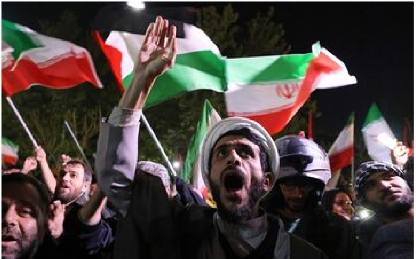
Attaque de l'Iran contre Israël : États-Unis, ONU, France... les inquiétudes grandissantes d'une « escalade dévastatrice »