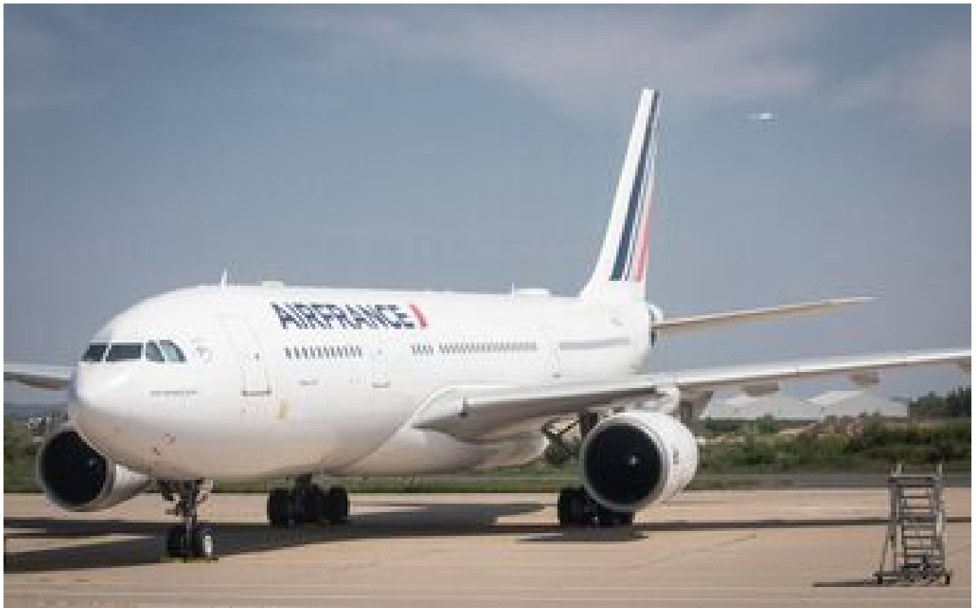
Attaque de l'Iran : l'Israël, l'Irak, la Jordanie et le Liban rouvrent leur espace aérien fermé pendant la nuit