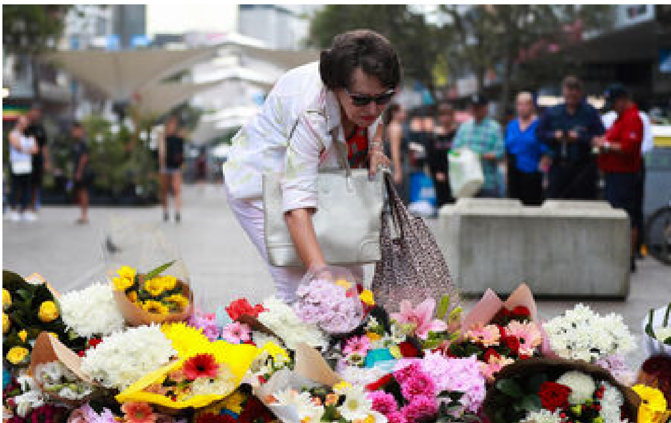
Attaque mortelle en Australie : l'agresseur au couteau « s'est concentré sur les femmes », selon la police