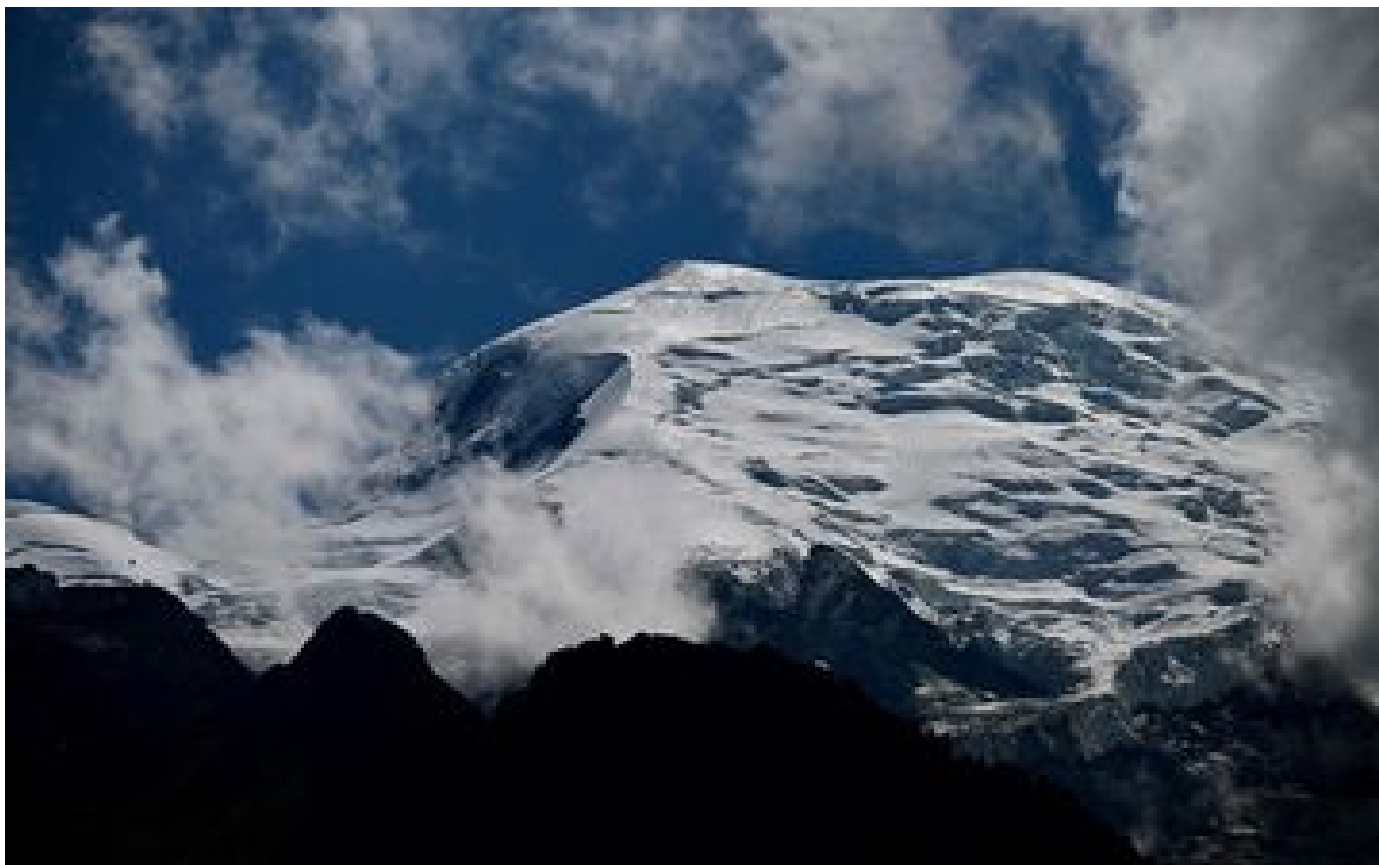
Haute-Savoie : un skieur de 25 ans meurt après une chute de 500 m