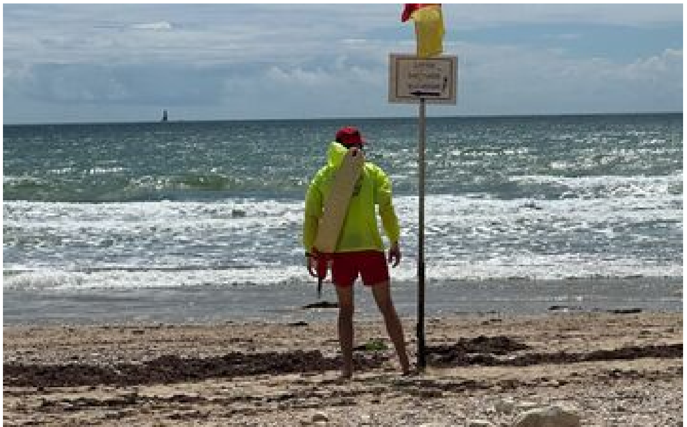
Alerte aux baignes dans le Sud-Ouest : un baigneur se noie dans une zone non-surveillée au Cap-Ferret