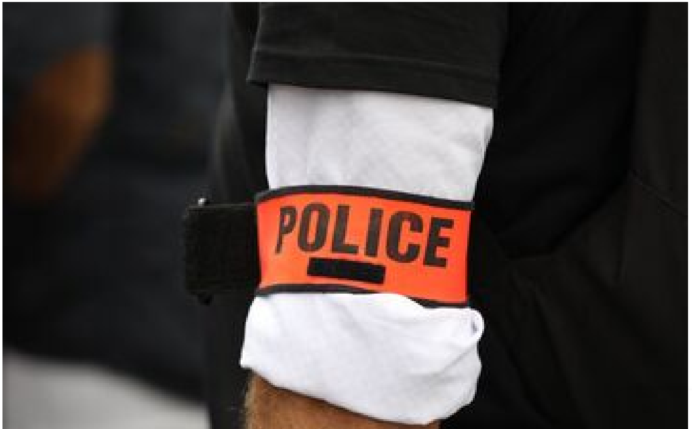
Tours : un policier mis en examen pour avoir drogué deux de ses collègues