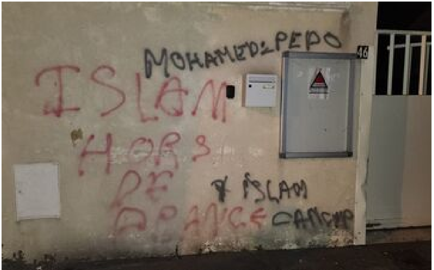
La mosquée de Cherbourg-en-Cotentin de nouveau visée par des tags islamophobes