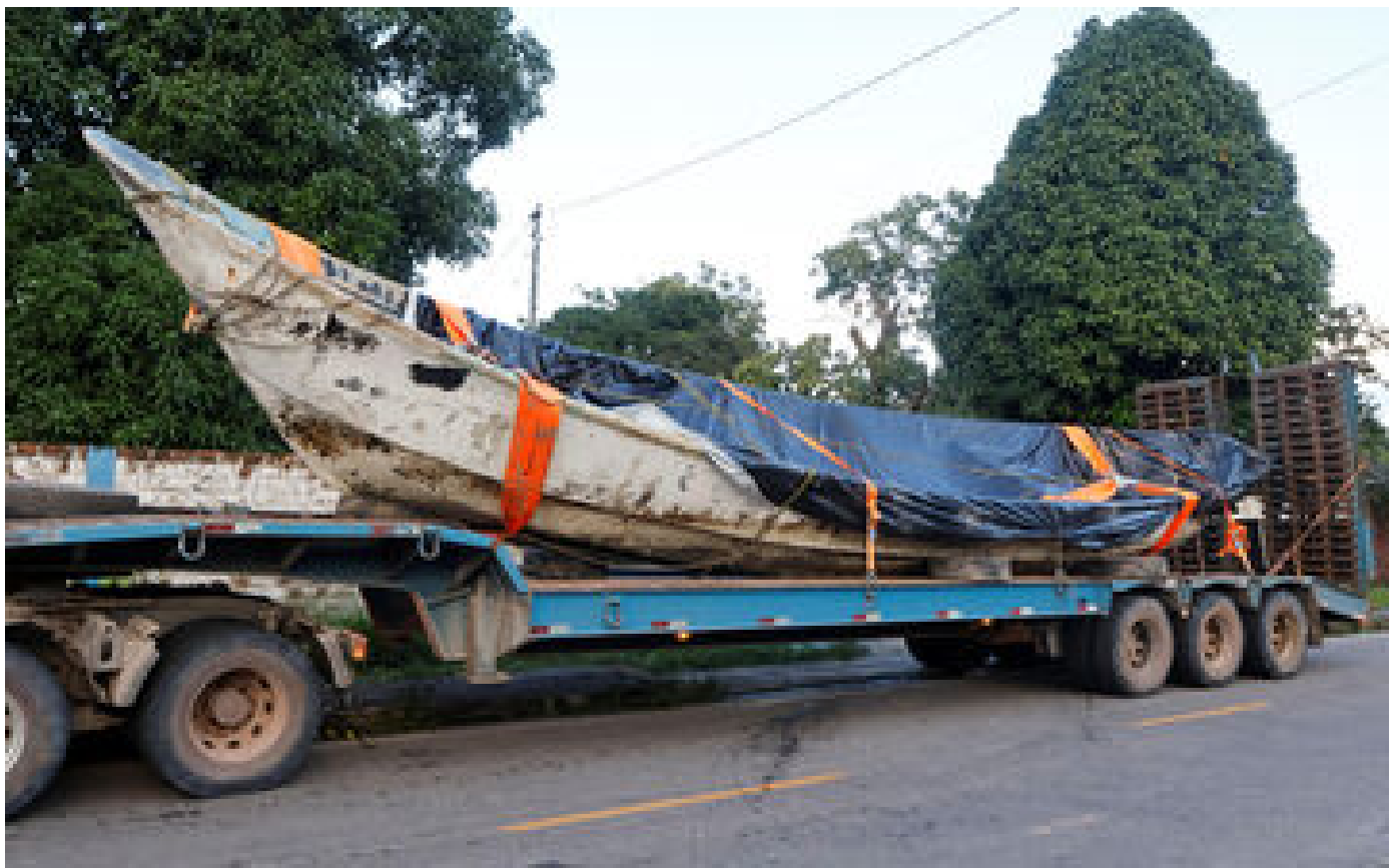
Au Brésil, 20 corps en décomposition découverts sur une embarcation à la dérive