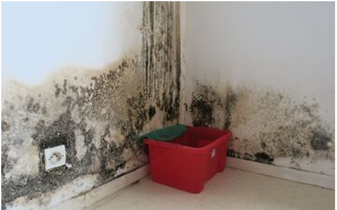
Les dégâts des eaux, cauchemar numéro 1 des Français : plus d'un million de sinistres par an P