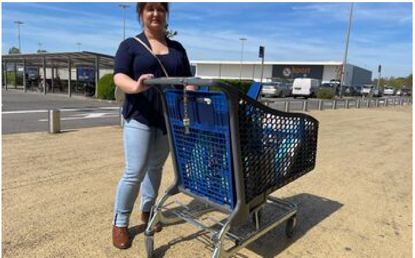
Salaire décent : « Avec 2 000 euros par mois, tout le monde vivrait normalement » P