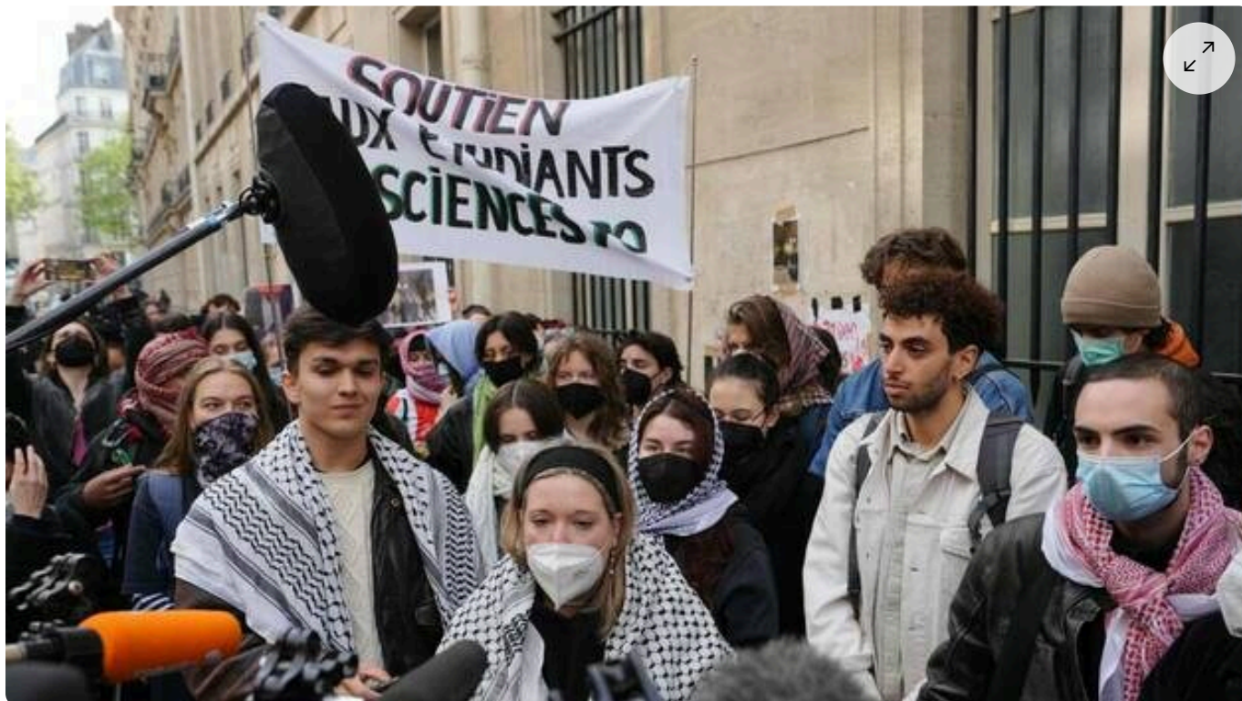
Des manifestants portant des keffiyehs palestiniens s’adressent à la presse sous une banderole indiquant « soutien aux étudiants de Sciences Po » alors que des étudiants occupent un bâtiment de Sciences Po Paris en soutien aux Palestiniens, à Paris le 26 avril 2024.