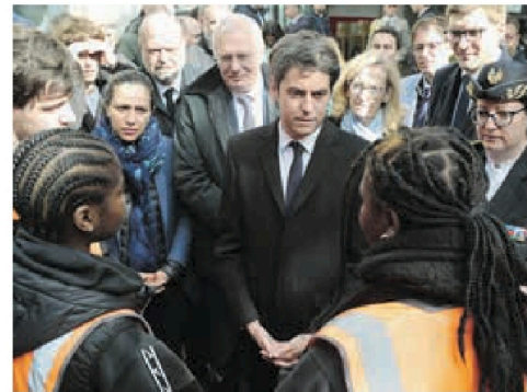
Gabriel Attal, le 18 avril à Viry-Châtillon, avait souhaité « ouvrir le débat » sur la question de l'excuse de minorité, dans la ville où un autre adolescent, Shemseddine, venait d'être tué.

Le premier ministre a en revanche maintenu le soir même le lancement de consultations avec les forces politiques, notamment pour évaluer la faisabilité d'une révision de l'excuse de minorité. Disposition la plus incisive de la palette de mesures qu'il a présentées à Viry-Châtillon le 18 avril dernier - ou un