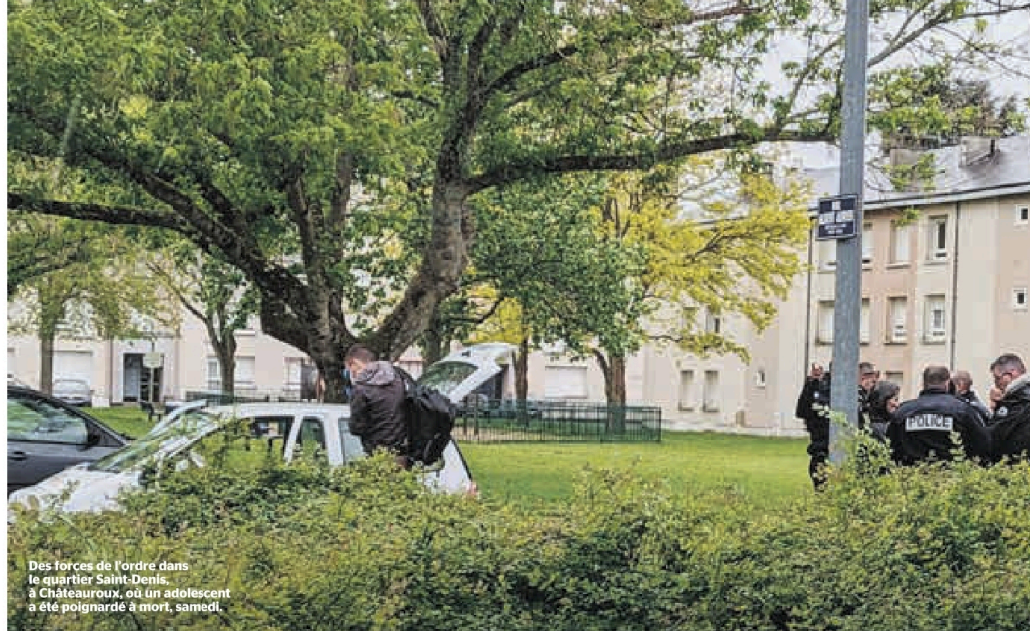
Des forces de l'ordre dans le quartier Saint-Denis, à Châteauroux, où un adolescent a été poignardé à mort, samedi.

Selon plusieurs témoignages, la mère de Rahim* pourrait elle aussi être impliquée dans l'agression du jeune Matisse. Cette femme de 37 ans sans antécédents judiciaires est suspectée d'avoir porté des coups à la victime alors qu'elle agonisait au sol. Pourquoi une telle sauvagerie ? En garde à vue, l'agresseur aurait invoqué des insultes racistes proférées par Matisse pour justifier son passage à l'acte. Une version qui n'est pour le mo-