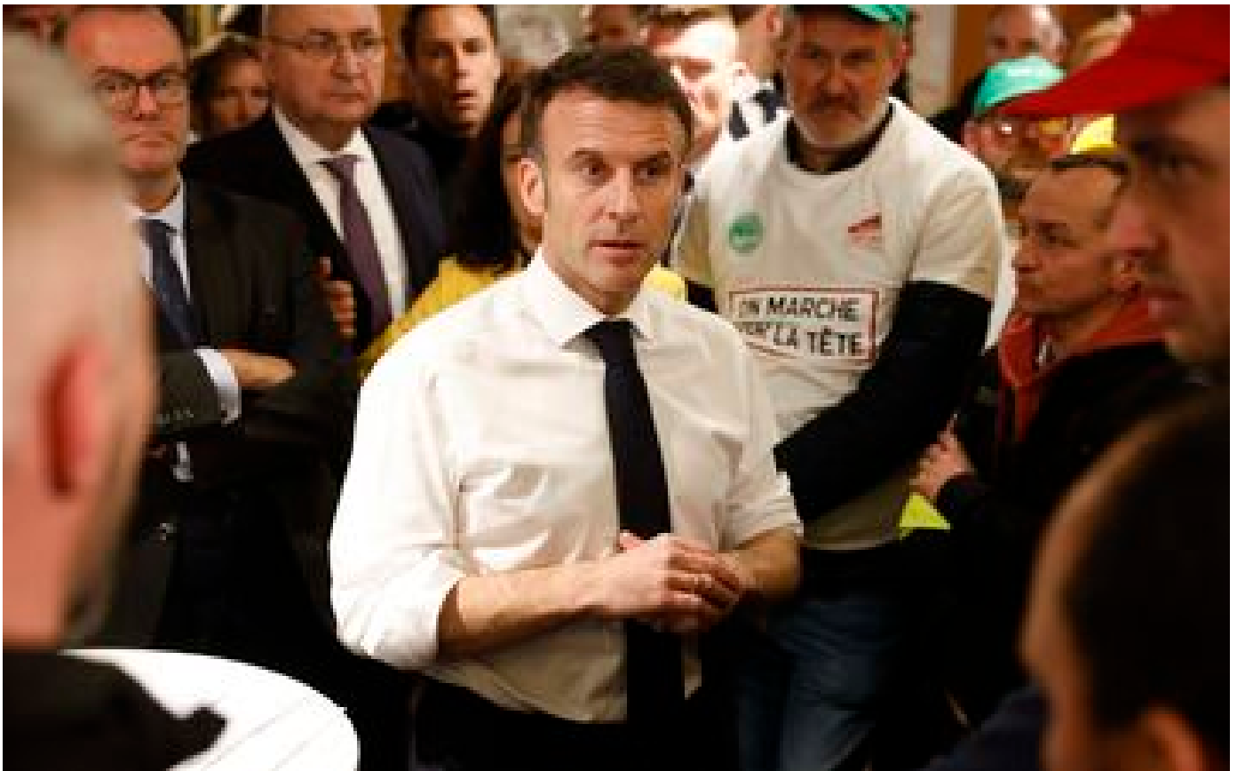
Crise agricole : Emmanuel Macron recevra les syndicats le 2 mai à l'Élysée