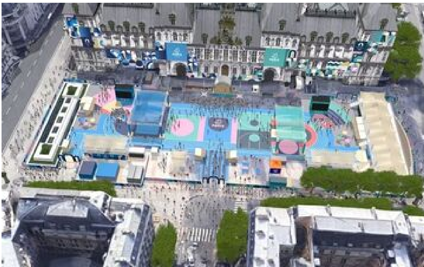
JO Paris 2024 : concerts, espaces sportifs, feu d'artifice... la capitale se prépare à « quatre mois de fête