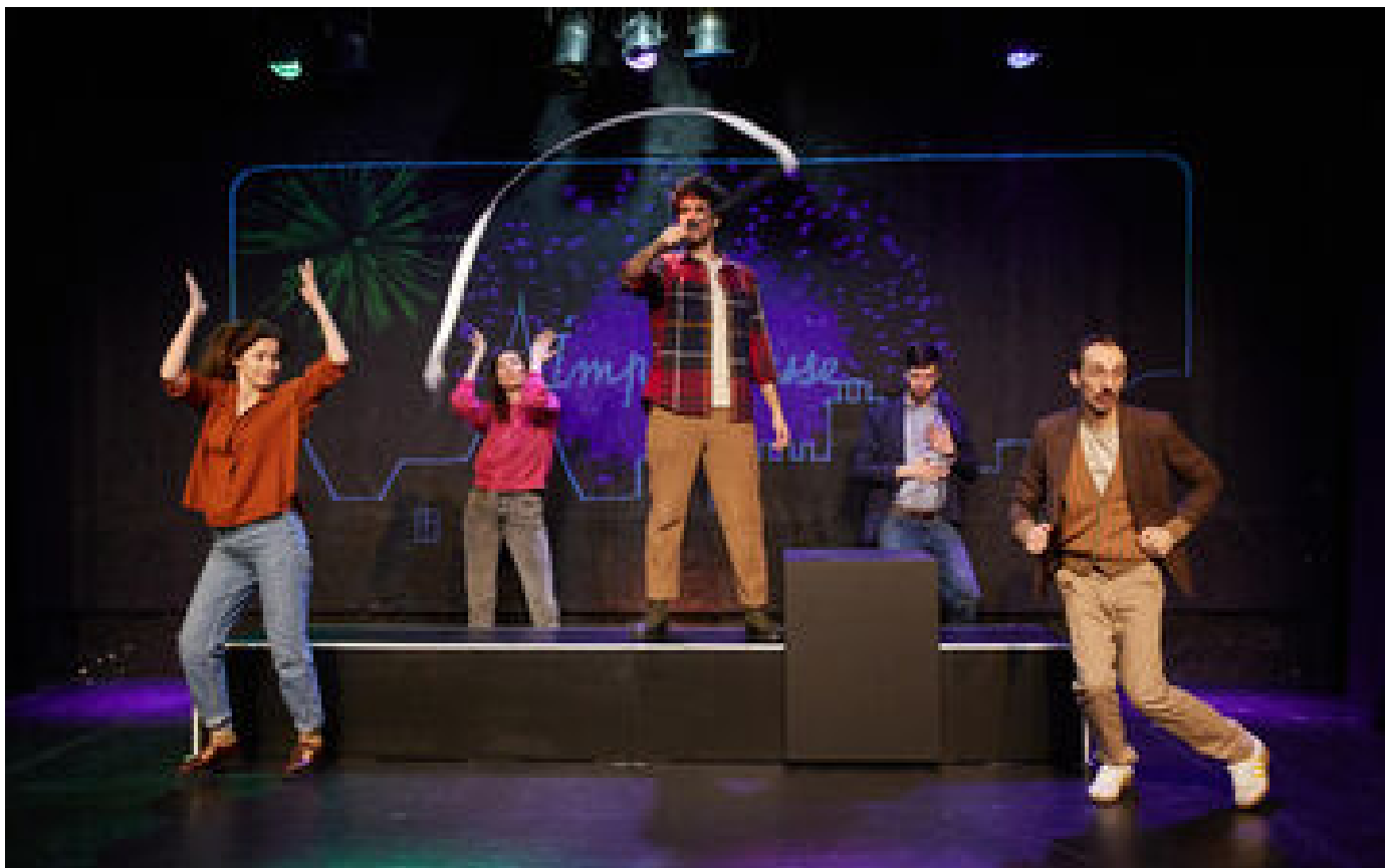
« Pauvre Bitos », « Je m'appelle Asher Lev », « Kessel »... 5 pièces nommées aux Molières encore à l'affiche P