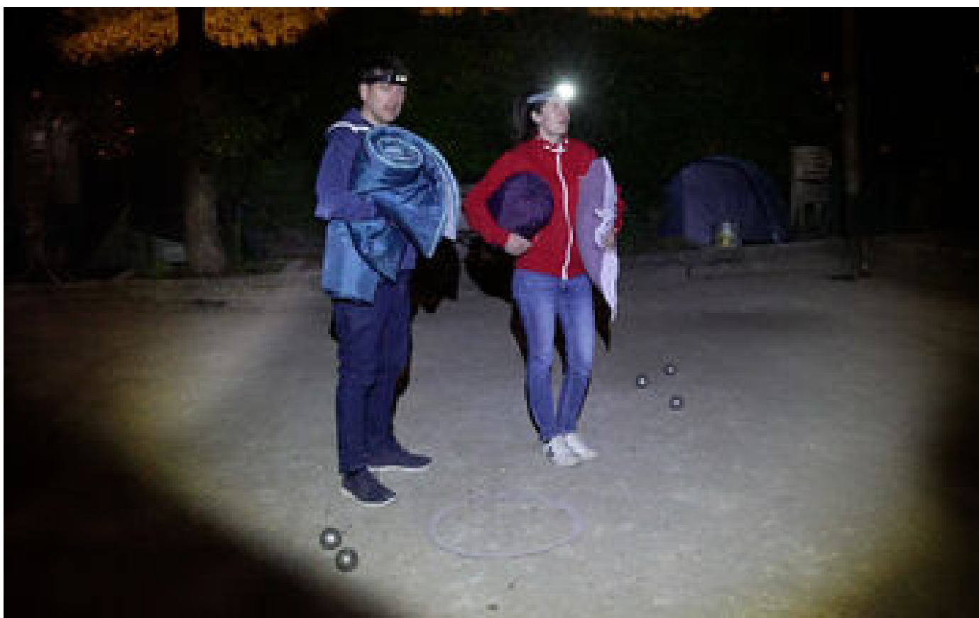
VIDÉO. « J'ai apporté mon duvet ! » : à Montmartre, les boulistes montent la garde la nuit pour sauver leur terrain