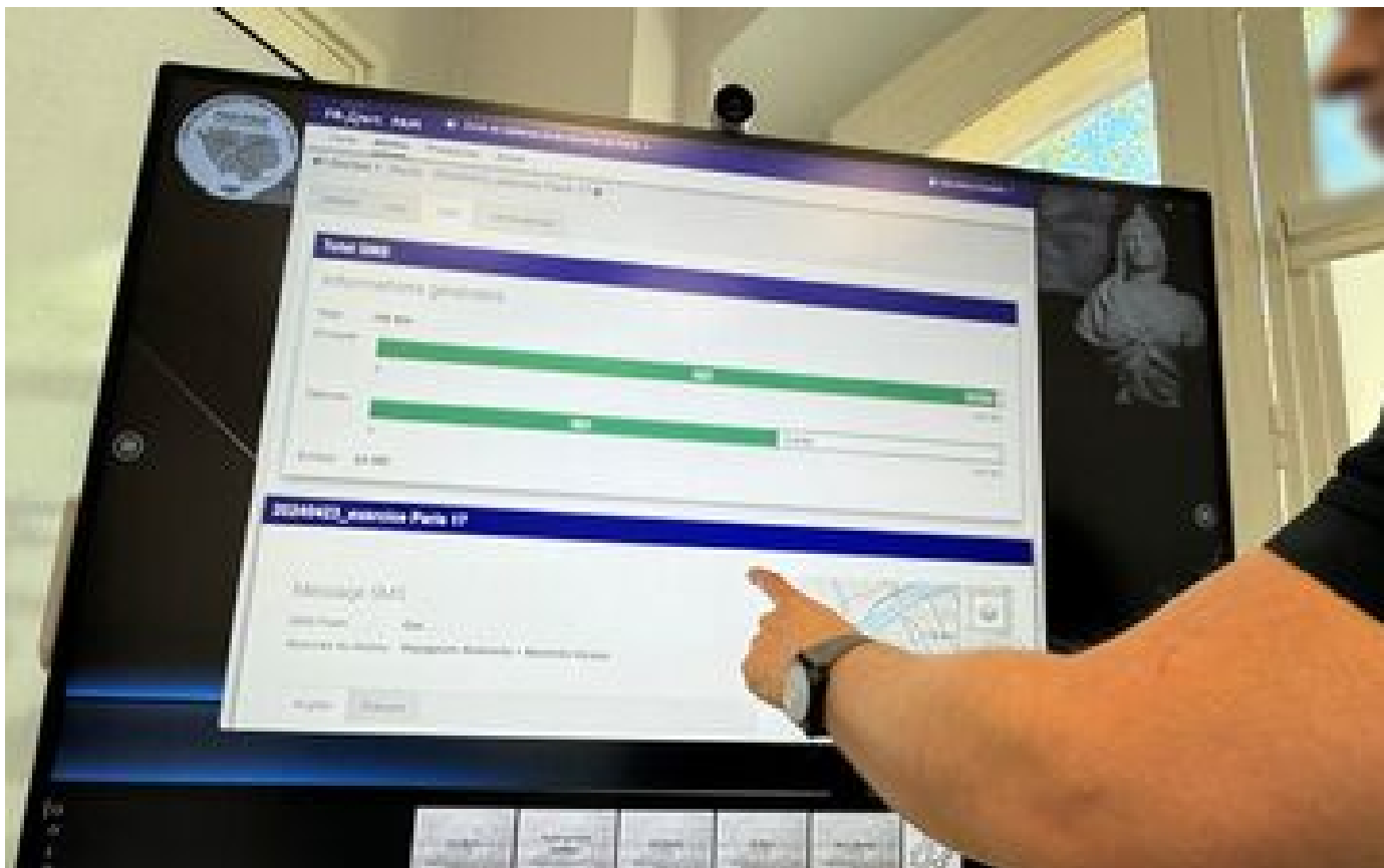
« Alerte extrêmement grave » : à Paris, au cœur de la cellule de crise du dispositif FR-Alert