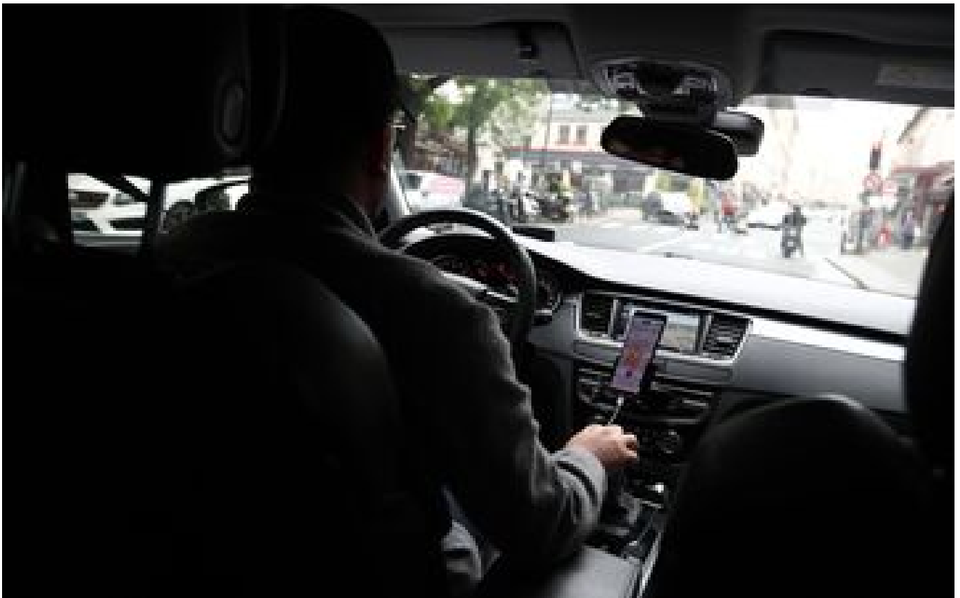
Paris : un chauffeur VTC mis en examen pour le viol d'une cliente P