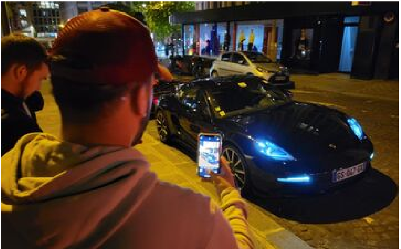
Les parkings de Paris, terrain de jeu favori des fans de voitures de luxe : « On touche avec les yeux »