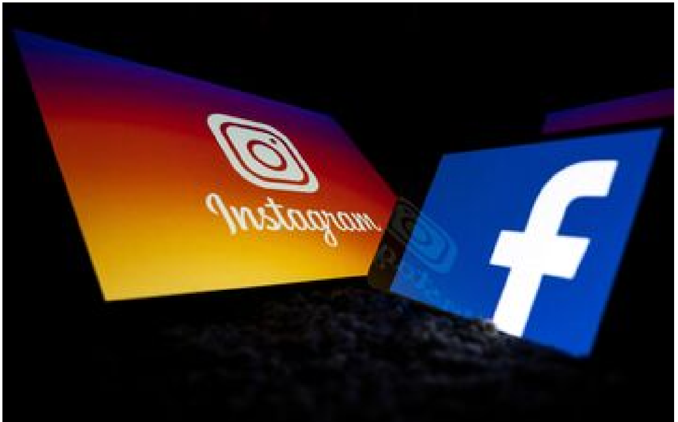
Européennes et désinformation : Facebook et Instagram dans le viseur de l'UE