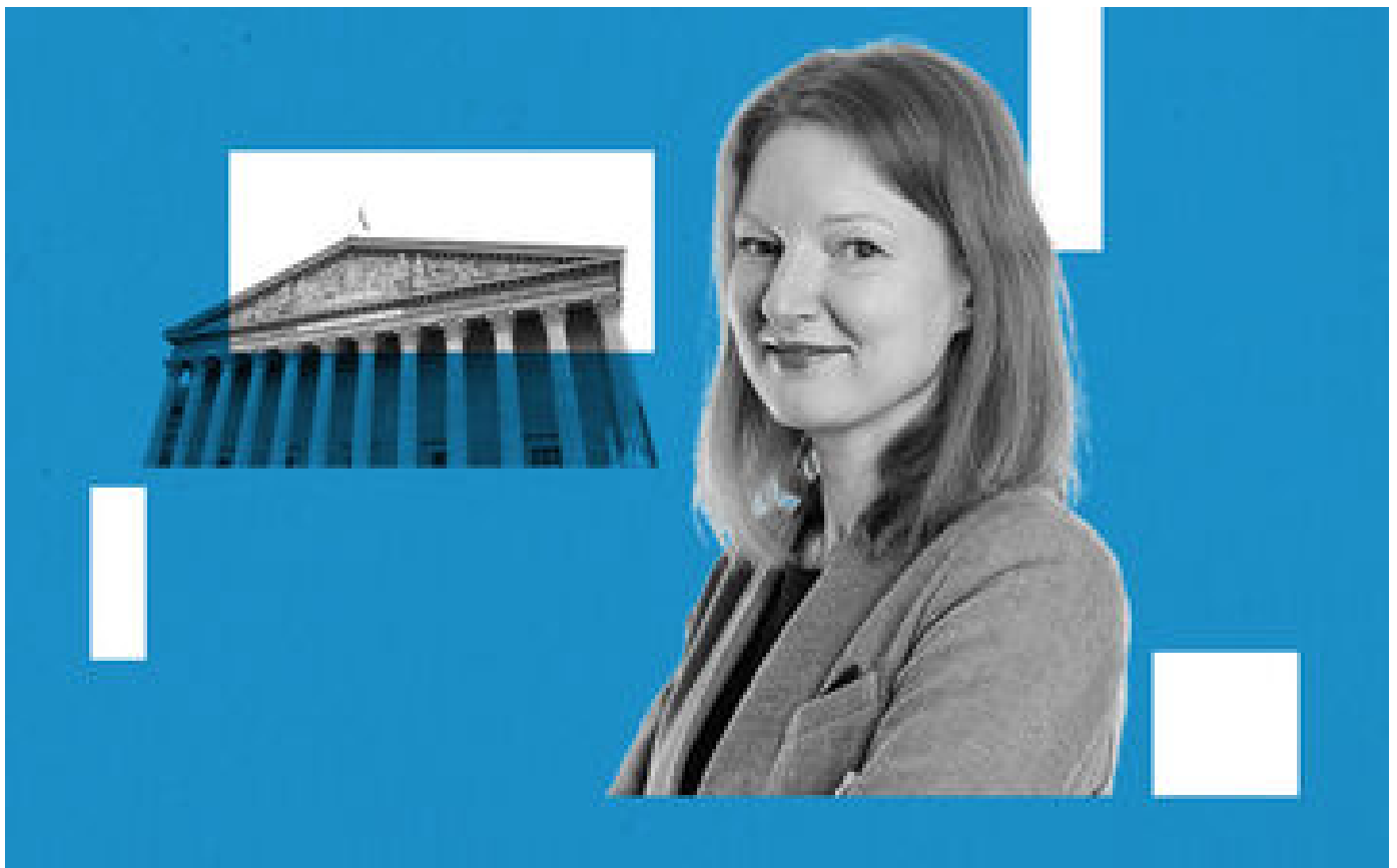
« Pétrole contre nourriture » P