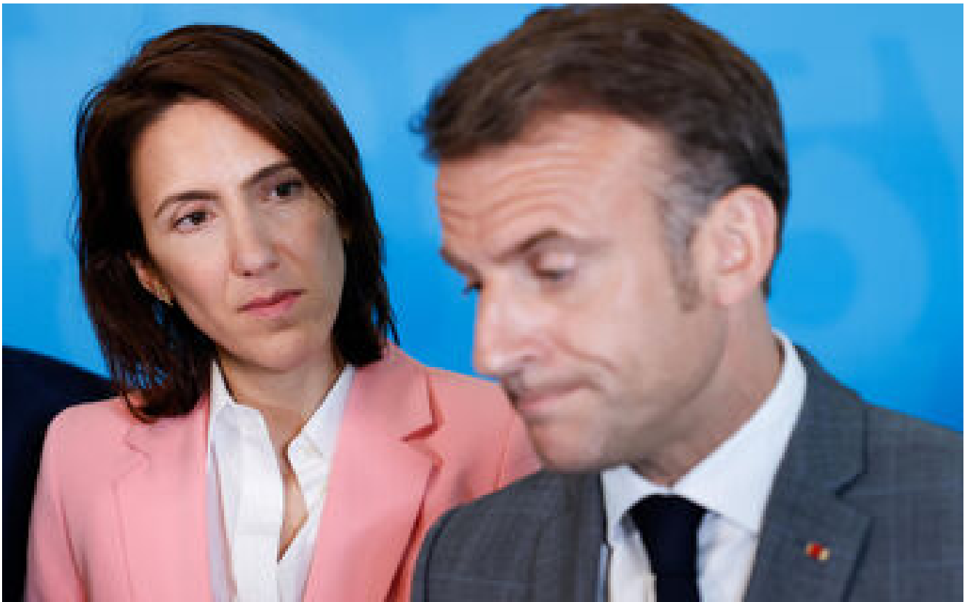
« On aurait dû avoir une liste plus tôt » : la majorité tarde à choisir ses candidats aux européennes P