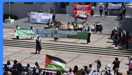
Des manifestations pro-palestiniennes agitent