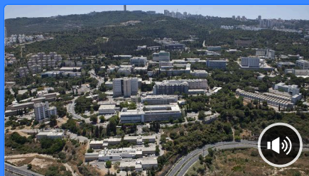
Israël: gloire aux startups (3/5)