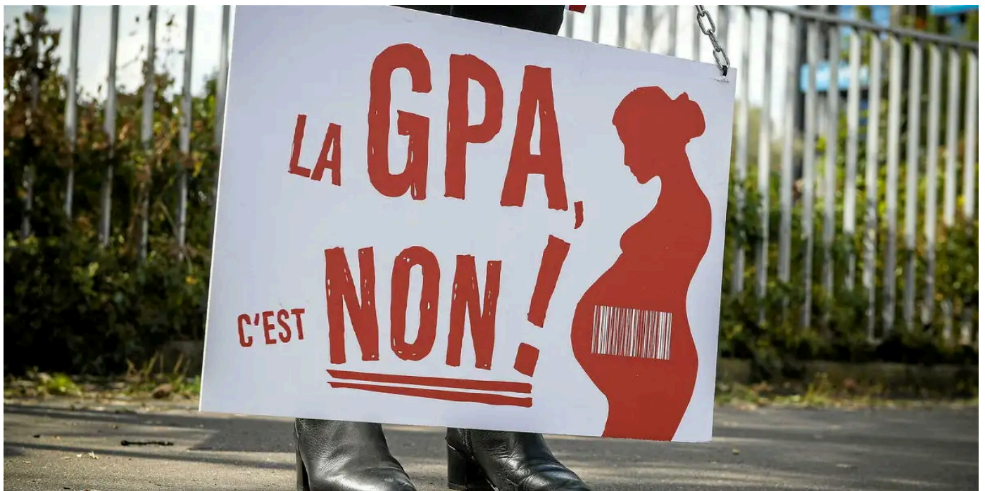
Une manifestation contre la GPA à Paris en septembre 2021.